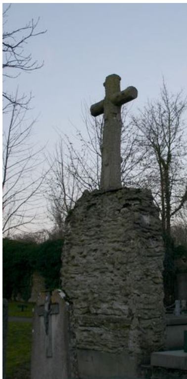
Stèle à croix monumentale, face postérieure.