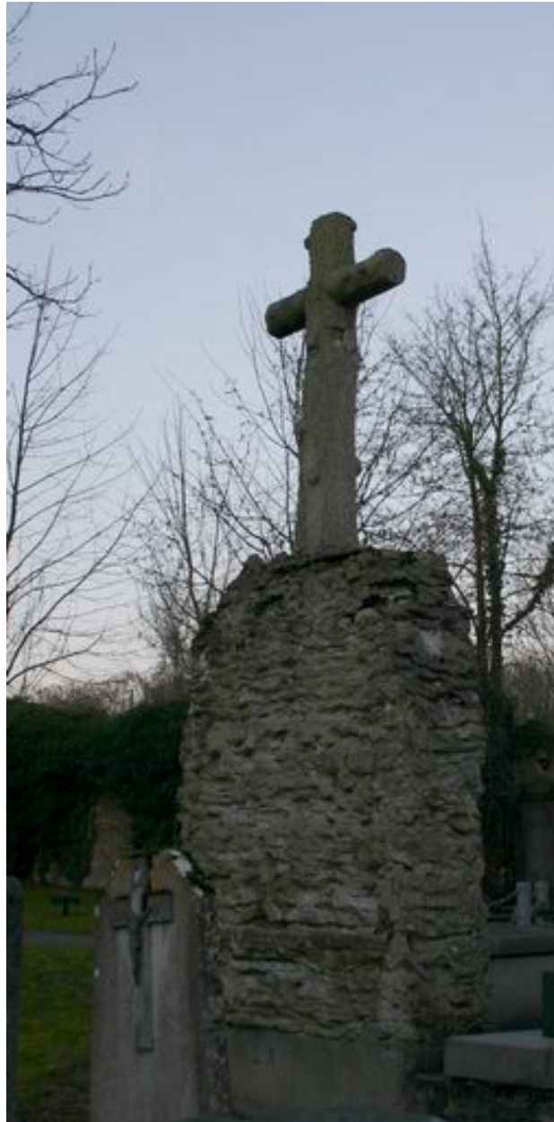
Stèle à croix monumentale, face postérieure.