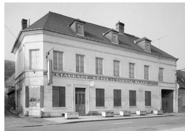
Elévation antérieure. IVR22_19856000769X