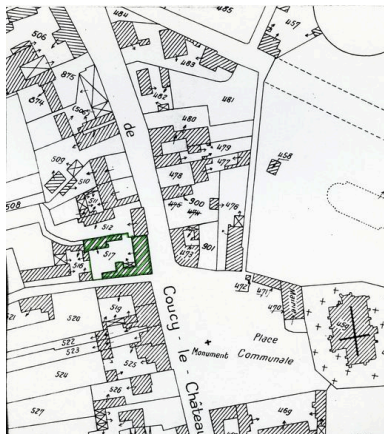
Plan de situation. Extrait du plan cadastral de 1962, section C2 517.