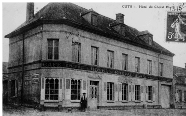
Etat avant 1914 (AP). IVR22_19856000398XB