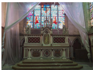
Vue générale IVR31_20106201875NUCA