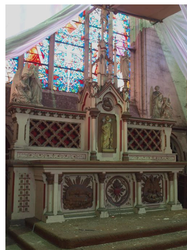
Vue latérale IVR31_20106201876NUCA