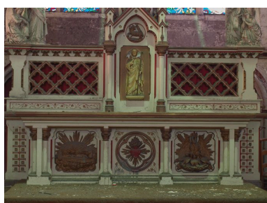
Vue partielle IVR31_20106201877NUCA