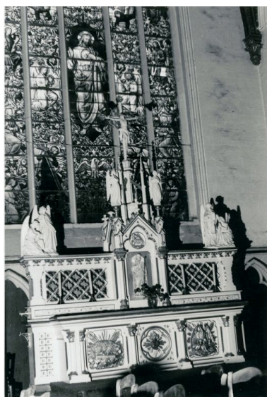
Vue générale IVR31_20106202219NUC