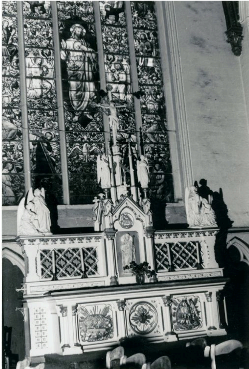
Vue générale (phot. Wintrebert, 1978, fonds AOA62)