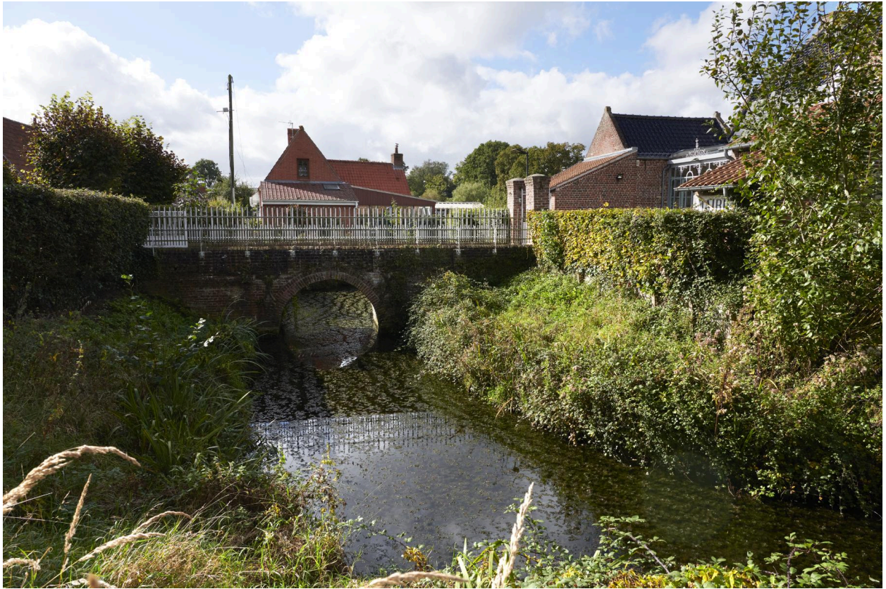
Pont de brique enjambant le fossé en eau.