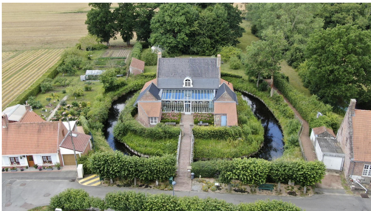
Vue aérienne du presbytère.