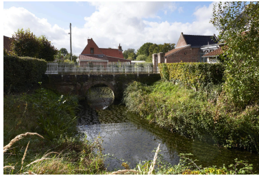
Pont de brique enjambant le fossé en eau.