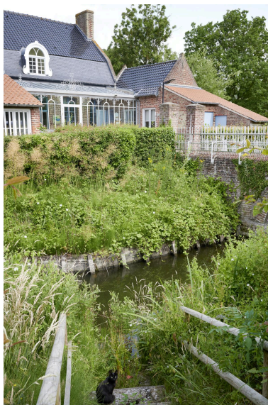
Le fossé en eau et les bâtiments en arrière-plan. IVR32_20235901151NUCA