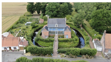
Vue aérienne du presbytère.