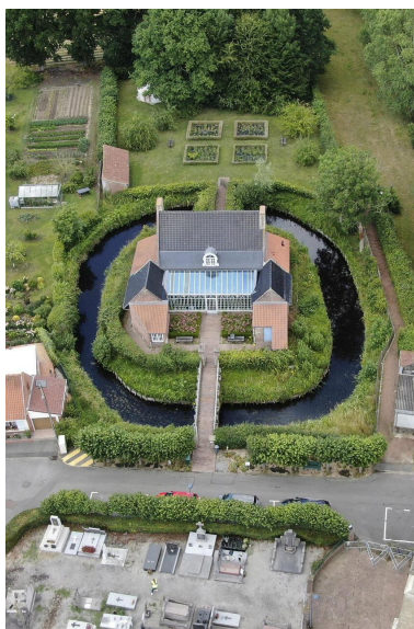
Vue aérienne de l'organisation générale du presbytère au sein de son fossé en eau. IVR32_20255901395NUCA