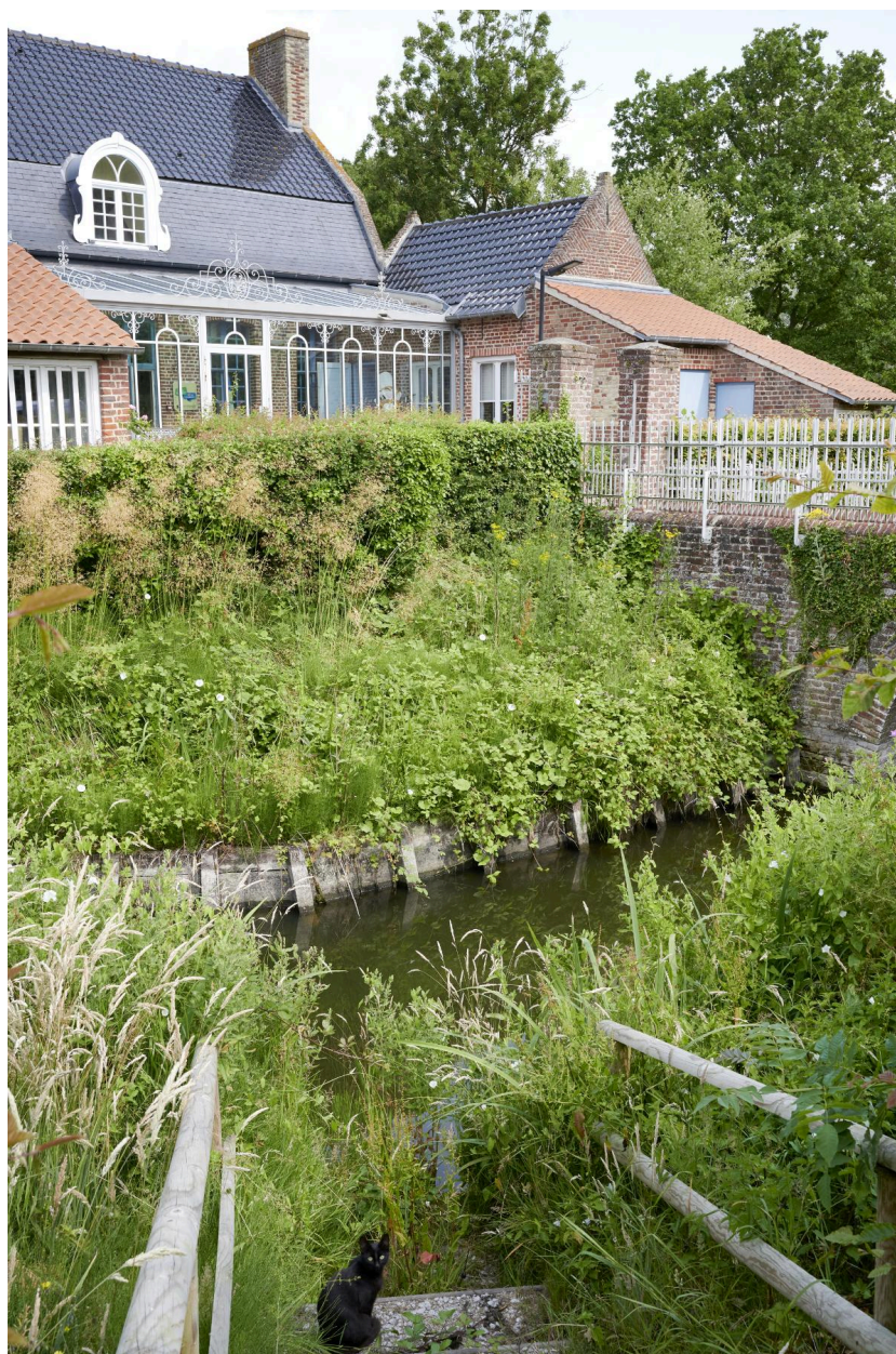
Le fossé en eau et les bâtiments en arrière-plan.