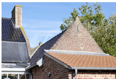
Détail de l'aile est.