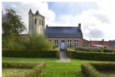
Vue depuis le jardin.