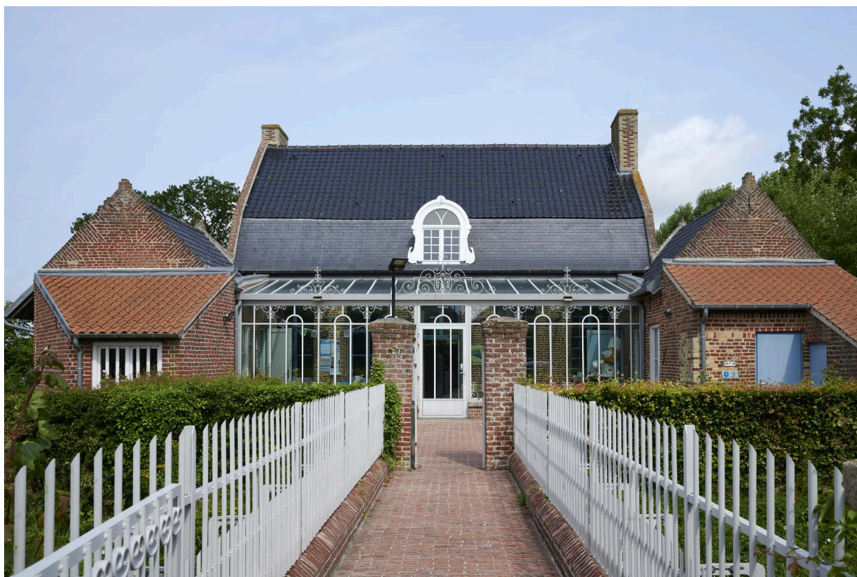
Vue du bâtiment depuis le pont.