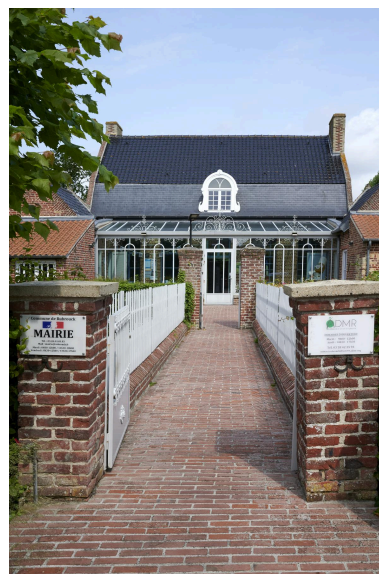
Pilastre du pont, bâtiment principal en fond, vue depuis la rue. IVR32_20235901152NUCA