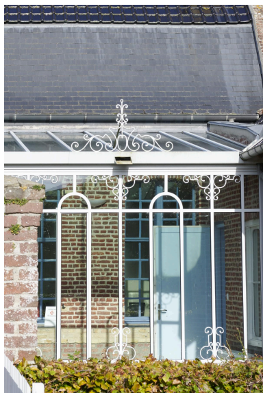
Verrière de la galerie vitrée sur cour.