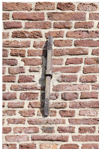
Fer d'ancrage droit avec gravures. IVR32_20255900904NUCA