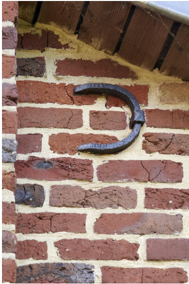
Fer d'ancrage en demi-lune.