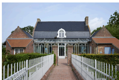
Vue du bâtiment depuis le pont. IVR32_20235901153NUCA