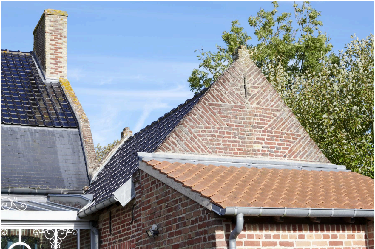
Détail de l'aile est.