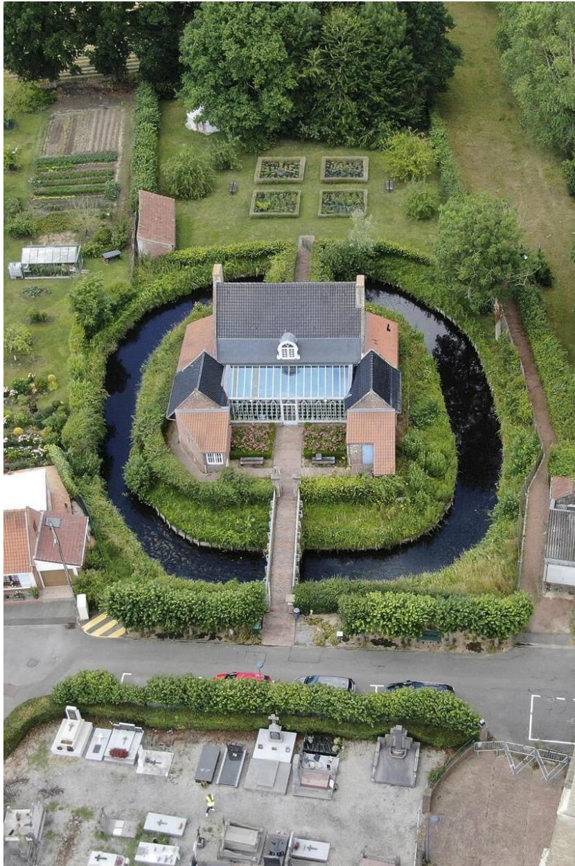
Vue aérienne de l'organisation générale du presbytère au sein de son fossé en eau.