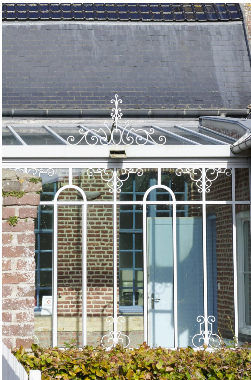
Verrière de la galerie vitrée sur cour.