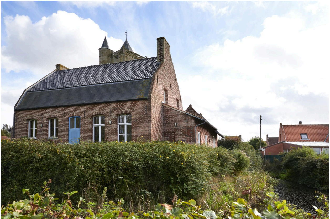
Vue générale depuis le nord-ouest.