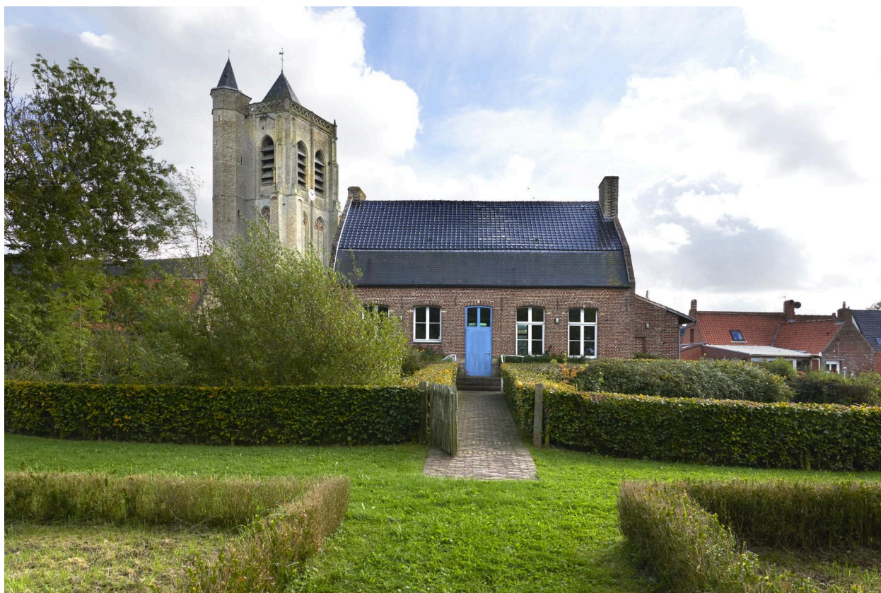
Vue depuis le jardin.