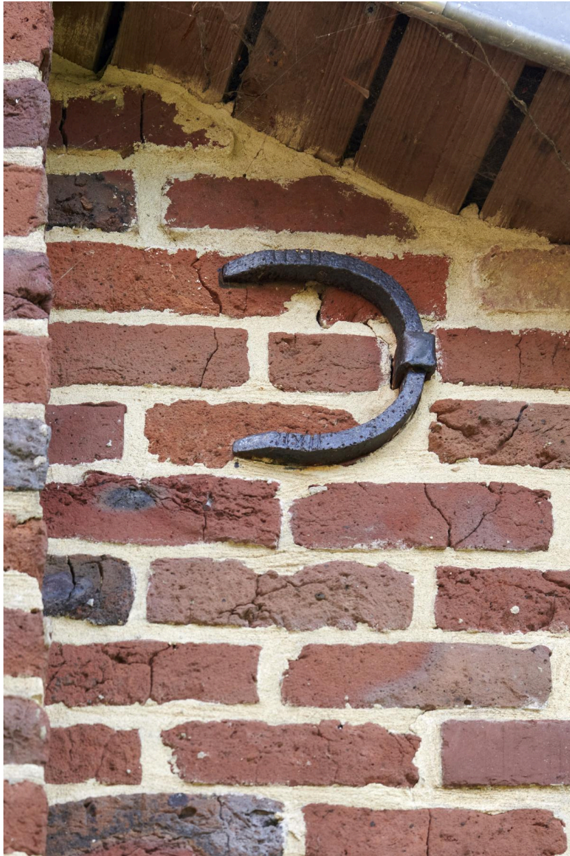
Fer d'ancrage en demi-lune.