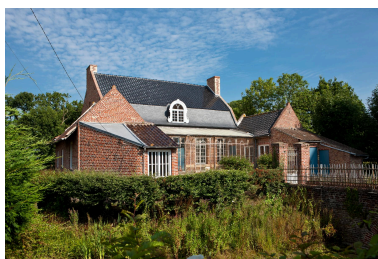
Vue générale depuis la rue. IVR32_20115900447NUC4A