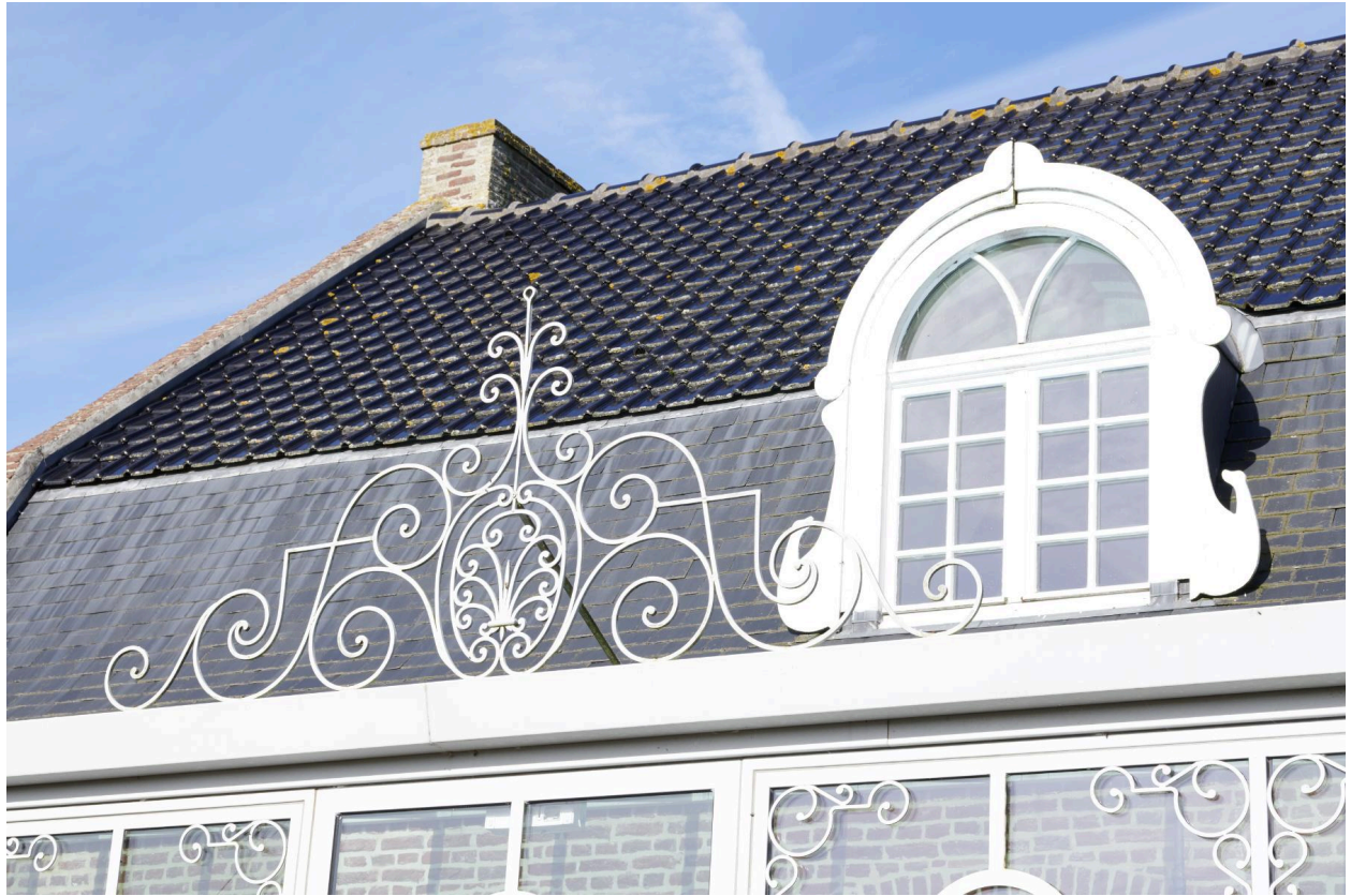
Détail de la lucarne principale et des ferronneries de la verrière.