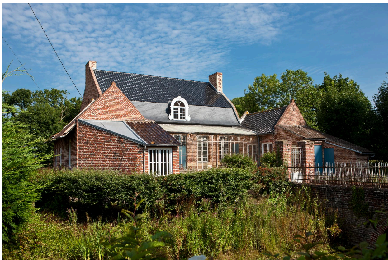
Vue générale depuis la rue.