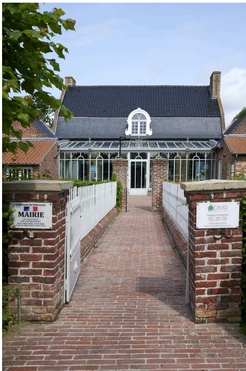
Pilastre du pont, bâtiment principal en fond, vue depuis la rue.