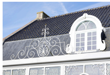
Détail de la lucarne principale et des ferronneries de la verrière. IVR32_20255900795NUCA