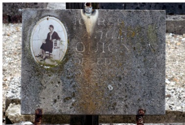
Détail sur la plaque à épitaphe.