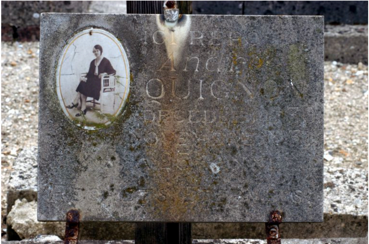
Détail sur la plaque à épitaphe.