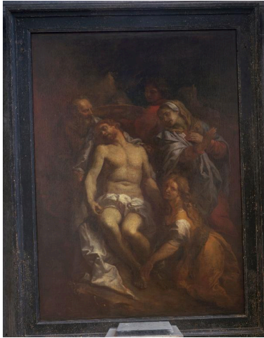
Vue générale. IVR22_19966003852VA