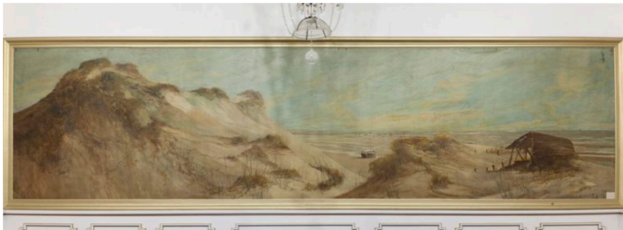
Plage de Groffliers, toile sans signature.