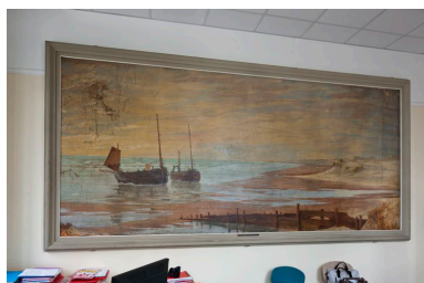
Bâteaux en mer. IVR31_20116201013NUCA