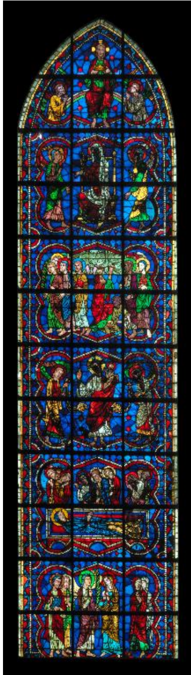
Vue générale de la verrière. IVR22_20130200005NUC2AQ