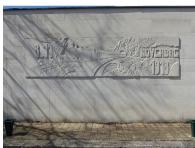
Vue du décor de la stèle.