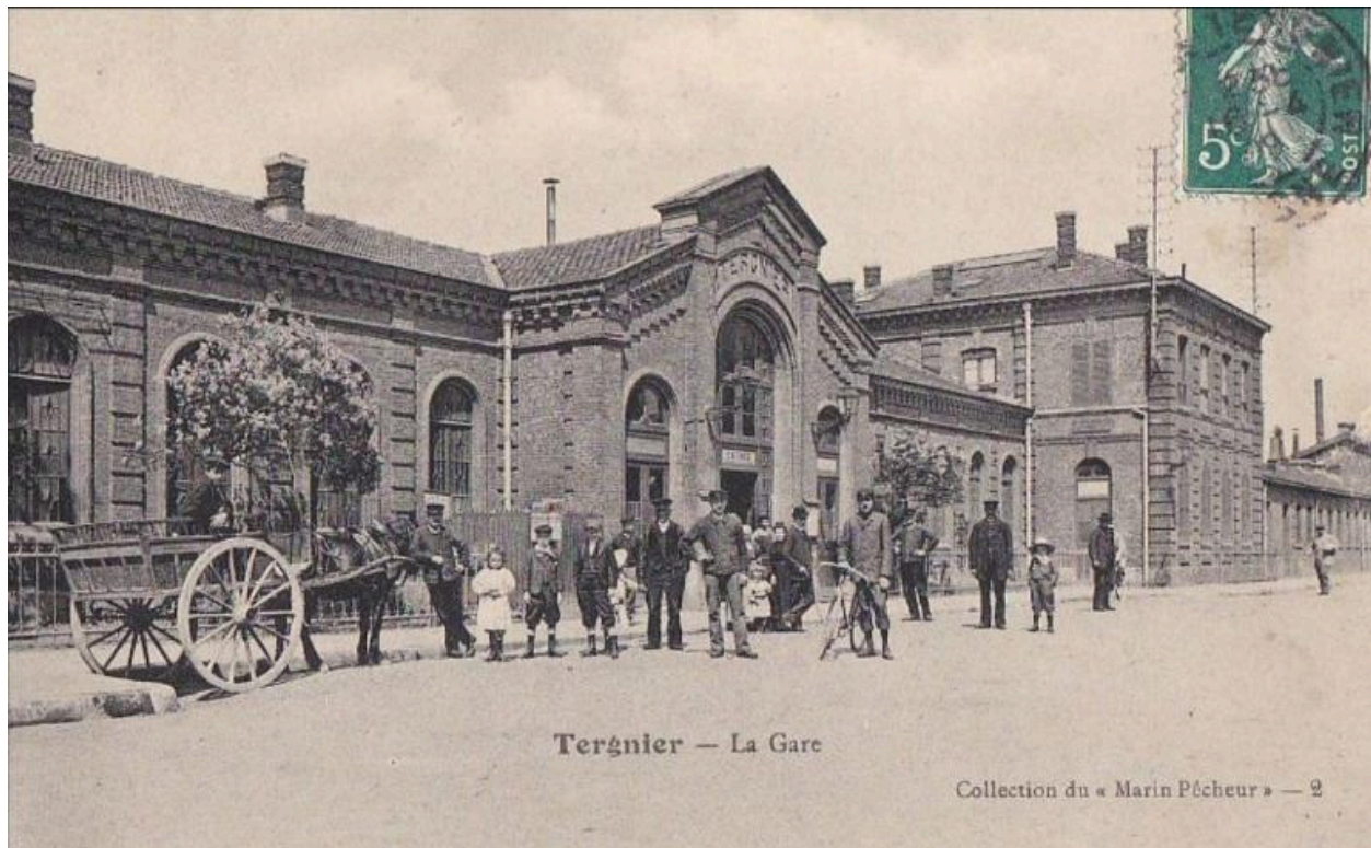
La gare de Tergnier avant 1914, carte postale.