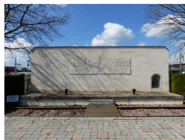
Vue générale. IVR32_20210205031NUCA