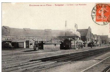
La gare et les rotondes de Tergnier, carte postale, avant 1914 (coll. part.). IVR32_20170205078NUC2A