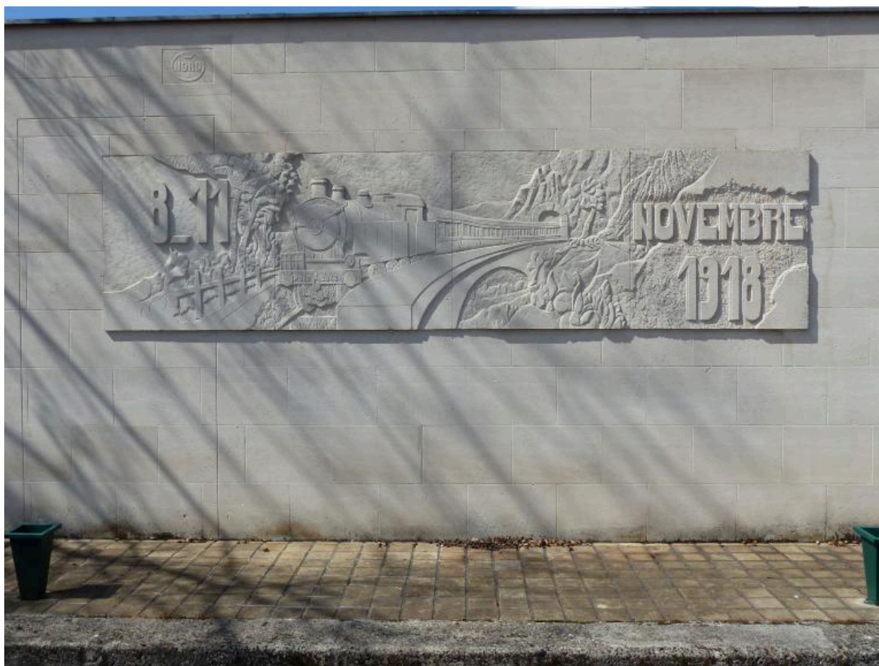
Vue du décor de la stèle.