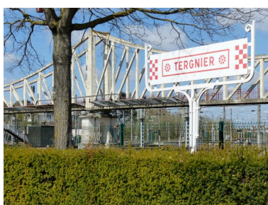
Panneau indicateur de la gare de Tergnier.