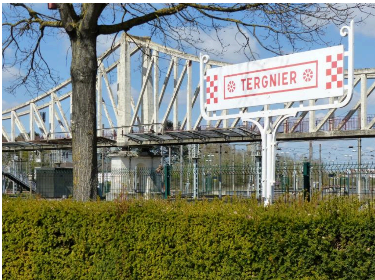
Panneau indicateur de la gare de Tergnier.