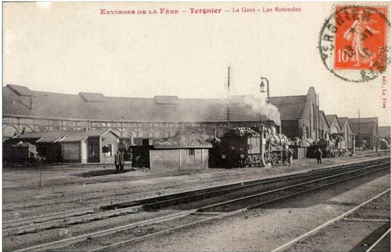
La gare et les rotondes de Tergnier, carte postale, avant 1914.