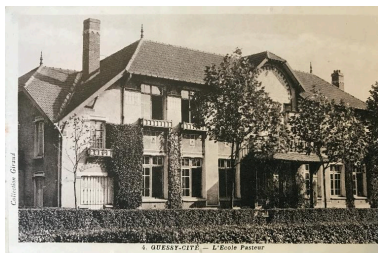
L'école Pasteur, carte postale vers 1930.