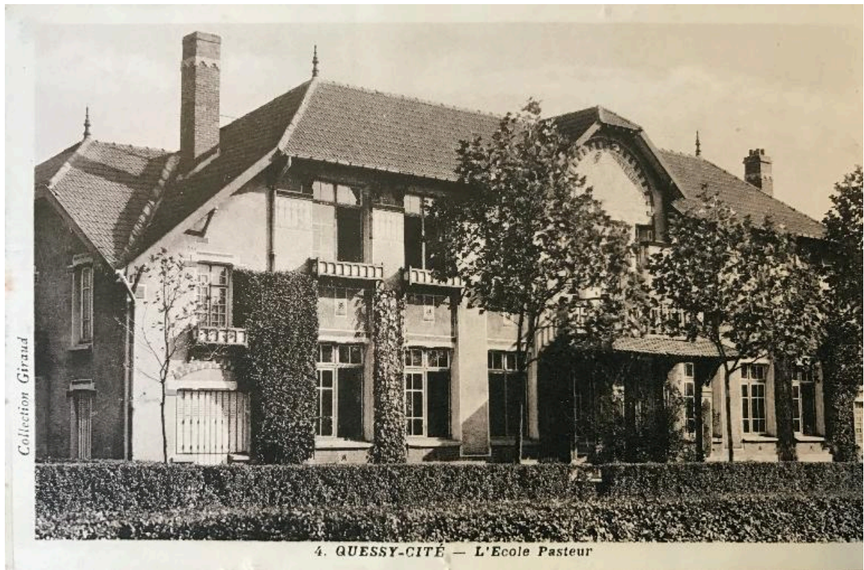
L'école Pasteur, carte postale vers 1930.