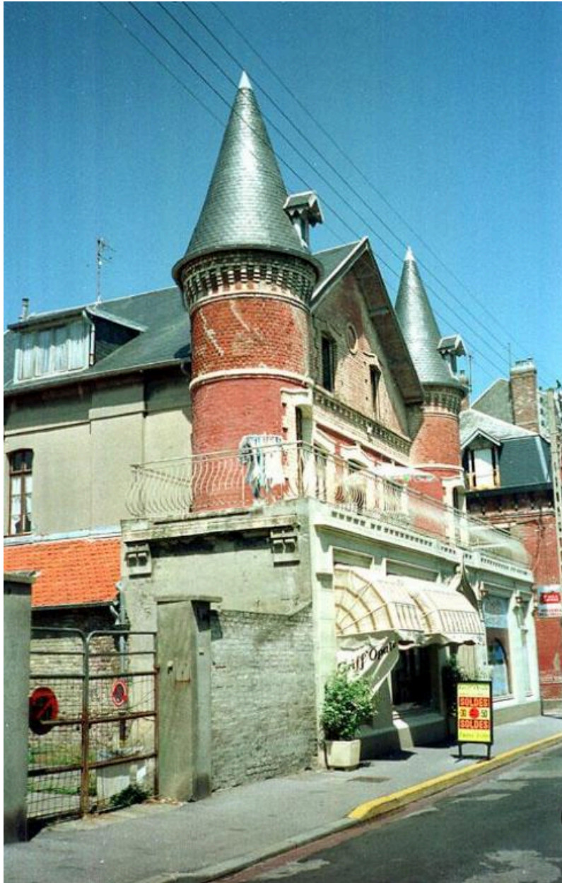
Vue d'ensemble de trois quarts.