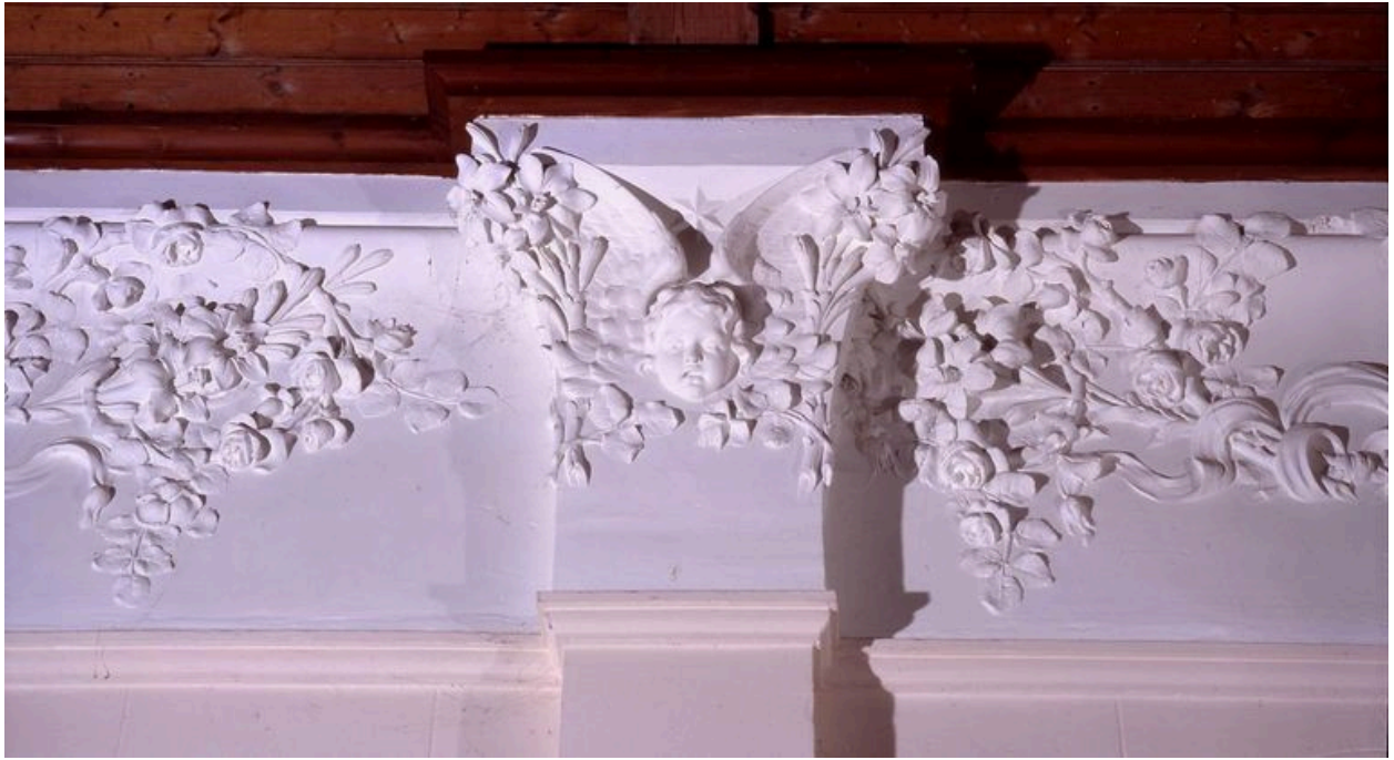
Détail du décor de la nef.