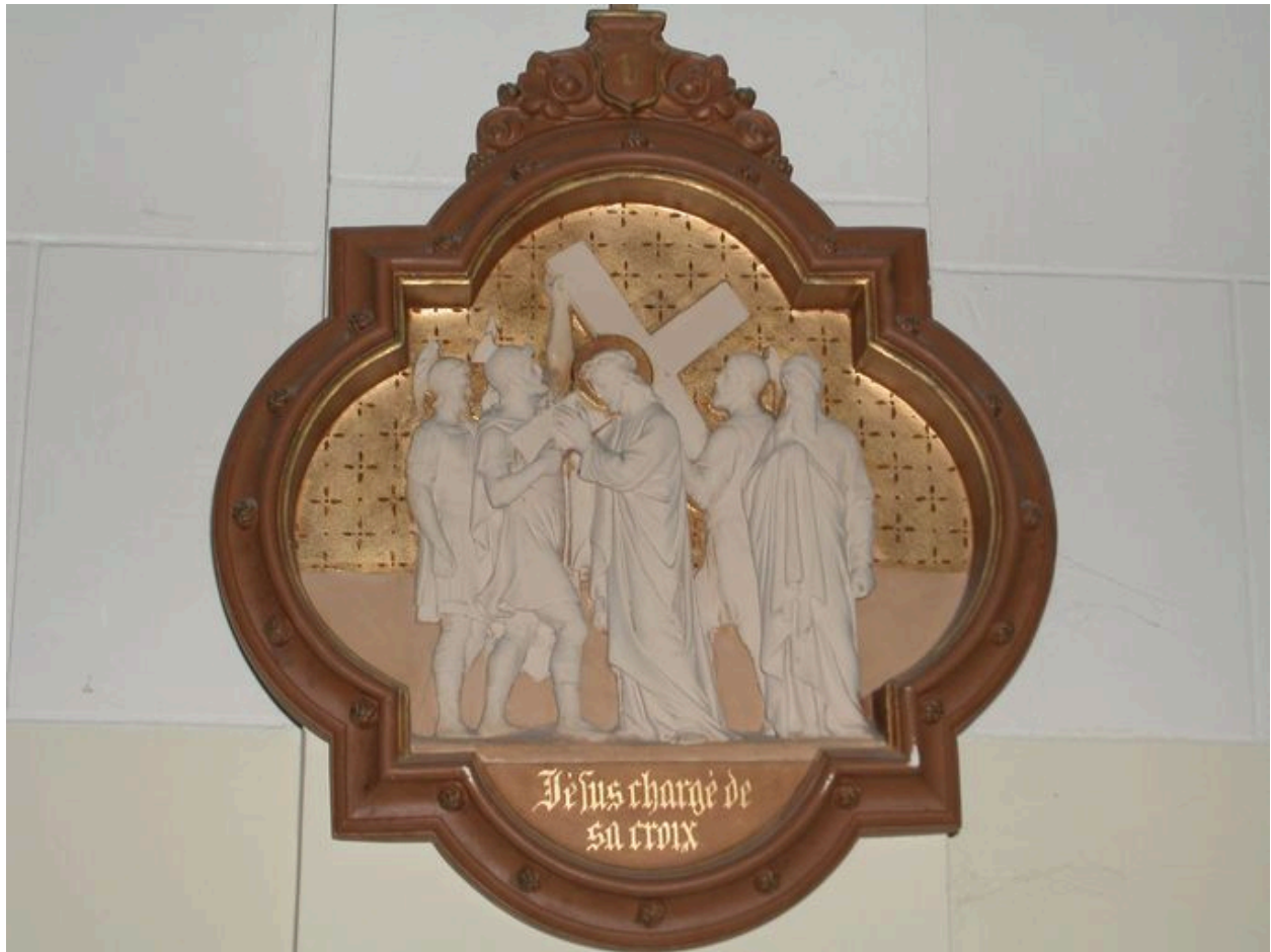
Détail d'une scène du chemin de croix.