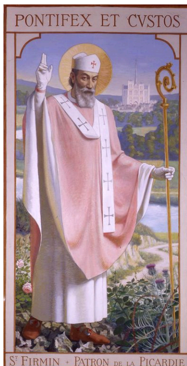
Saint Firmin, huile sur toile, par Léopold Delbeke, 1924.