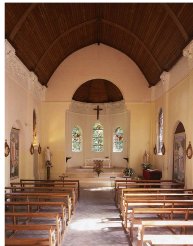
Vue de la nef.