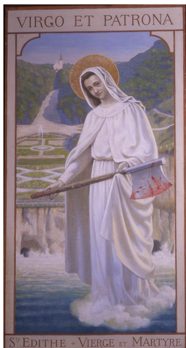
Sainte Edith, huile sur toile, par Léopold Delbeke, 1924.