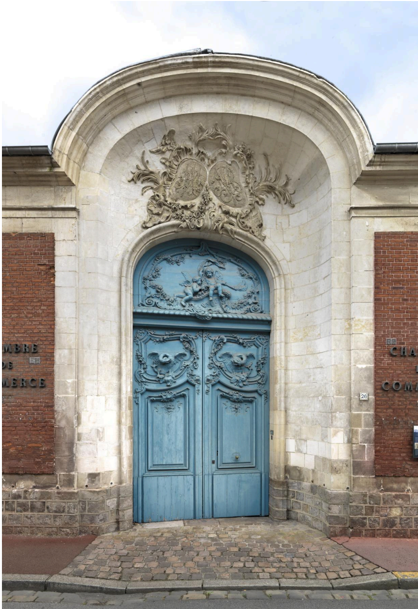
Portail de l'hôtel Monnecôve.