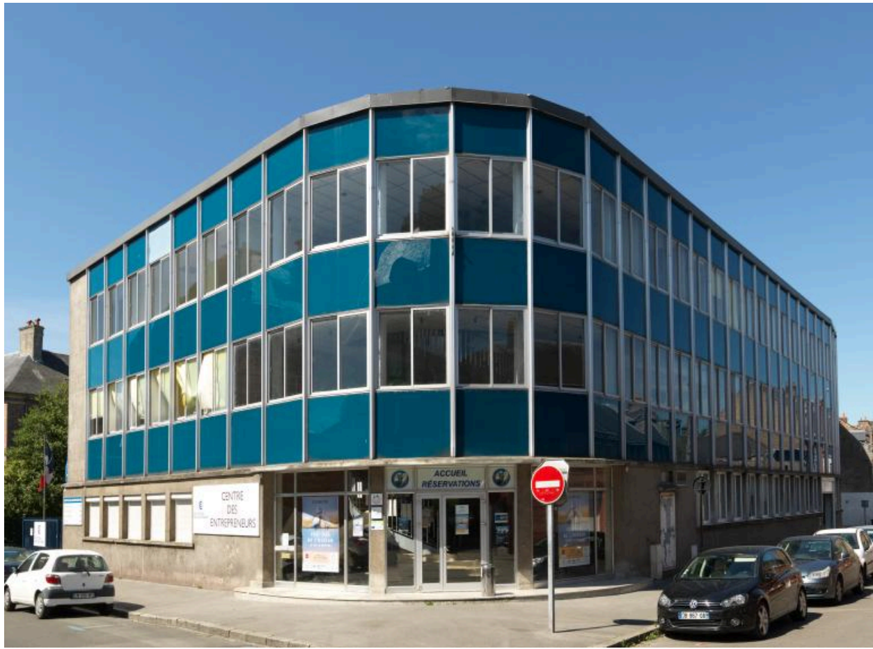
Immeuble de bureaux de la chambre de commerce. Vue depuis le carrefour des rues du Chevalier-de-la-Barre et des Grandes-Ecoles.