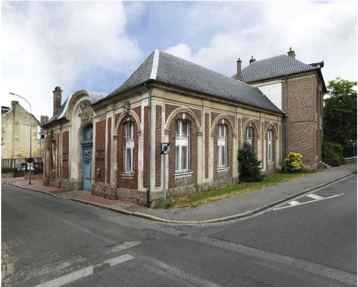
Vue générale depuis le croisement des rues Lesueur et du Chevalier-de-La-Barre.