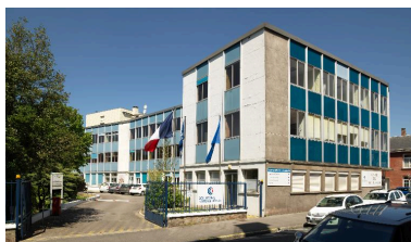
Immeuble de bureaux de la Chambre de commerce. Vue depuis la rue du Chevalier-de-la-Barre. IVR32_20178000235NUC2A