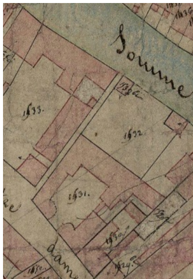
Abbeville. Plan cadastral. Sections E1, parcelles 1531-1532, 1822 (AD Somme ; 3P 1250/3). IVR32_20168005849NUCA