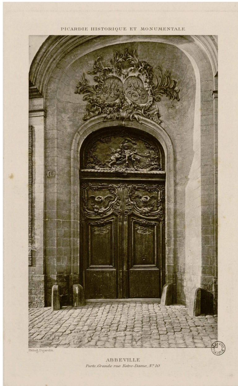
Porte de l'hôtel de Monnecove, héliogravure, par Dujardin, [s. d.], extrait de la "Picardie historique et monumentale" (BM Abbeville ; fonds Macqueron Ab.U166).