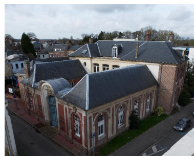
Vue générale. IVR32_20178000130NUC2A