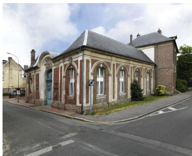
Vue générale depuis le croisement des rues Lesueur et du Chevalier-de-La-Barre.