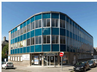
Immeuble de bureaux de la chambre de commerce. Vue depuis le carrefour des rues du Chevalier- de-la-Barre et des Grandes-Ecoles.