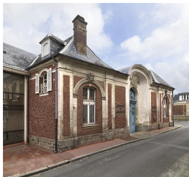
Vue générale depuis la rue Lesueur. IVR22_20168000674NUC2A