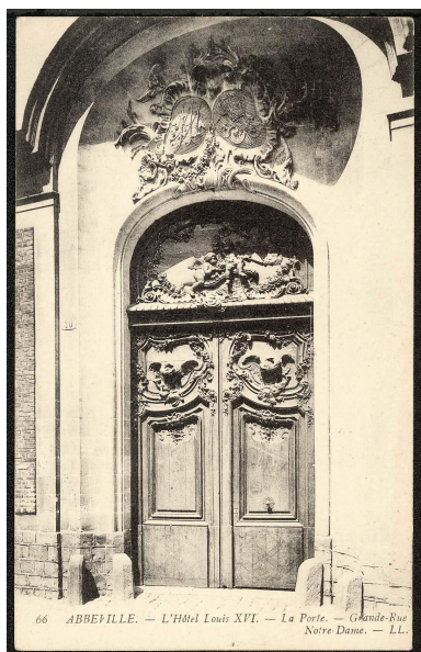
Abbeville, l'hôtel Louis XVI, la Porte, Grande Rue, Notre-Dame, [s.d.] (BM Abbeville ; fonds de cartes postales CP ABB 2-164).