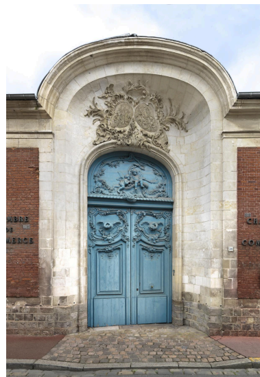
Portail de l'hôtel Monnecôte.