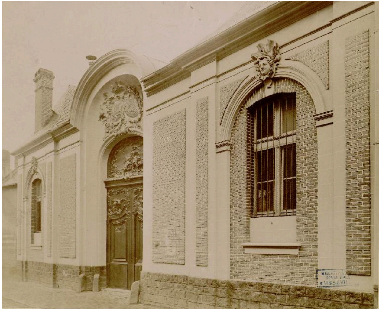
Façade de l'hôtel de Monnecove bordant la Grande-Rue-Notre-Dame-du-Châtel – aujourd'hui rue Lesueur –, photographie, s. d. (BM Abbeville ; fonds Macqueron Ab.U169).