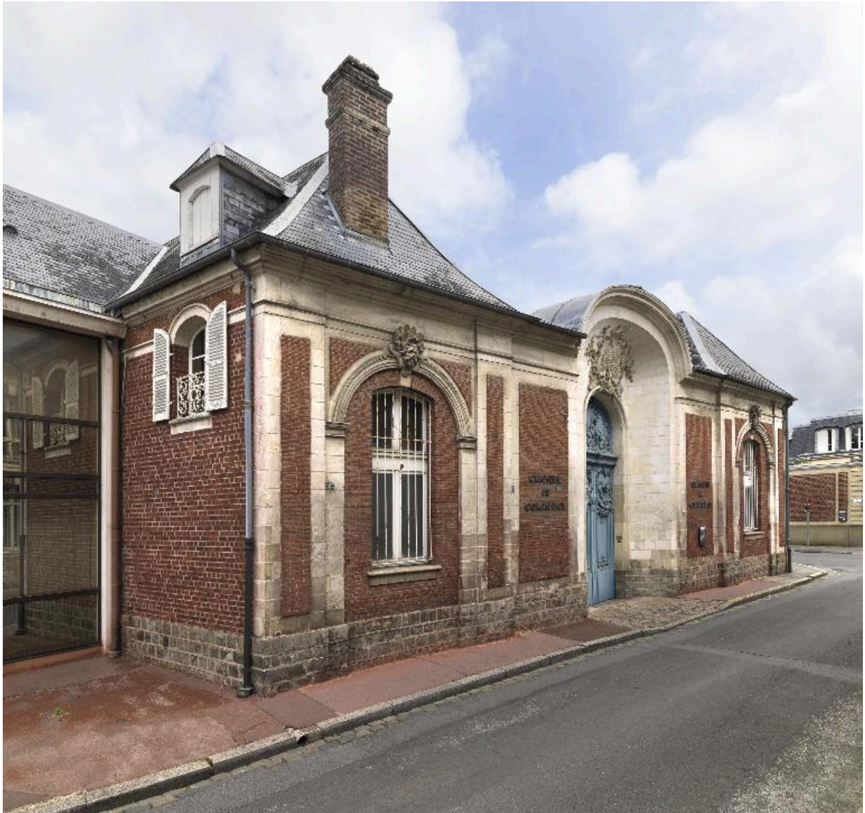
Vue générale depuis la rue Lesueur.