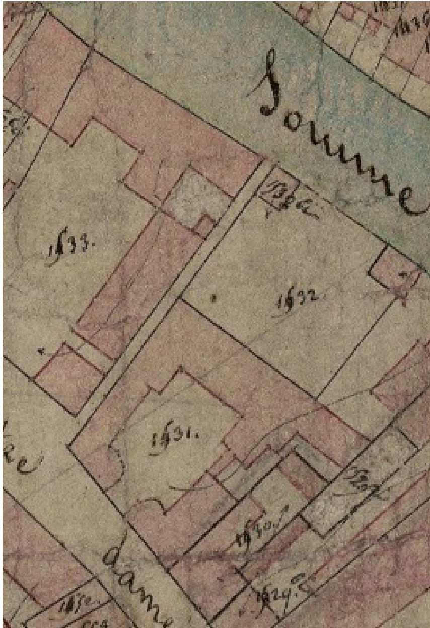
Abbeville. Plan cadastral. Sections E1, parcelles 1531-1532, 1822 (AD Somme ; 3P 1250/3).