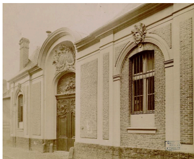
Façade de l'hôtel de Monnecove bordant la Grande-Rue-Notre-Dame-du-Châtel – aujourd'hui rue Lesueur –, photographie, s. d.