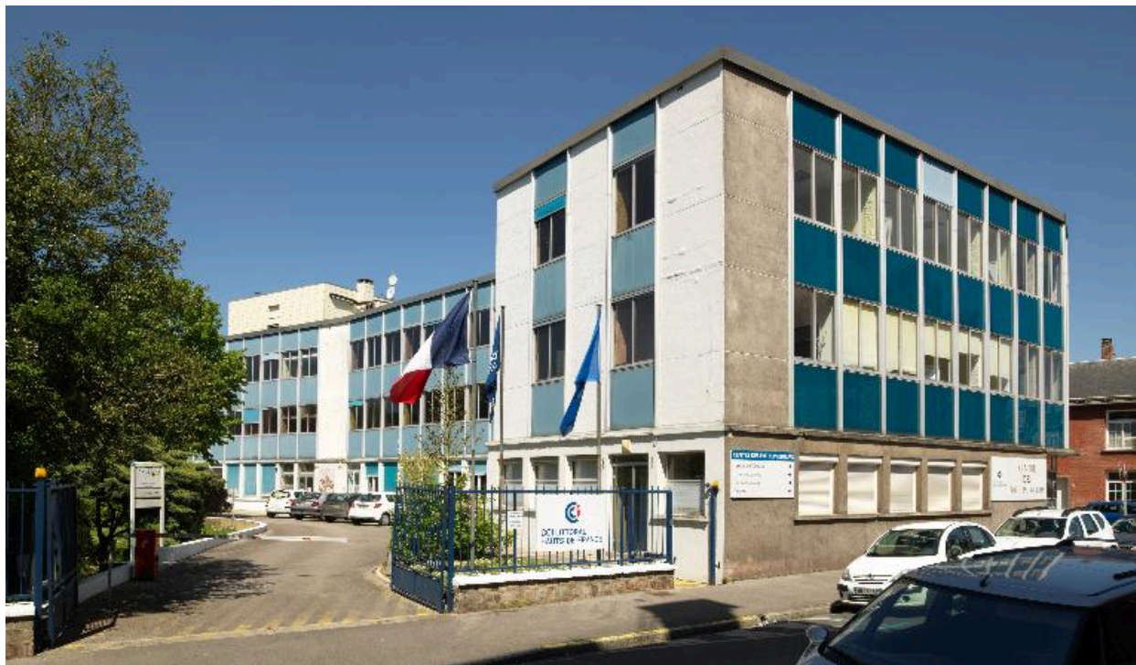
Immeuble de bureaux de la Chambre de commerce. Vue depuis la rue du Chevalier-de-la-Barre.