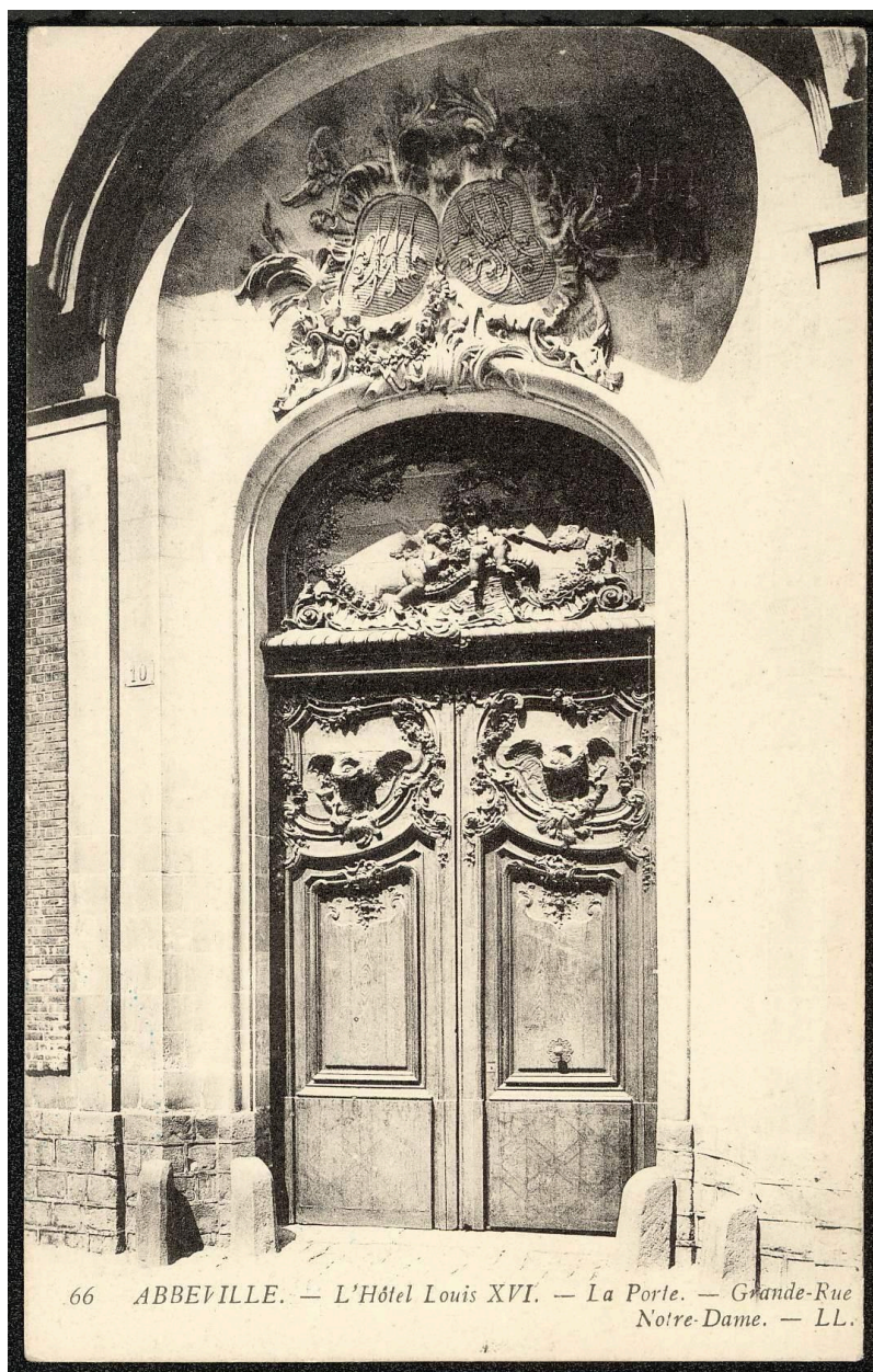
Abbeville, l'hôtel Louis XVI, la Porte, Grande Rue, Notre-Dame, [s.d.] (BM Abbeville ; fonds de cartes postales CP ABB 2-164).