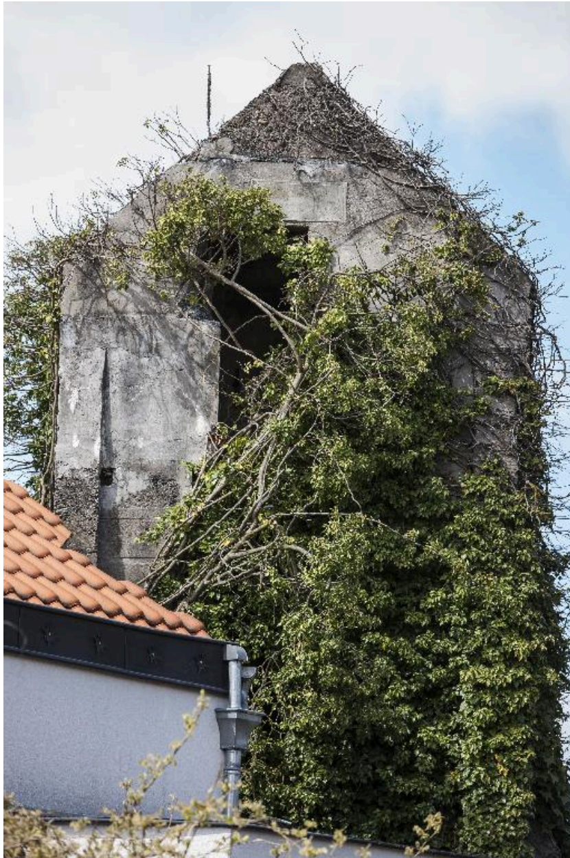
Tour casematée depuis la rue