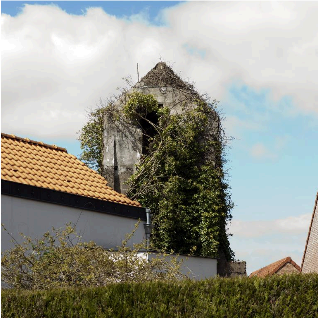
Tour casematée depuis la rue