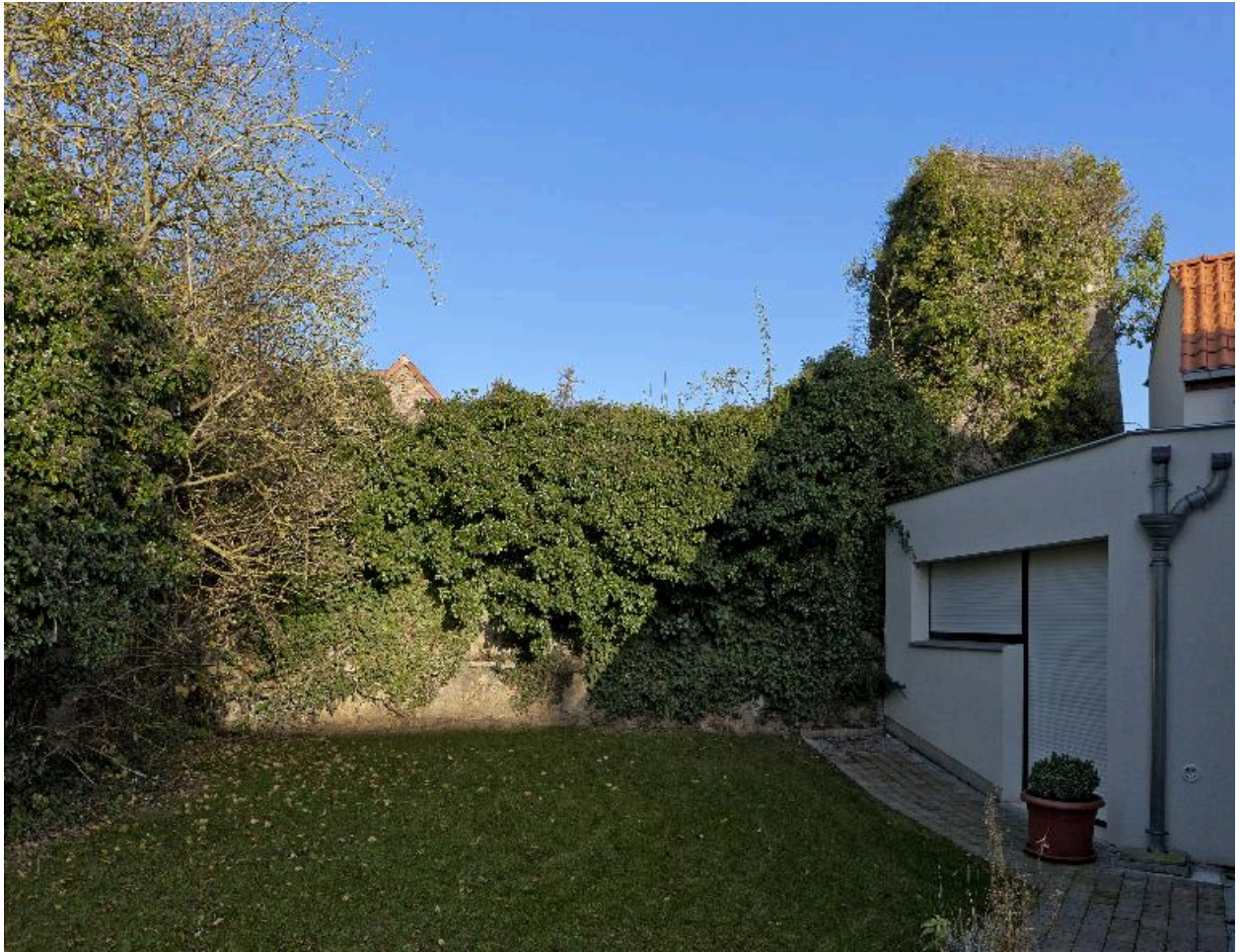
Partie de l'élévation ouest et tour casematée, à droite