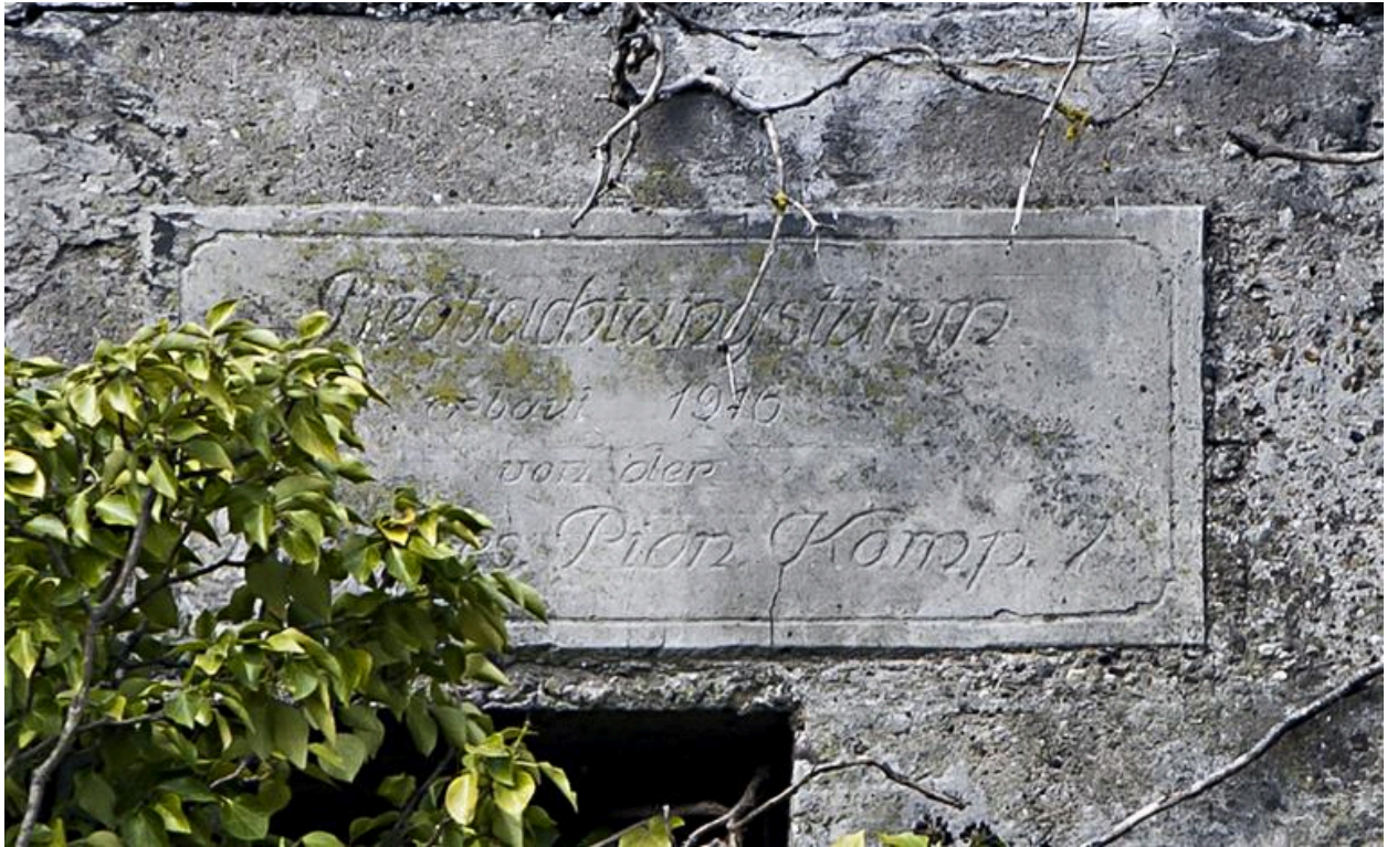
Médaille en ciment avec l'inscription suivante "Erbaut 1916 von den Bay. Res. Pion. Komp. 7" (Détail de la photo précédente)