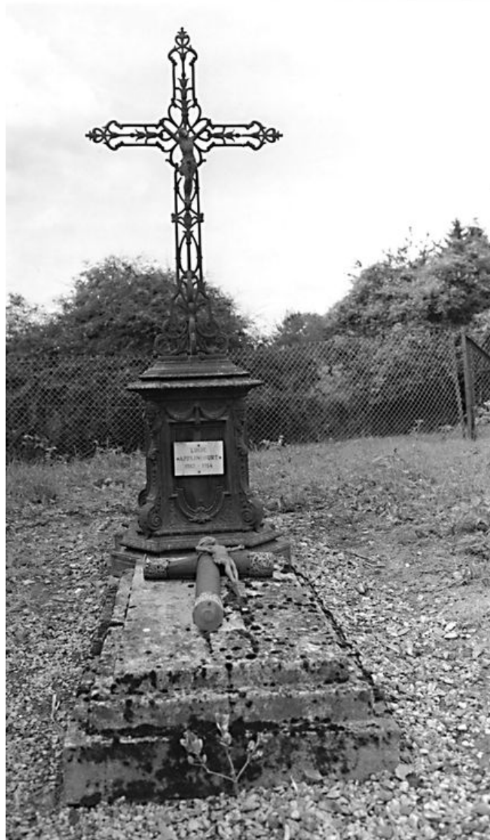
Tombeau de Lucie Applincourt, dans le cimetière. Le socle porte la marque du fabricant Alfred Corneau à Charleville.