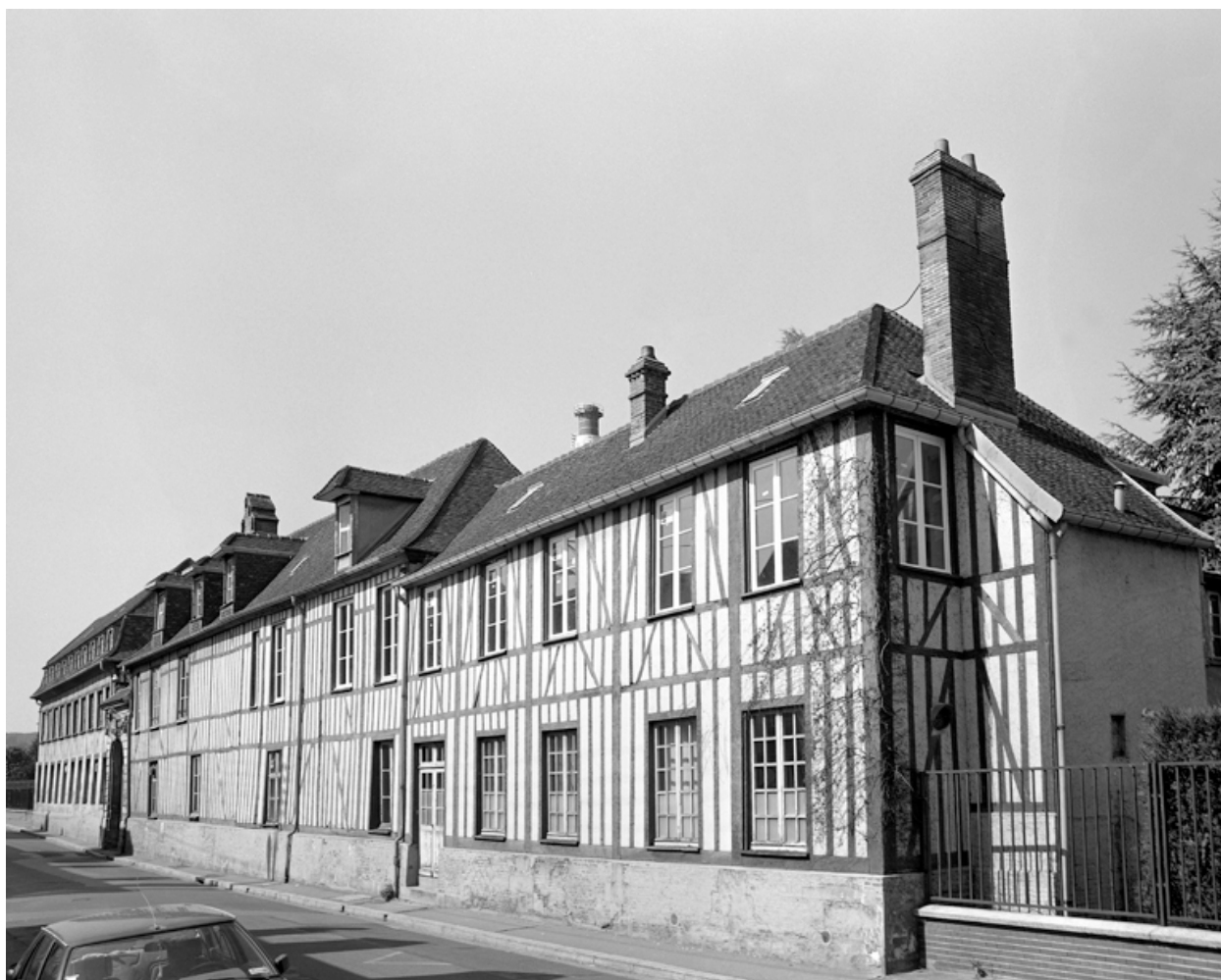
Vue latérale et ouest de la façade sud de la passementerie Gaitas.