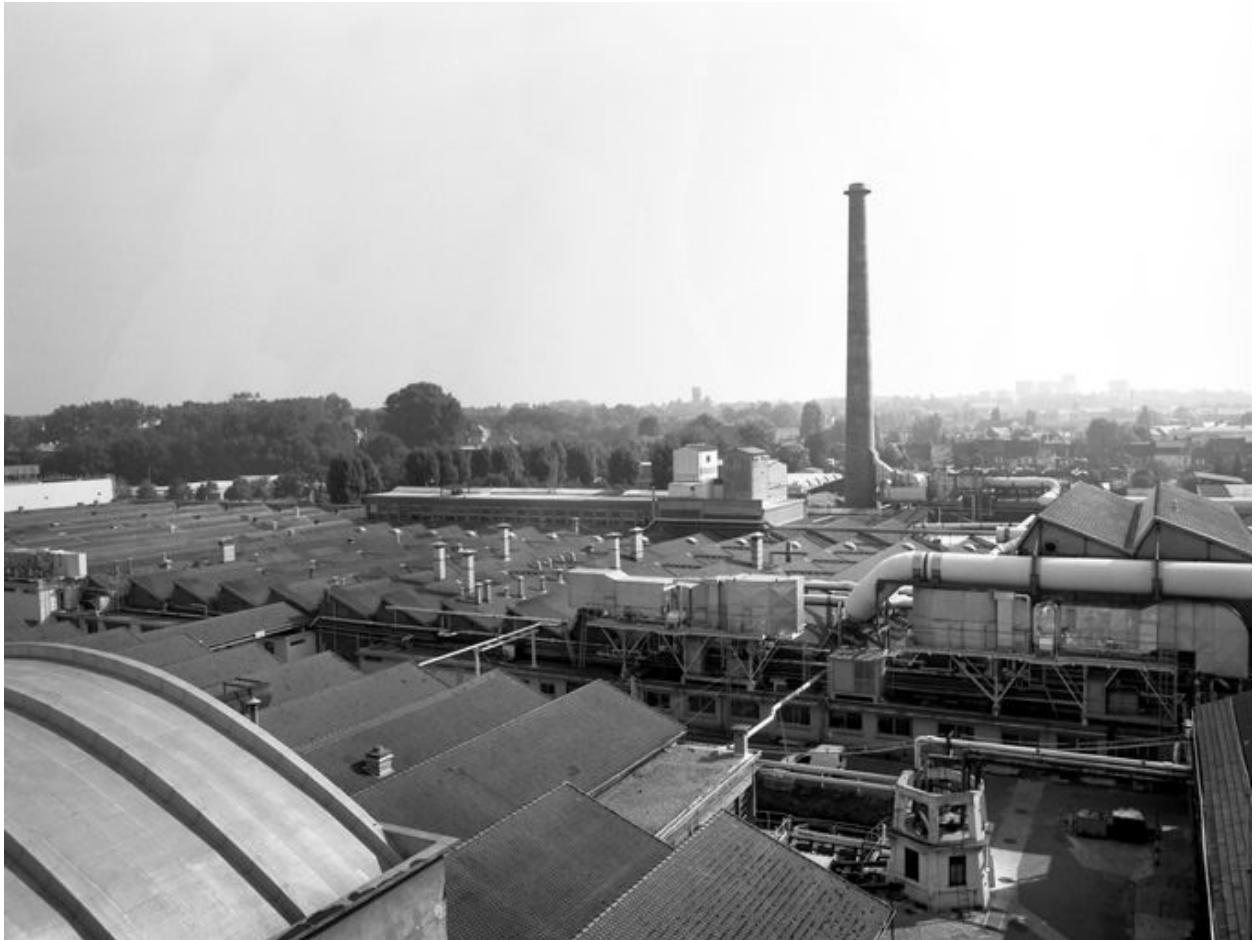
Vue plongeante sur le château d'eau et une partie des ateliers de fabrication construits après l'incendie de 1919.