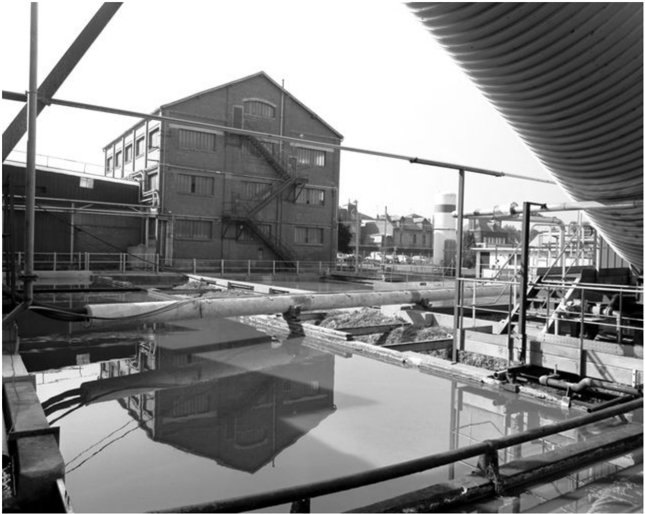
Les bassins de décantation construits dans les années 1920 avec, à l'arrière plan, le bâtiment n°4 datant des mêmes années mais non identifié.