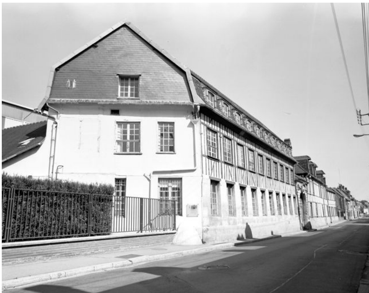
Vue latérale ouest est de la façade sud de la passementerie Gaitas.