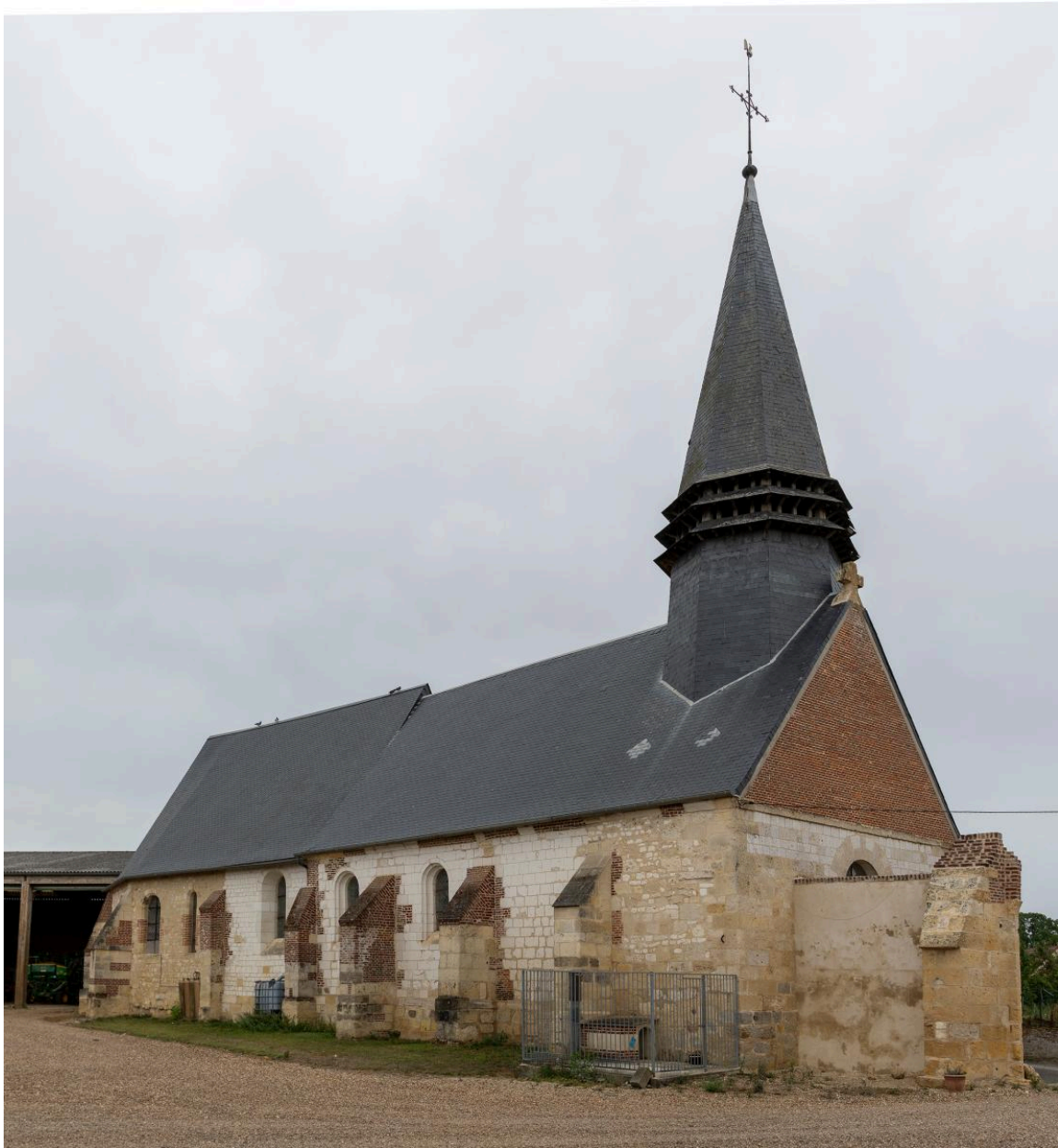
Vue depuis le nord-ouest.