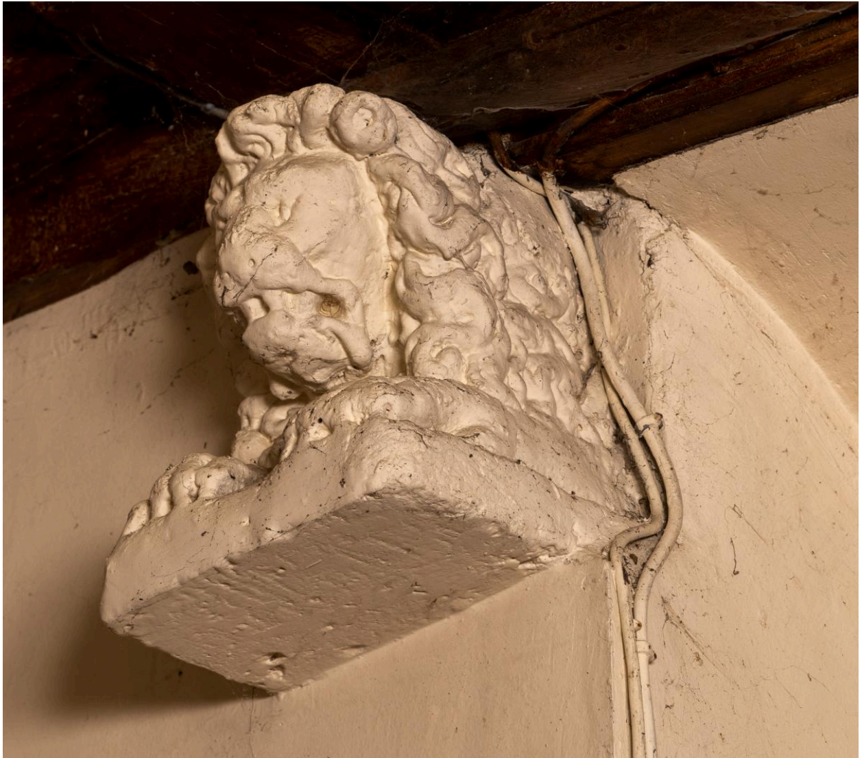
Blochet de la charpente du chœur.