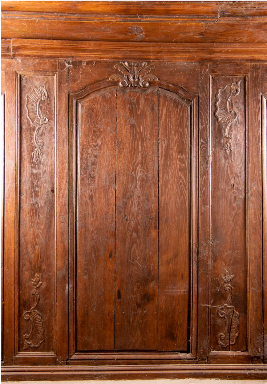
Panneau de lambris du chœur, 2e moitié du 18e siècle.