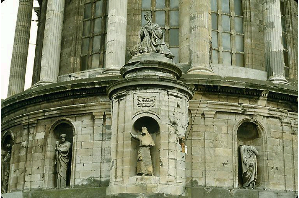
Vue d'ensemble angle nord-ouest, Saint Jean Baptiste, Saint Marc, apôtres.