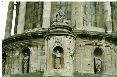
Vue d'ensemble angle nord-ouest, Saint Jean Baptiste, Saint Marc, apôtres. IVR31_19876201471ZA