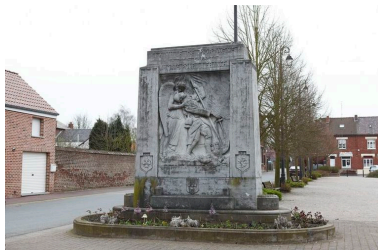
Vue générale du monument.