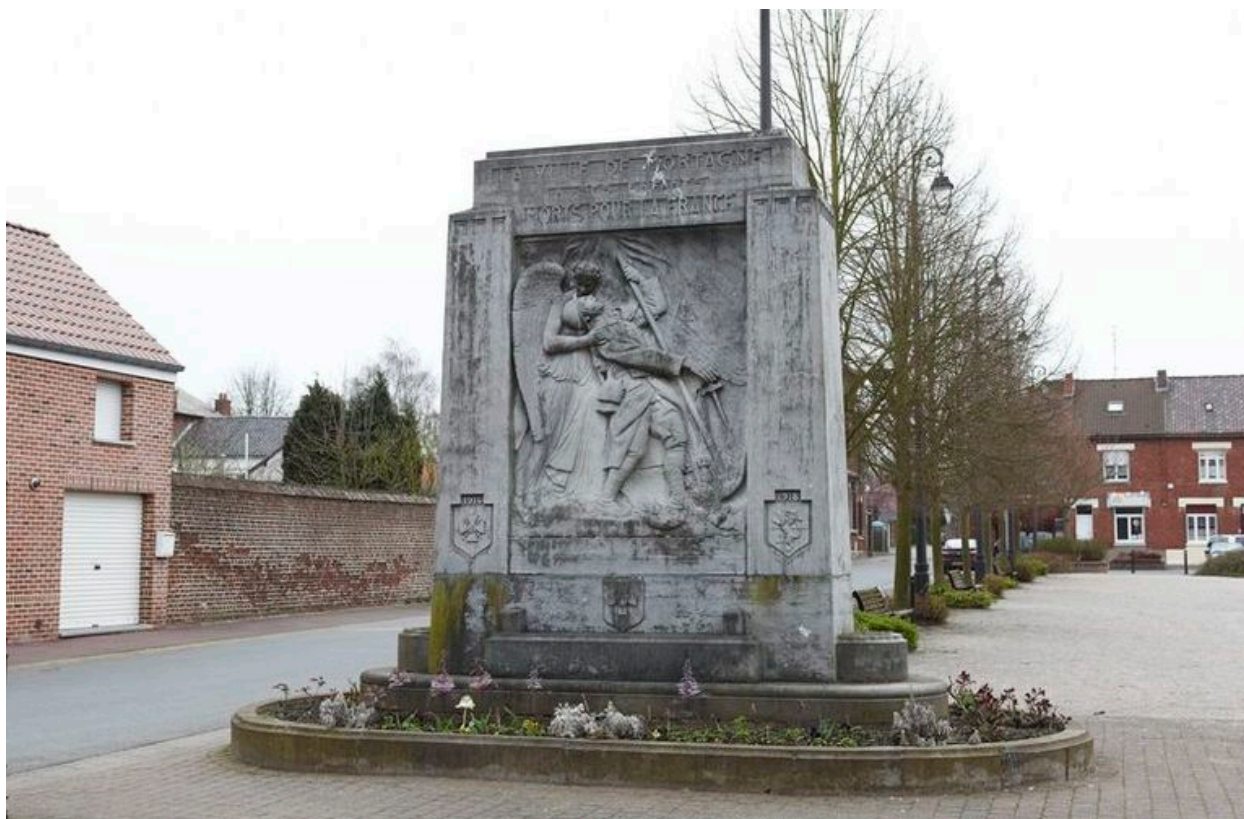
Vue générale du monument.