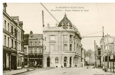
Vue de la place vers l'ouest et la rue de Tournai, le nouvel immeuble (reconstruction après la Première guerre) abritant la banque générale, carte postale, vers 1920 (Musée municipal Saint-Amand-les-Eaux). IVR31_20135908076NUCA