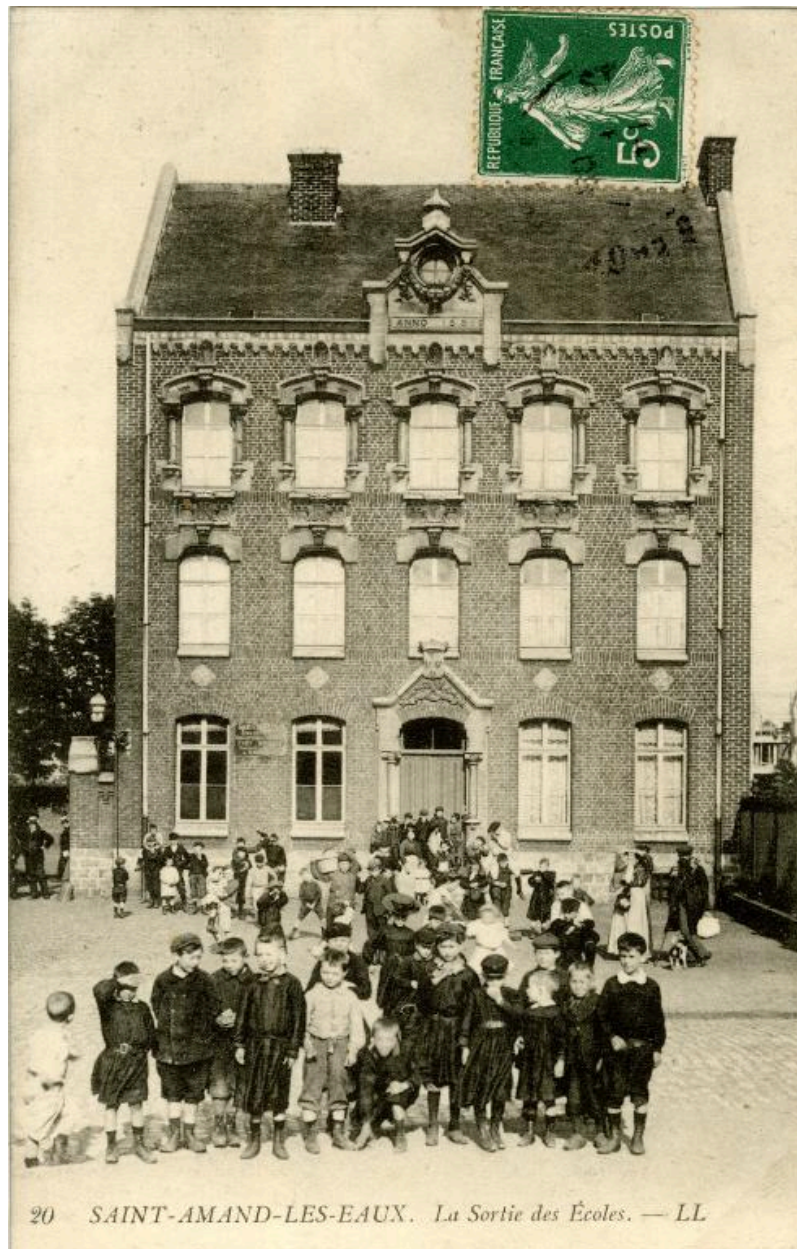
L'école construite en 1881 sur les ruines de l'ancienne abbaye, près de l'ancien échevinage, carte postale, début du 20e siècle (Musée municipal Saint-Amand-les-Eaux).