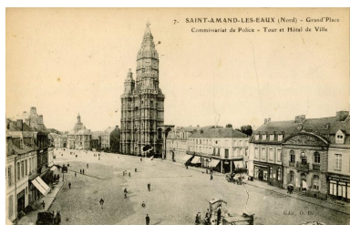
Vue générale de la place, côté est, hôtel de police, tour abbatiale et mairie (ancien échevinage), début du 20e siècle, carte postale (Musée municipal Saint-Amand-les-Eaux). IVR31_20135908071NUCA