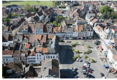
La place et la rue Thiers depuis la tour abbatiale. IVR31_20155901192NUCA

L'école construite en 1881 sur les ruines de l'ancienne abbaye, près de l'ancien échevinage, carte postale, début du 20e siècle (Musée municipal Saint-Amand-les-Eaux). IVR31_20135908077NUCA