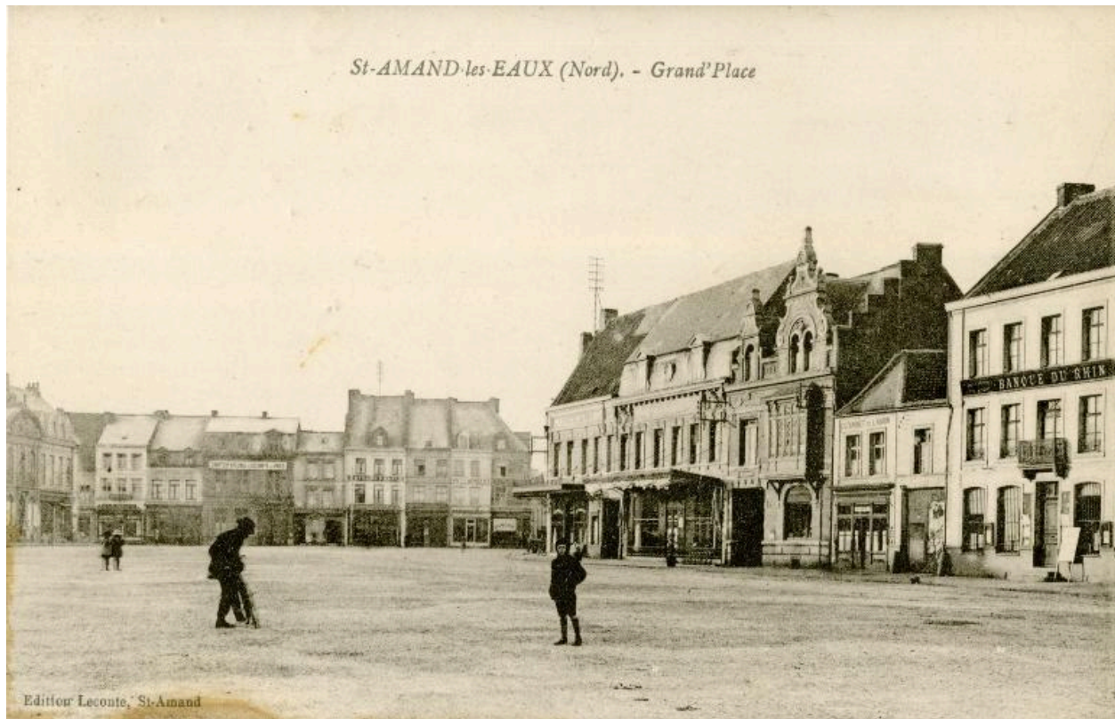
Vue générale de la place, côté ouest vers le sud, 1er (?) quart du 20e siècle après construction de la maison Blauwaert (pignon néo-flamand), carte postale (Musée municipal Saint-Amand-les-Eaux).