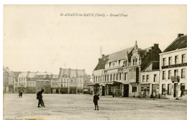
Vue générale de la place, côté ouest vers le sud, 1er (?) quart du 20e siècle après construction de la maison Blauwaert (pignon néo-flamand), carte postale (Musée municipal Saint-Amand-les-Eaux). IVR31_20135908074NUCA