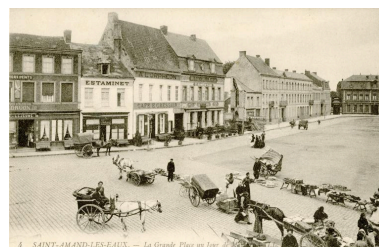
Vue générale de la place, côté ouest, début du 20e siècle, carte postale (Musée municipal Saint-Amand-les-Eaux). IVR31_20135908073NUCA