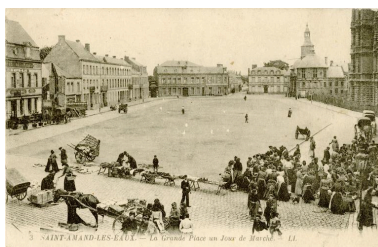
Vue générale de la place, début du 20e siècle, carte postale (Musée municipal Saint-Amand-les-Eaux). IVR31_20135908072NUCA