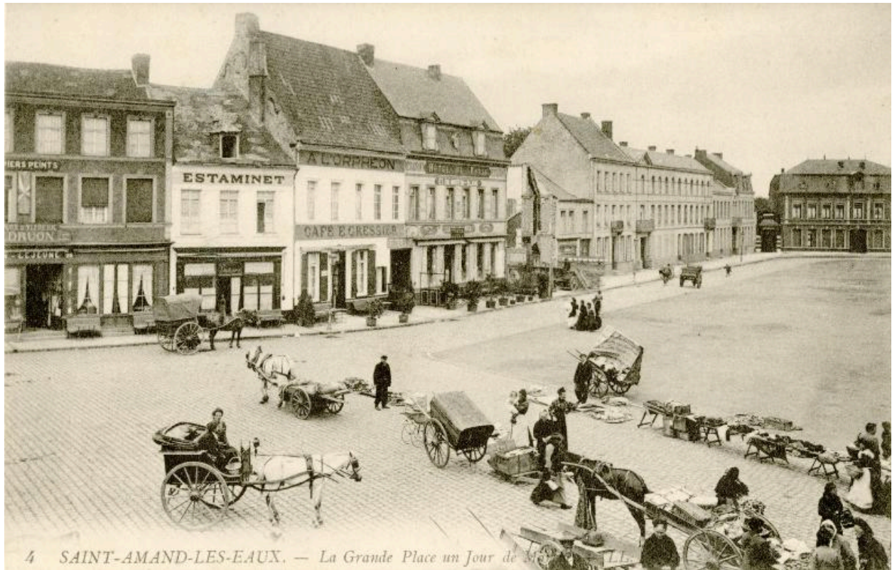
4 SAINT-AMAND-LES-EAUX. — La Grande Place un Jour de M...

Vue générale de la place, côté ouest, début du 20e siècle, carte postale (Musée municipal Saint-Amand-les-Eaux).