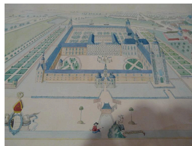
Abbaye de Saint-Amand, planche de Sanderus (1645) (Biblio Royale Bruxelles), copie AD Nord 57 FI 19. IVR31_20135908043NUCA