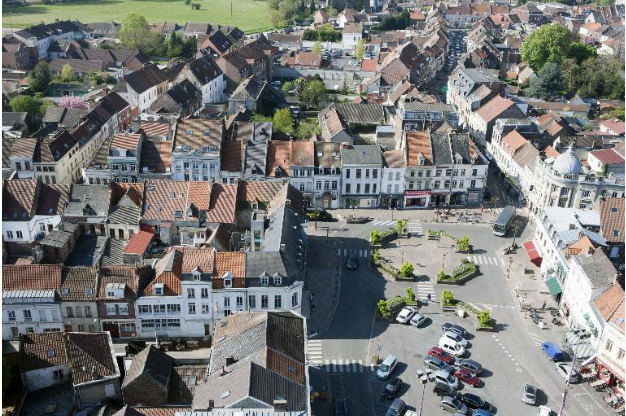
La place et la rue Thiers depuis la tour abbatiale.