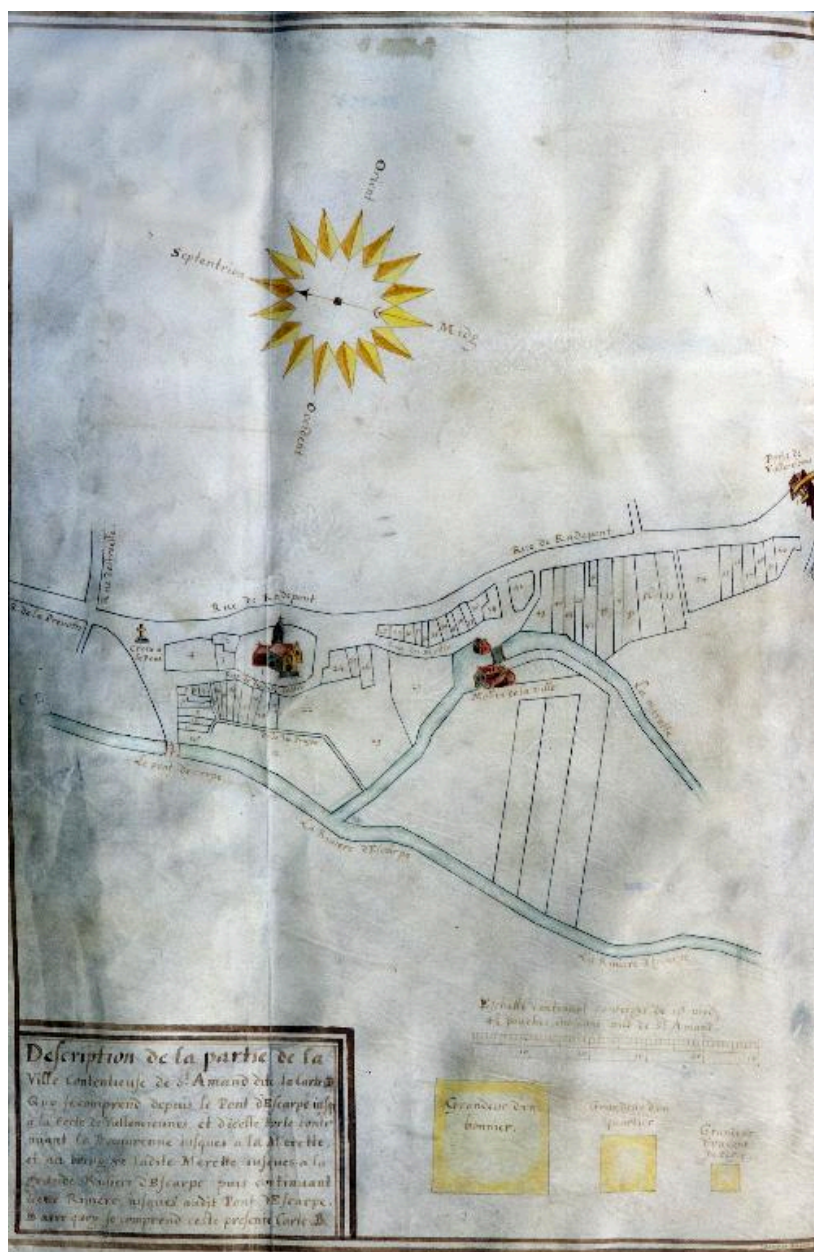
Plan terrier, carte A, la ville intra-muros, 1663 (Médiathèque Saint-Amand-les-Eaux, fonds ancien).