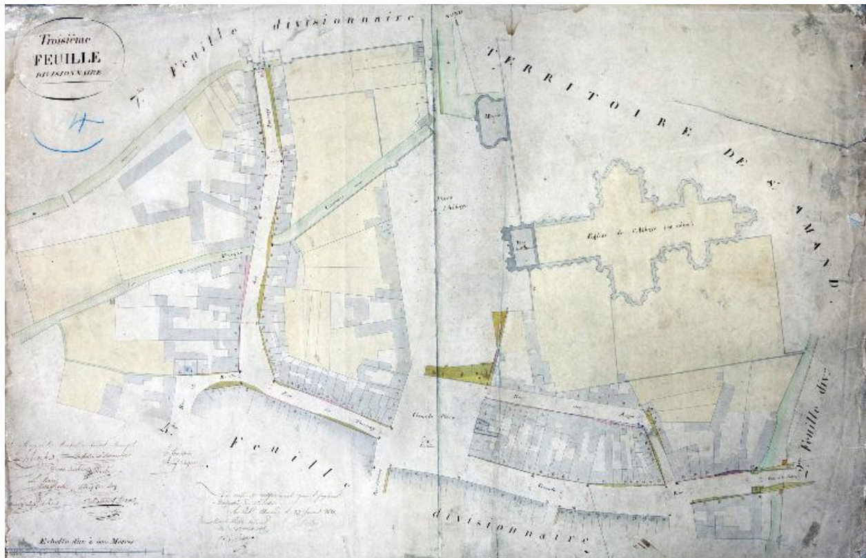
Cadastre de 1821, 3e feuille, le centre.