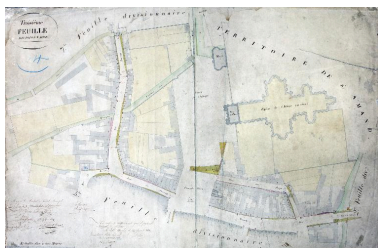
Cadastré de 1821, 3e feuille, le centre (Médiathèque Saint-Amand-les-Eaux, fonds ancien).