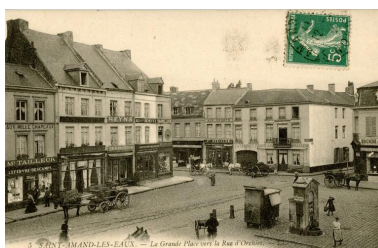
Vue de la place vers le sud, la fontaine, la rue d'Orchies et la rue de Tournai (à droite), carte postale, début du 20e siècle (Musée municipal Saint-Amand-les-Eaux). IVR31_20135908075NUCA