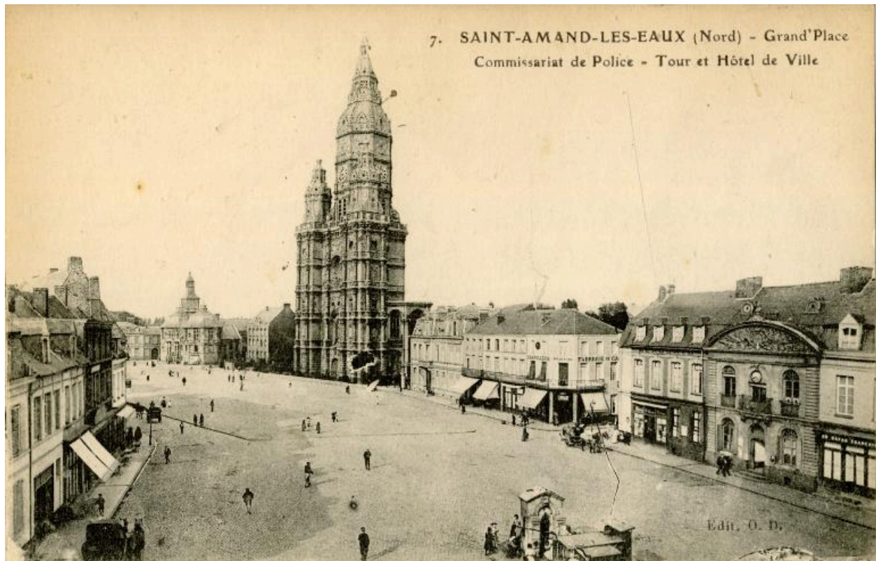
Vue générale de la place, côté est, hôtel de police, tour abbatiale et mairie (ancien échevinage), début du 20e siècle, carte postale.