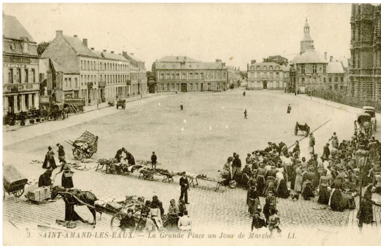
Vue générale de la place, début du 20e siècle, carte postale.