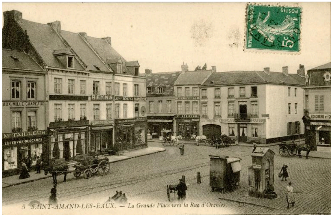
Vue de la place vers le sud, la fontaine, la rue d'Orchies et la rue de Tournai (à droite), carte postale, début du 20e siècle (Musée municipal Saint-Amand-les-Eaux).