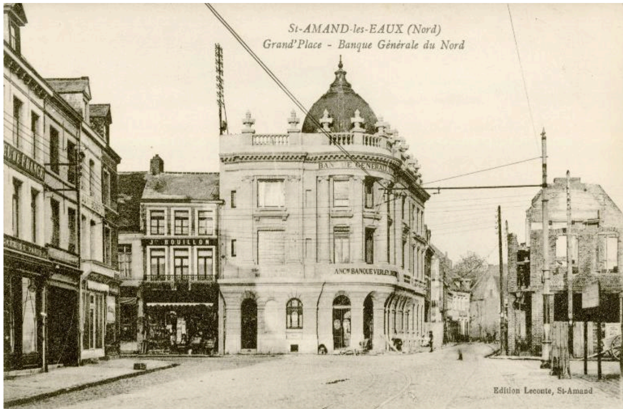
Vue de la place vers l'ouest et la rue de Tournai, le nouvel immeuble (reconstruction après la Première guerre) abritant la banque générale, carte postale, vers 1920 (Musée municipal Saint-Amand-les-Eaux).