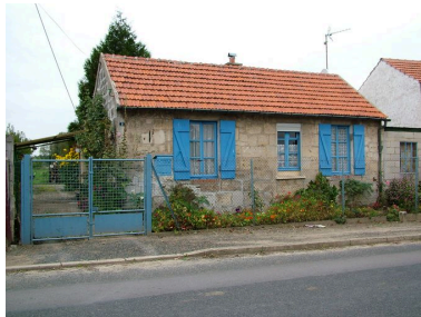
Vue générale d'une maison type.