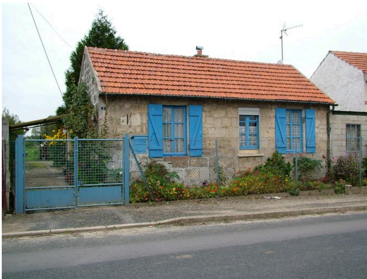
Vue générale d'une maison type.