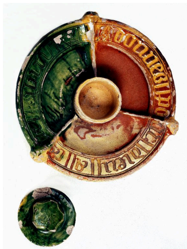
Vue d'ensemble. IVR22_19966001611XA