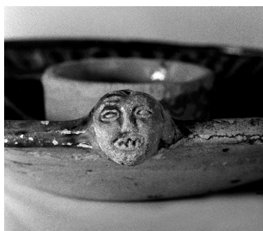
Détail d'une autre figure sur le côté du plat.