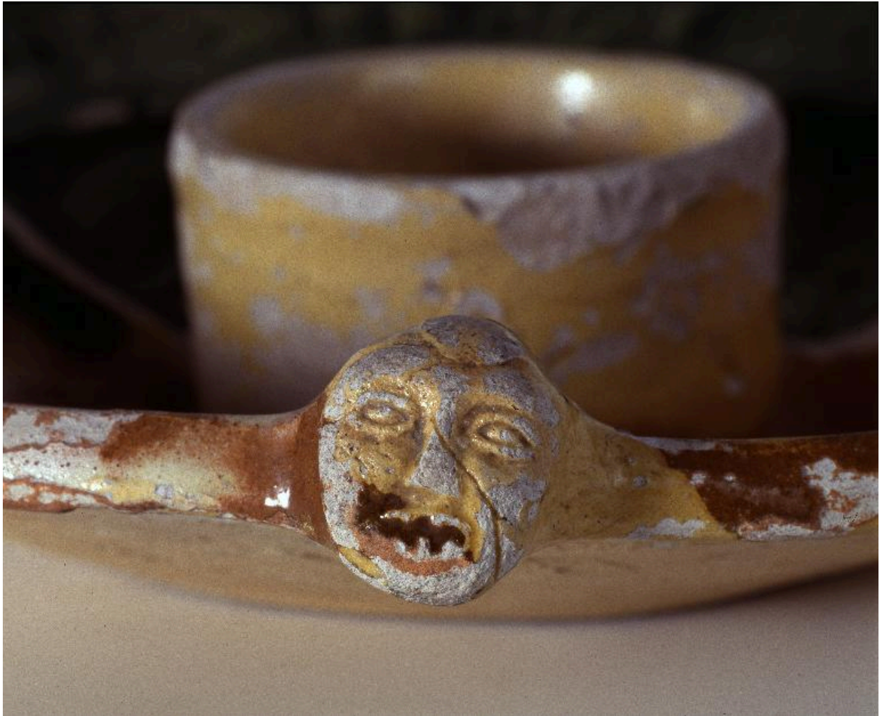
Détail d'une des petites têtes sur les côtés du plat.