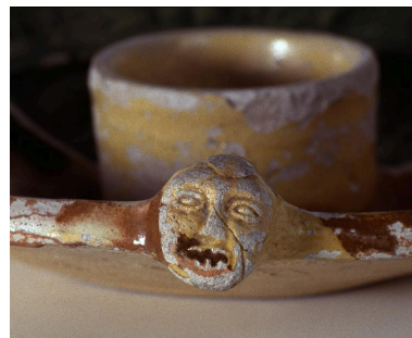
Détail d'une des petites têtes sur les côtés du plat.