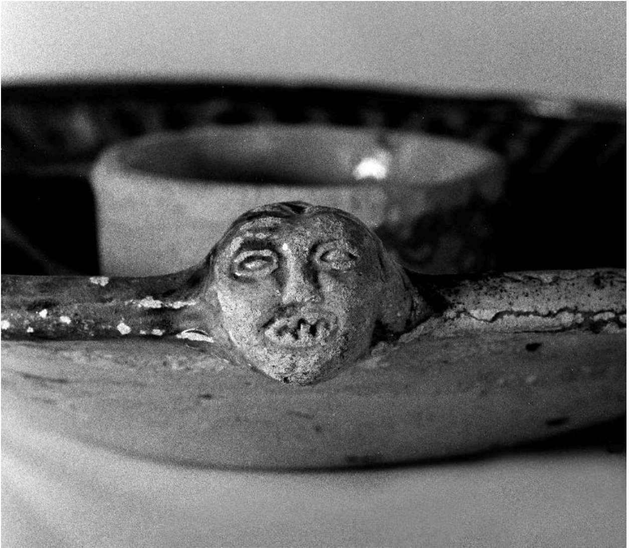
Détail d'une autre figure sur le côté du plat.