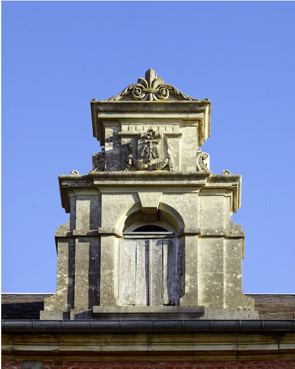
Détail de la lucarne de l'élévation sud de la demeure, date portée 1792-1880.