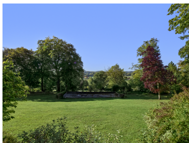
Vue du parc, depuis le parvis de la demeure.