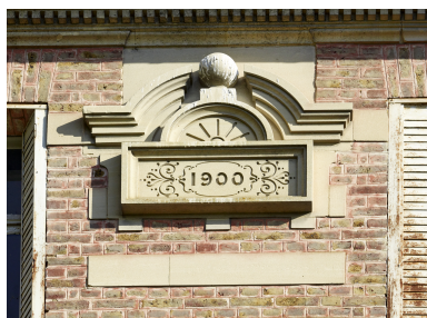
Date portée sur l'extension de la demeure, 1900.