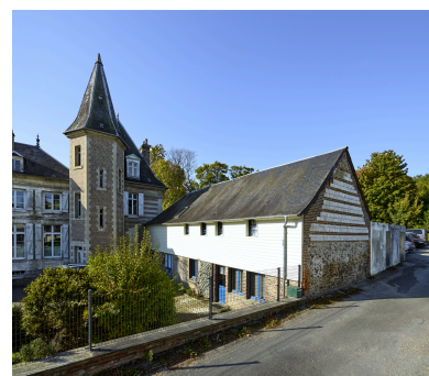
Vue d'une des dépendances, depuis la route.