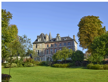
Vue de la demeure, depuis le parc.