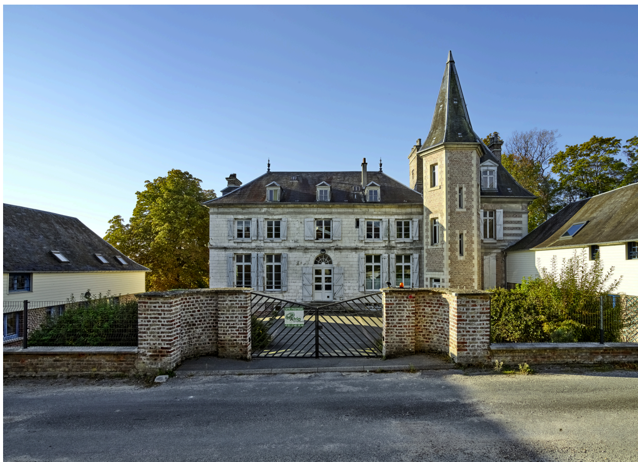
Vue nord de la demeure, depuis la route.