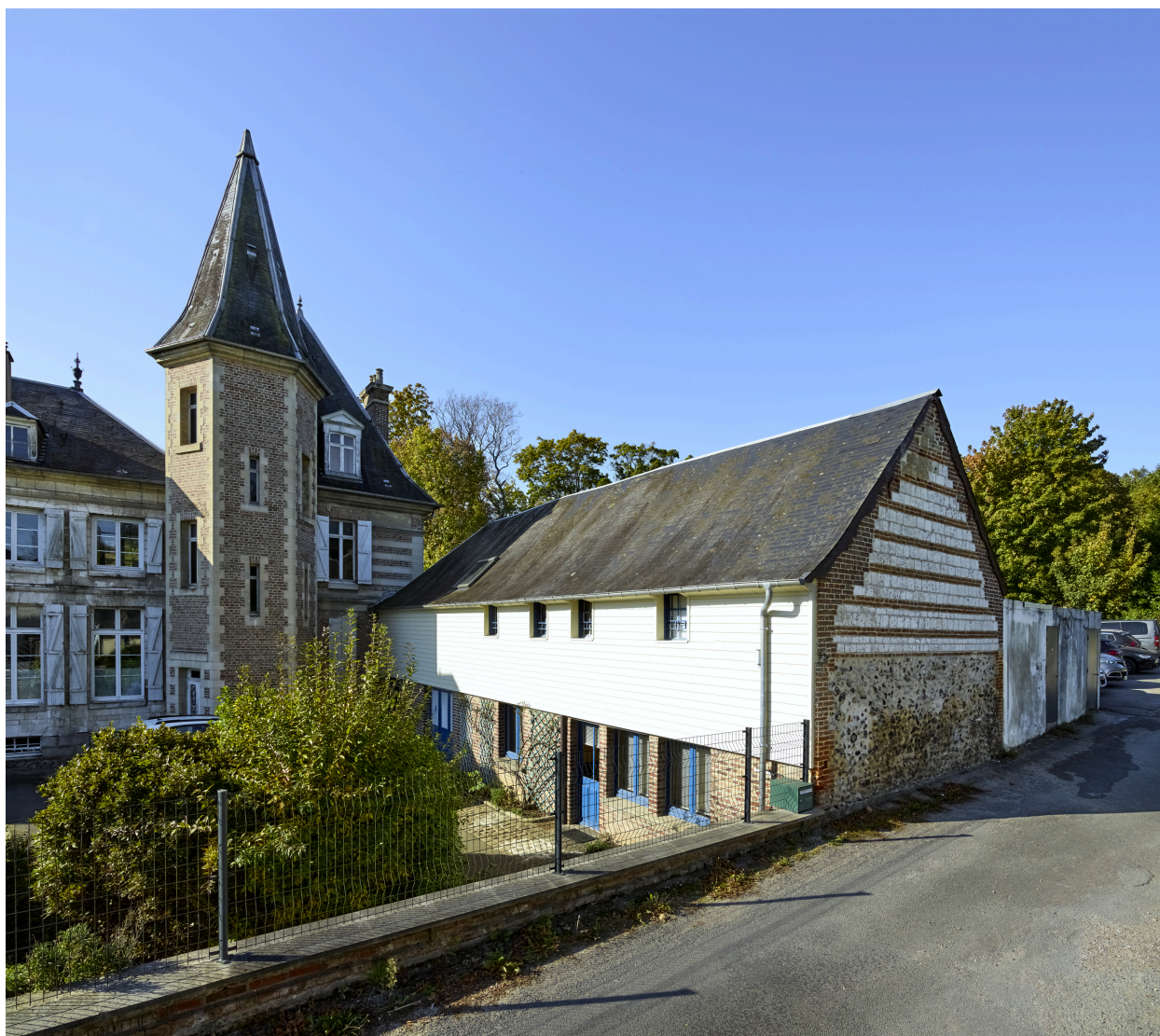
Vue d'une des dépendances, depuis la route.