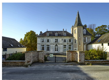
Vue nord de la demeure, depuis la route. IVR32_20258001433NUCA