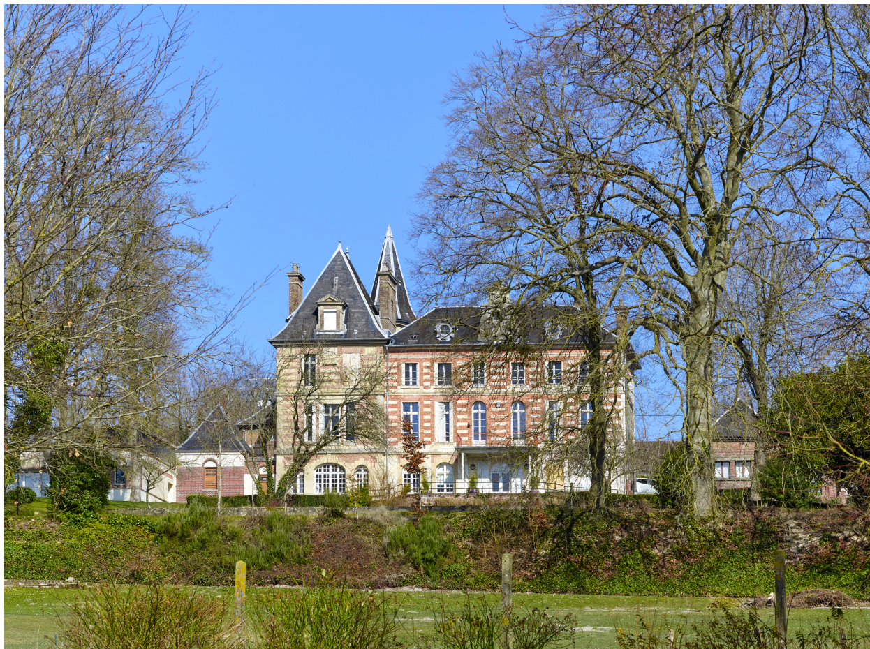
Vue sud de la demeure, depuis le parc.