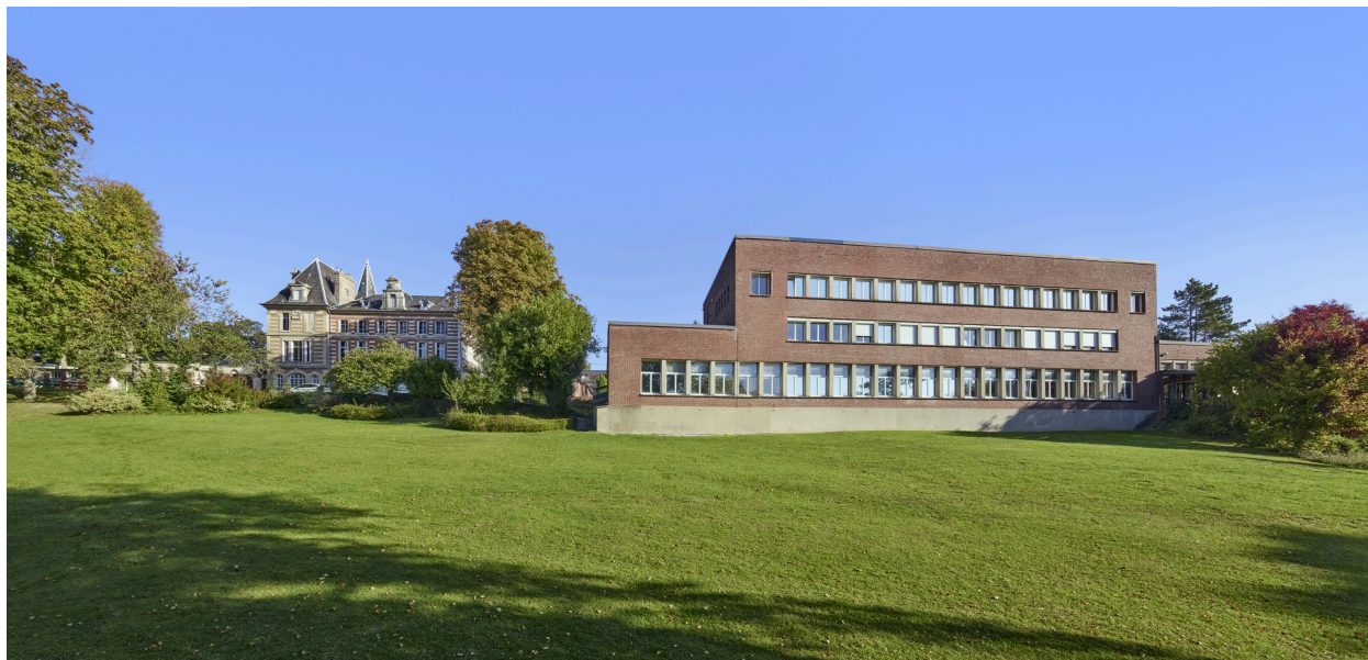
Vue d'ensemble de l'IME, depuis le parc.