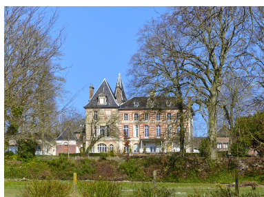
Vue sud de la demeure, depuis le parc.