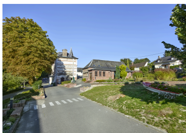
Vue de l'entrée de l'IME, depuis l'est.