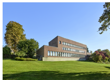
Vue de l'internat, depuis le parc. IVR32_20258001442NUCA