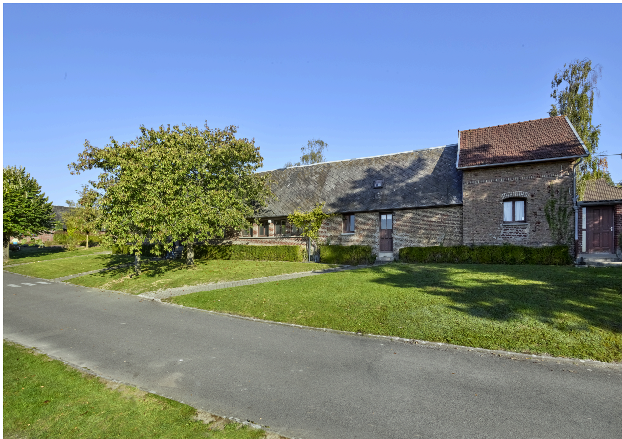
Vue d'une des dépendances, depuis le sud.