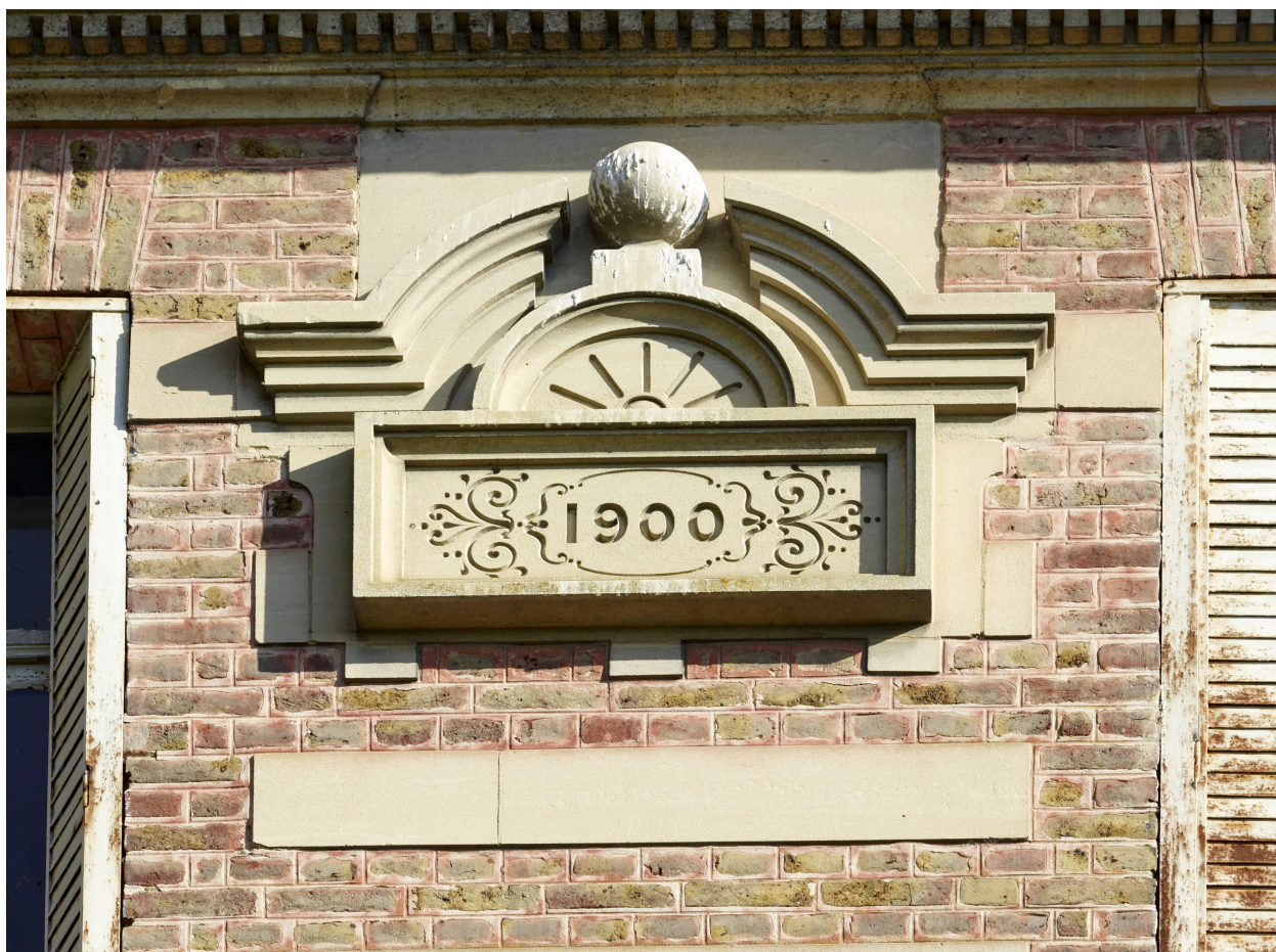
Date portée sur l'extension de la demeure, 1900.