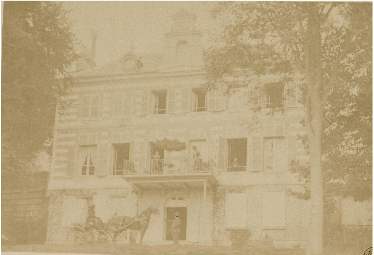
Habitation de M. Henri Devismes de Flacourt à Laviers, photographie noir et blanc, par Maurice de Féraudy, 1884 (Archives et Bibliothèque patrimoniale d'Abbeville ; Ab. N63).