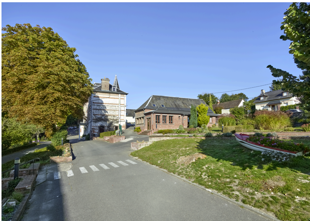
Vue de l'entrée de l'IME, depuis l'est.