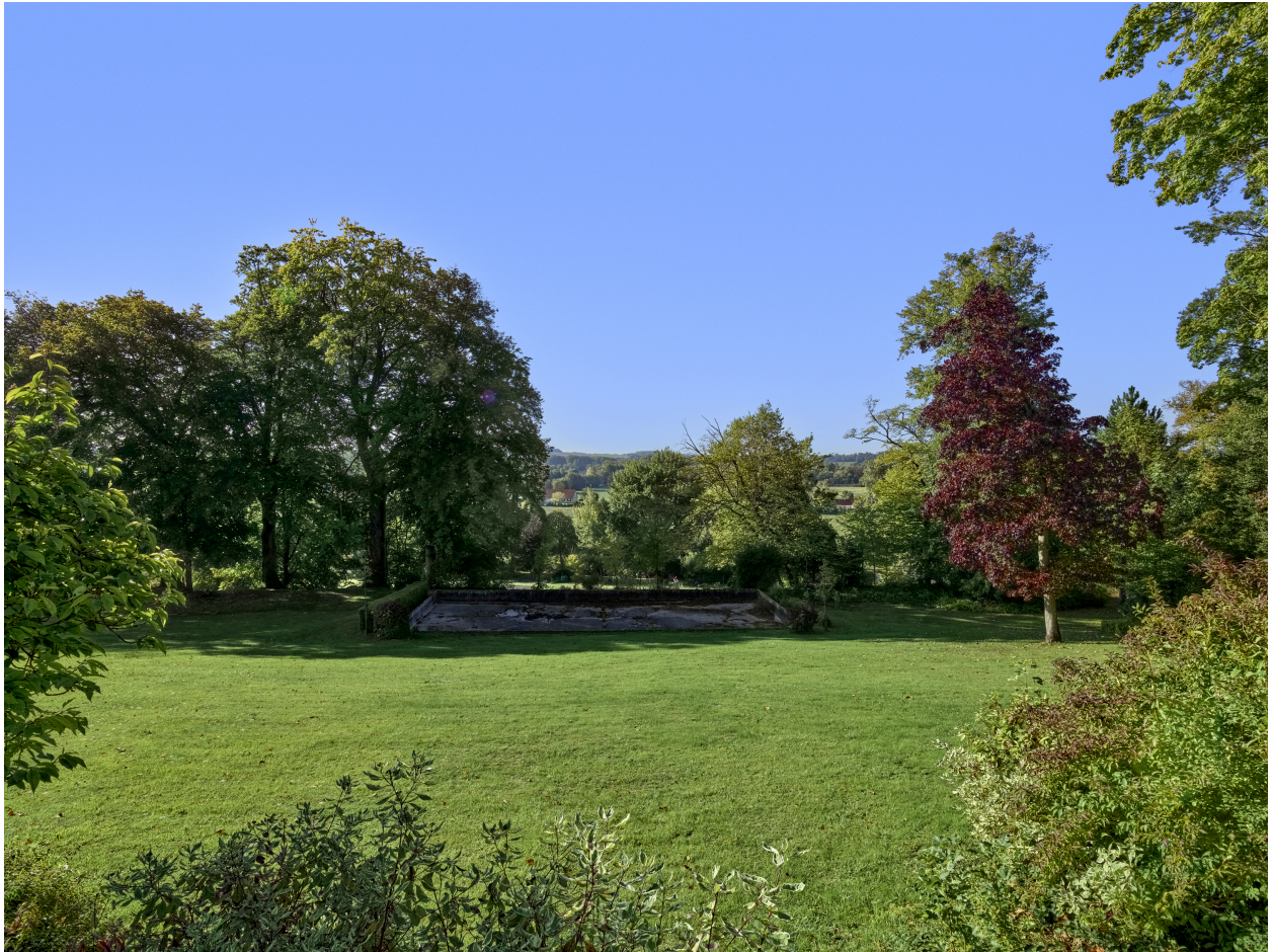
Vue du parc, depuis le parvis de la demeure.