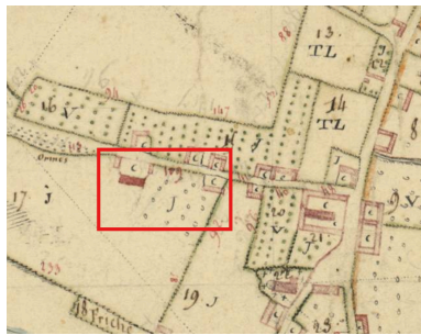
Emplacement de la demeure Tronnet, plan par masses de cultures, 1804 (AD Somme ; 3 P 1010).