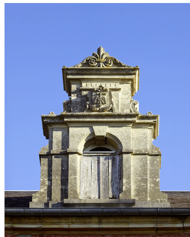
Détail de la lucarne de l'élévation sud de la demeure, date portée 1792-1880. IVR32_20258011085NUCA