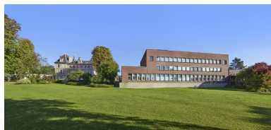
Vue d'ensemble de l'IME, depuis le parc. IVR32_20258001436NUCA