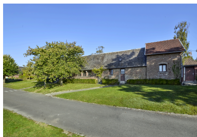
Vue d'une des dépendances, depuis le sud. IVR32_20258001447NUCA