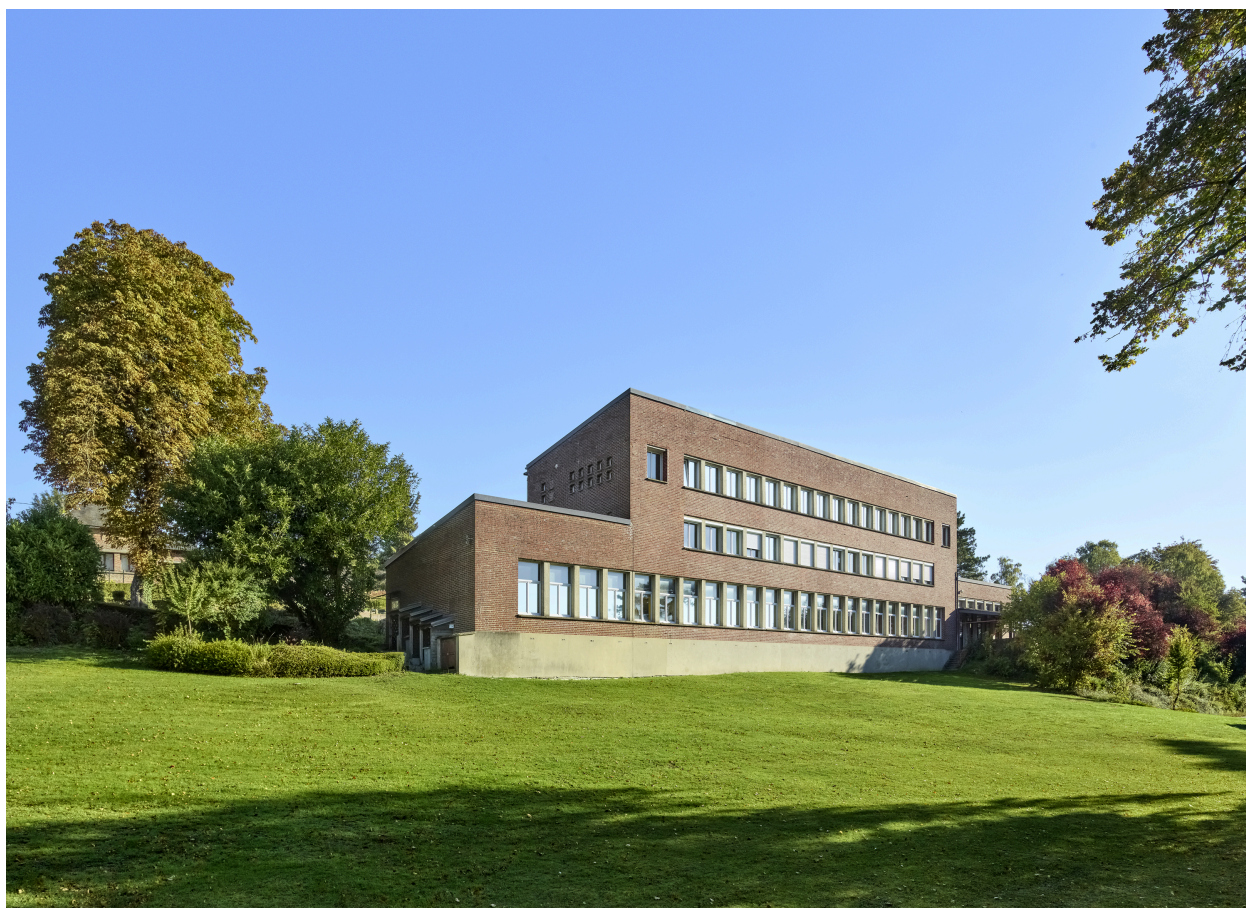
Vue de l'internat, depuis le parc.