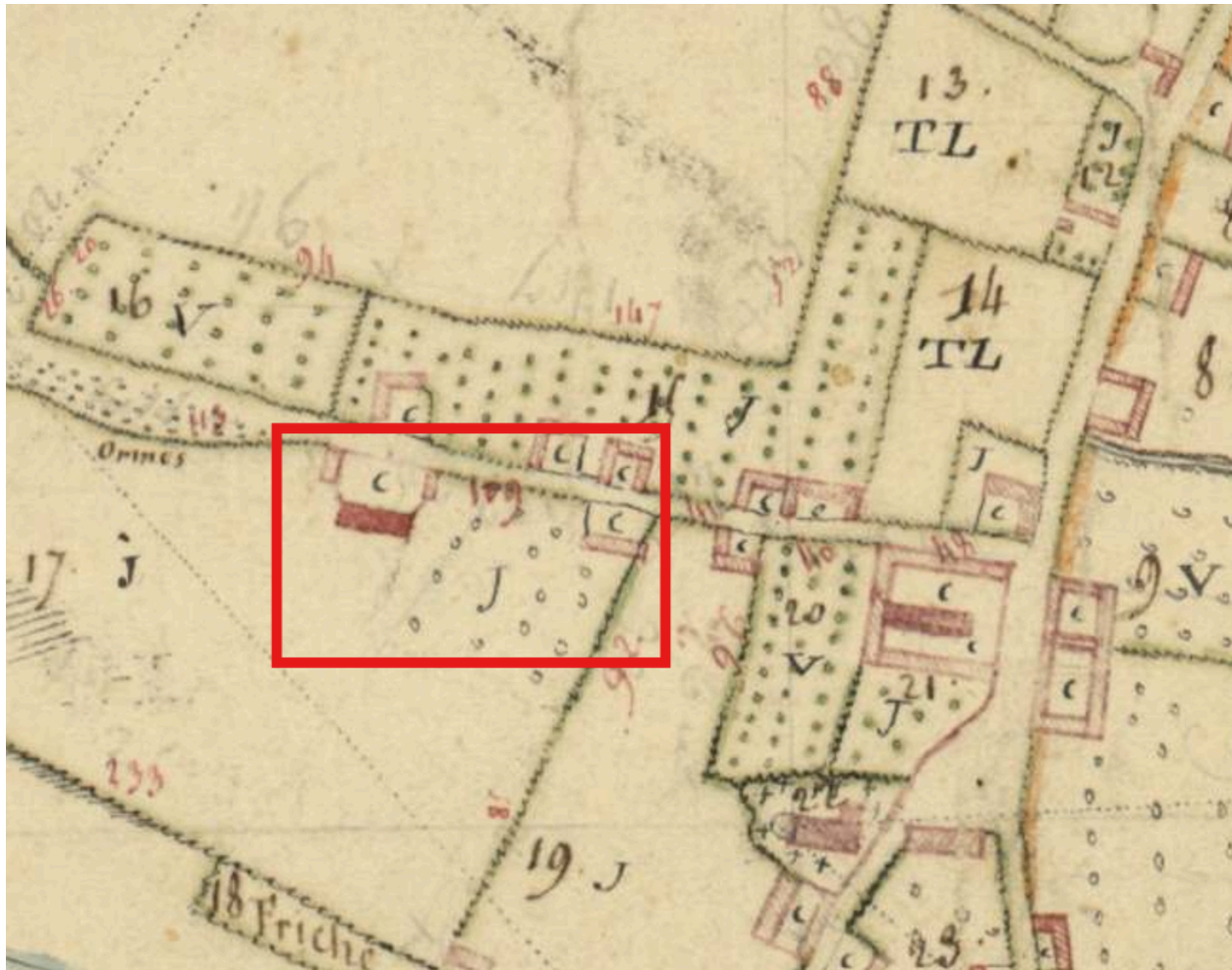
Emplacement de la demeure Tronnet, plan par masses de cultures, 1804 (AD Somme ; 3 P 1010).