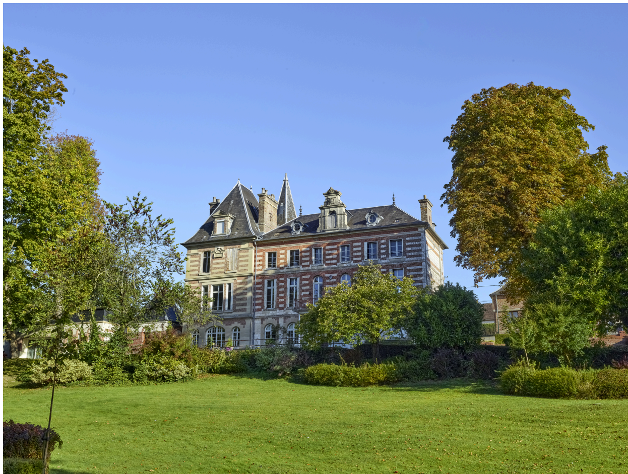
Vue de la demeure, depuis le parc.