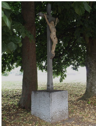
Vue générale. IVR31_20106204026NUCA