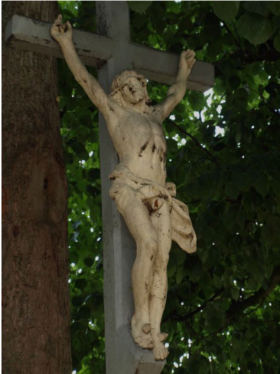
Vue du Christ en croix.