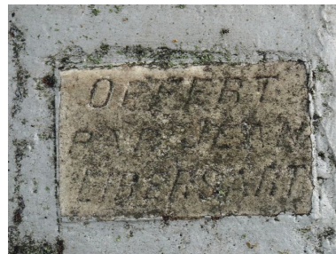
Vue de la plaque avec inscription. IVR31_20106204039NUCA