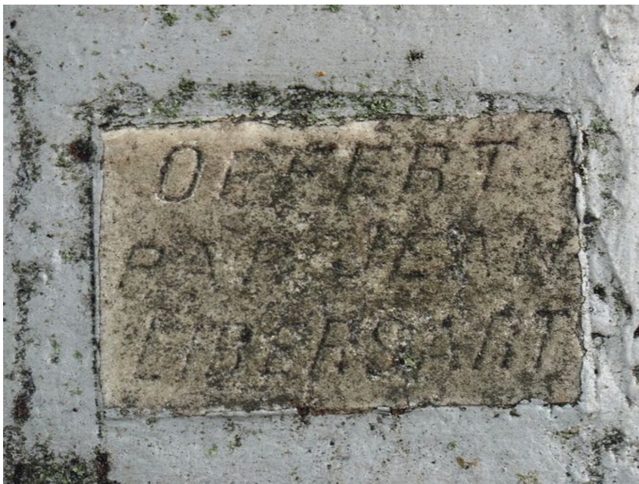
Vue de la plaque avec inscription.