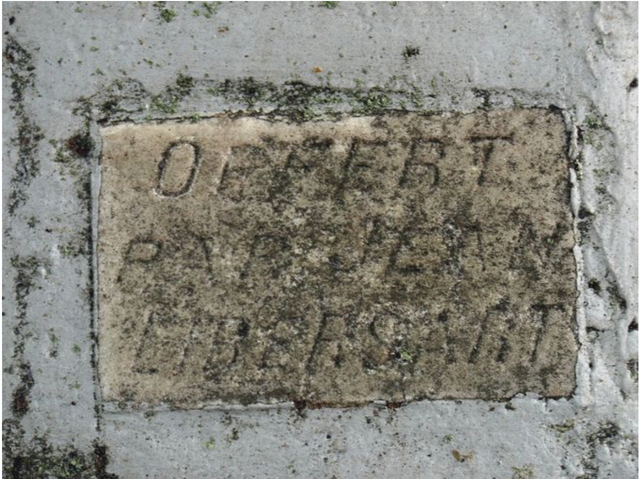
Vue de la plaque avec inscription.