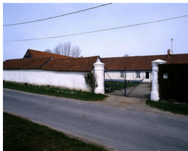
Vue d'un des deux piliers d'entrée et des étables à cochons sur rue.