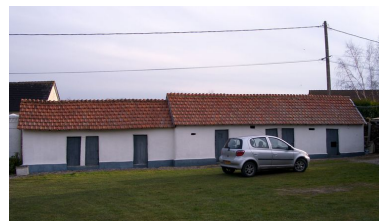
Vue des étables à cochons depuis la cour. IVR22_20058005090NUCA