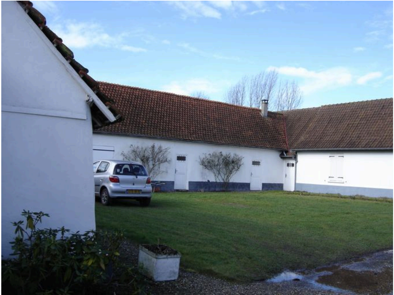
Vue des écuries situées en retour d'équerre du logis.