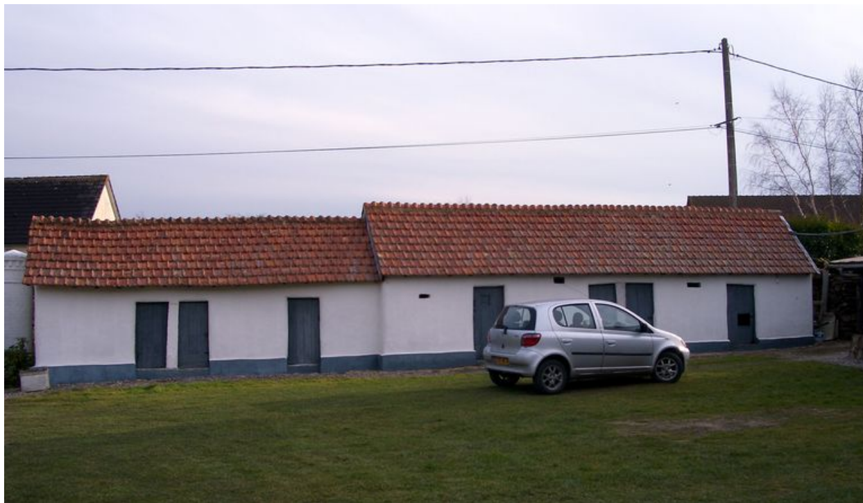
Vue des étables à cochons depuis la cour.