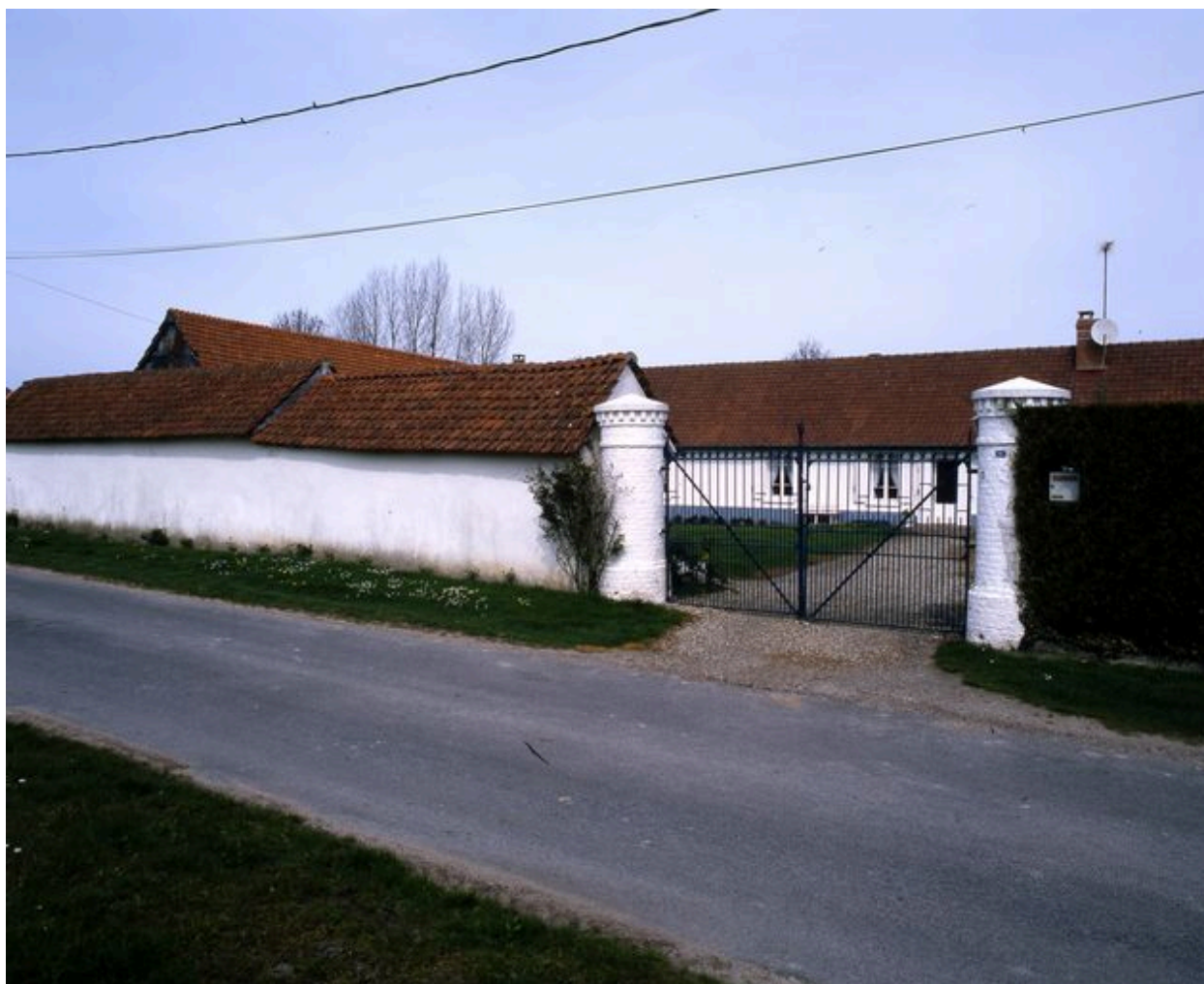
Vue d'un des deux piliers d'entrée et des étables à cochons sur rue.