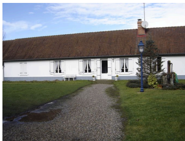
Vue du logis en fond de cour. IVR22_20058005088NUCA