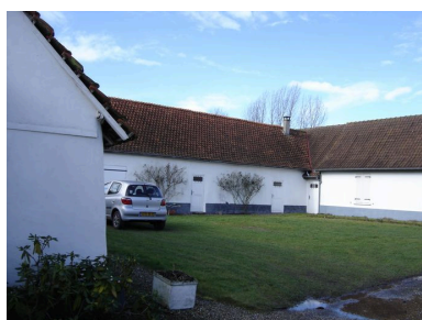
Vue des écuries situées en retour d'équerre du logis.