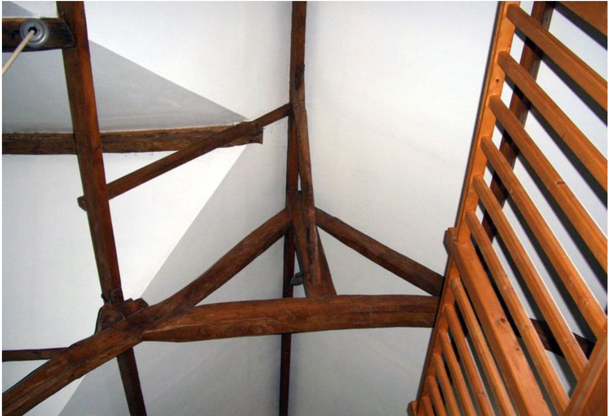
Vue de la charpente de l'ancienne grange.