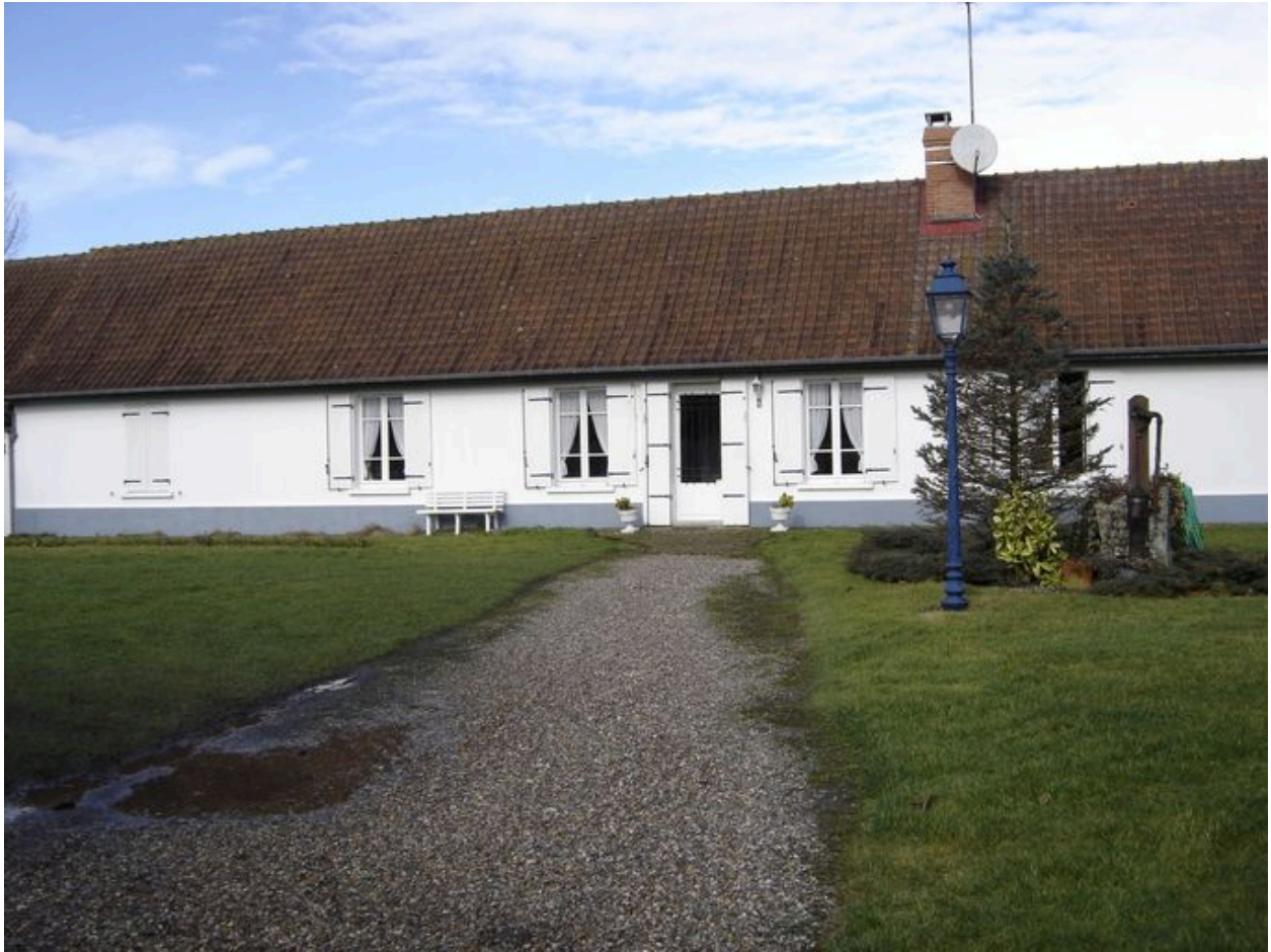
Vue du logis en fond de cour.