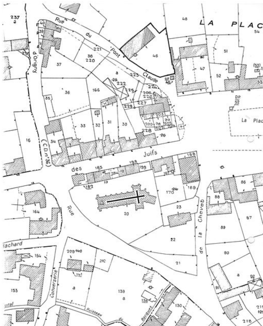
Plan de situation. Extrait du plan cadastral de 1991, section AB.