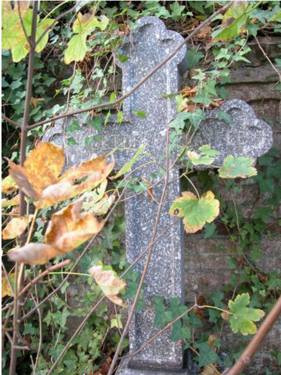
Détail de la croix.