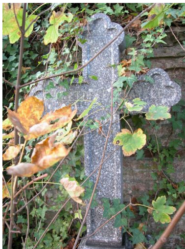
Détail de la croix. IVR22_20048001177NUCA