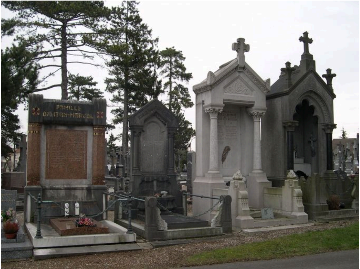
Vue de situation, tombeau à gauche de l'image.