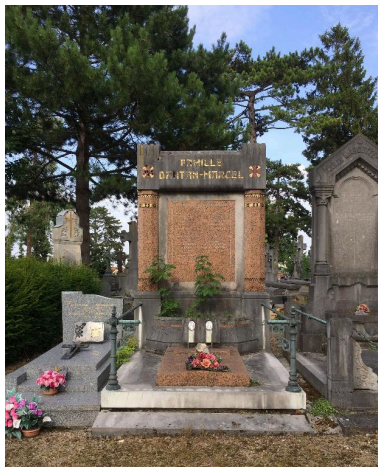
Vue générale. IVR32_20178005150NUCA