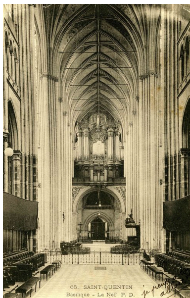
Carte postale montrant la nef et l'orgue, vus depuis le chœur, vers 1900. IVR22_20110201068NUCA