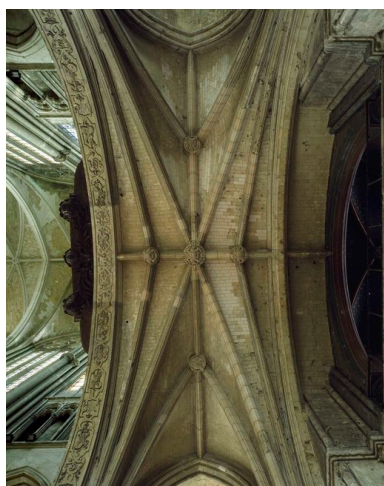
Vue de la voûte de la tribune.