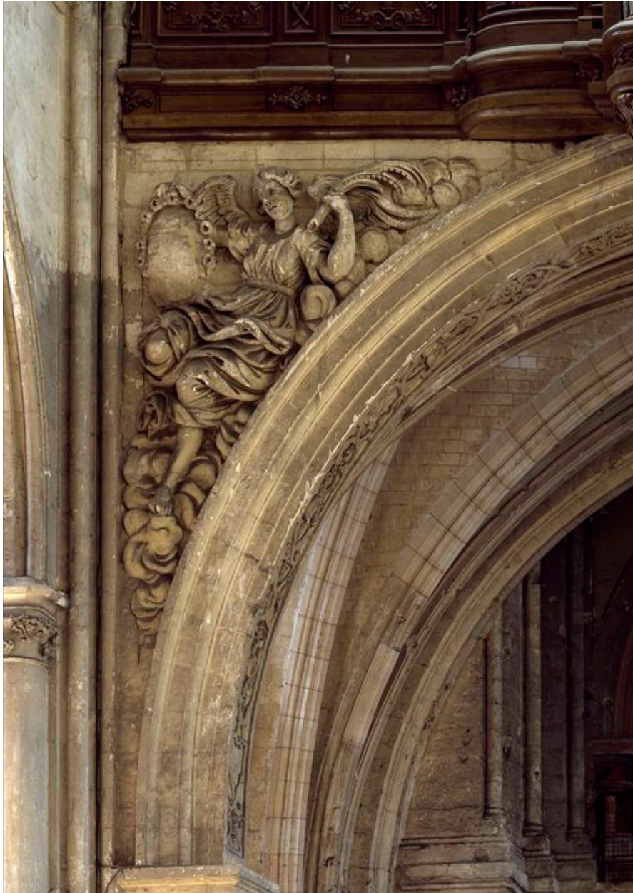
Détail du décor de la tribune