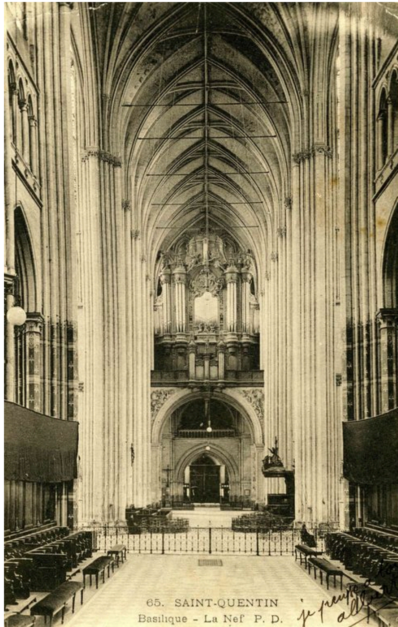
Carte postale montrant la nef et l'orgue, vus depuis le choeur, vers 1900.