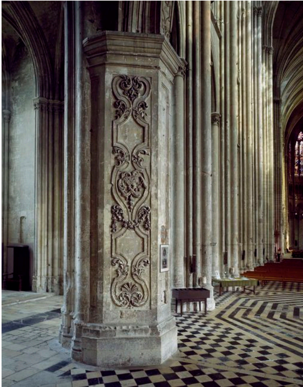
Vue d'un pilier de la tribune.