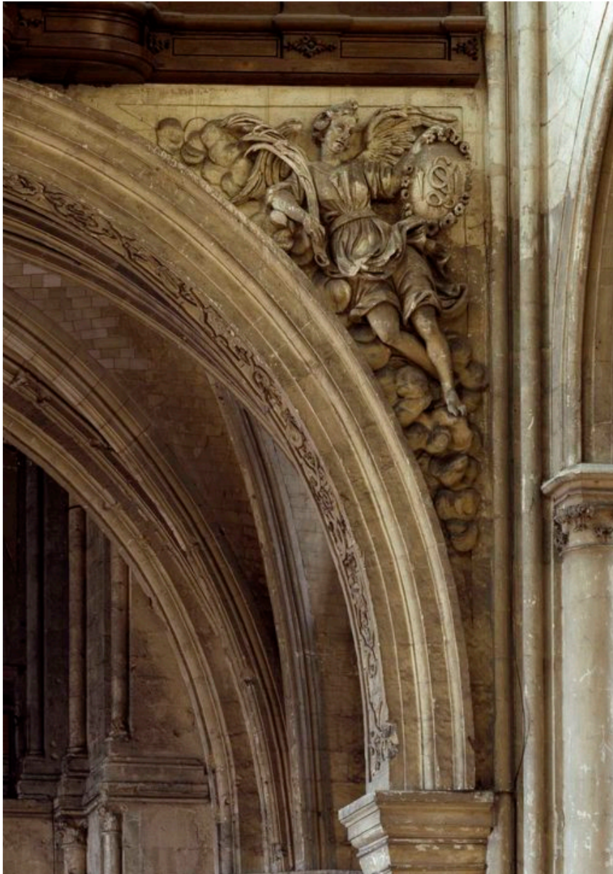
Détail du décor de la tribune.