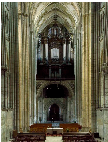
Vue générale de l'orgue et de sa tribune. IVR22_20110201067NUCA