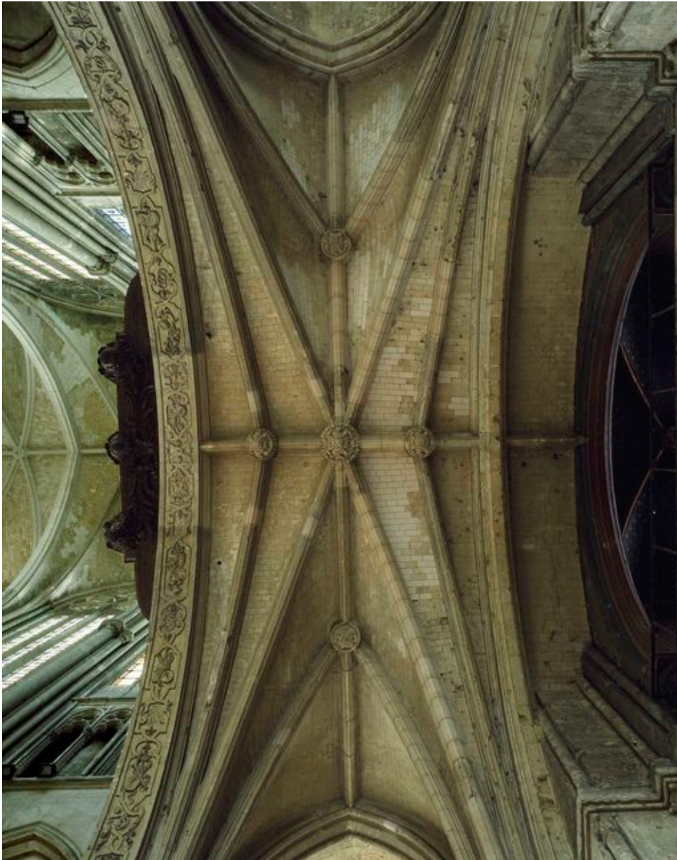
Vue de la voûte de la tribune.