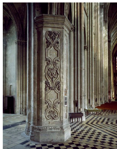
Vue d'un pilier de la tribune.