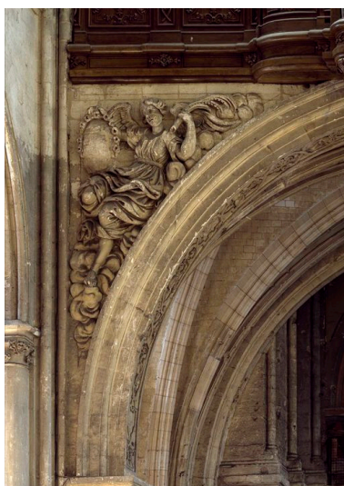
Détail du décor de la tribune IVR22_20100200139XA