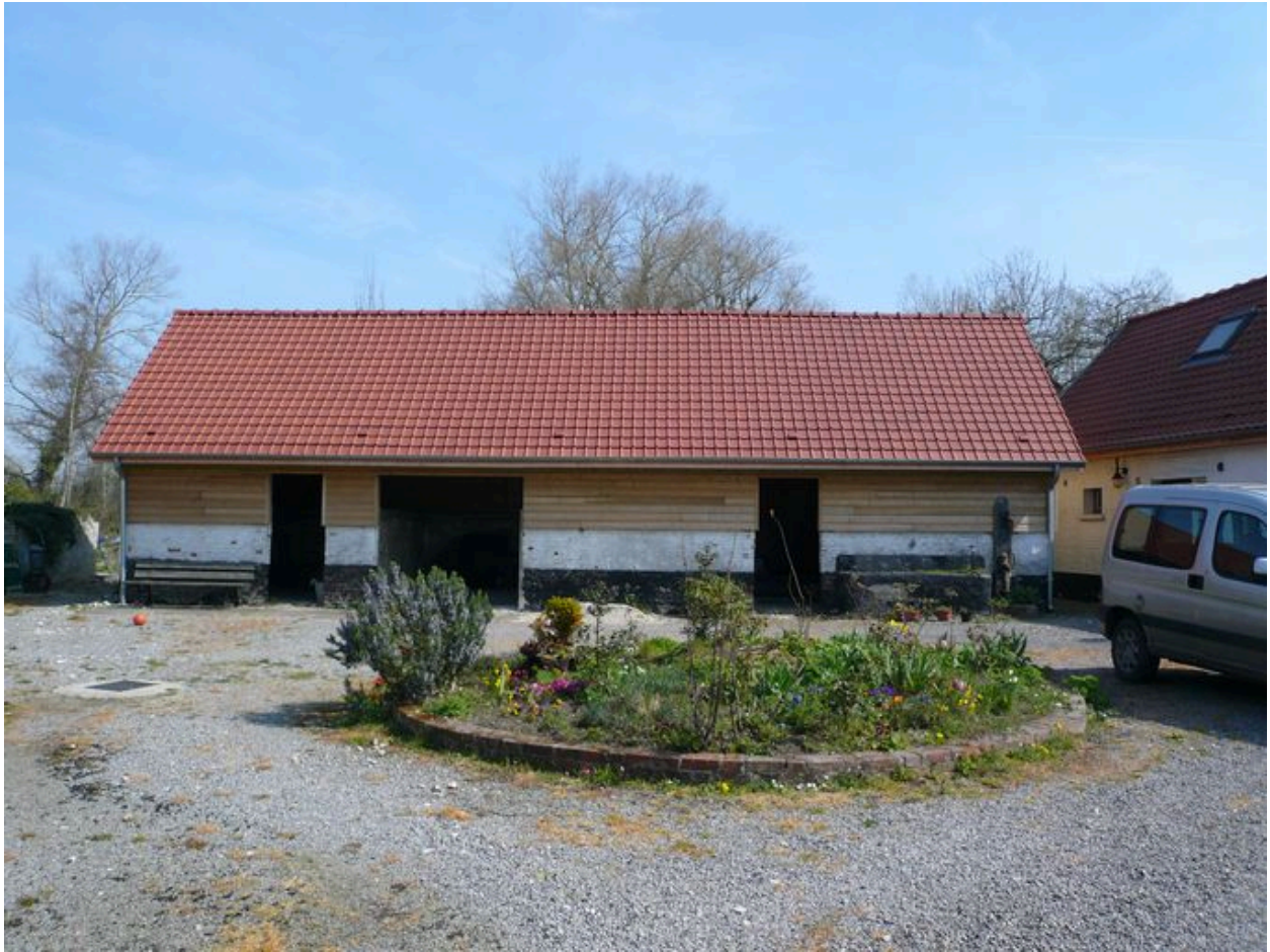
Vue des étables en fond de cour.