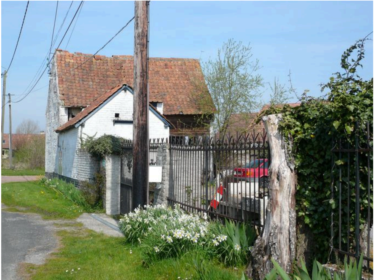
Vue du grenier, du pigeonier et des porcheries sur rue.