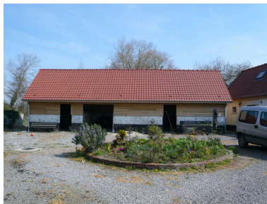
Vue des étables en fond de cour.