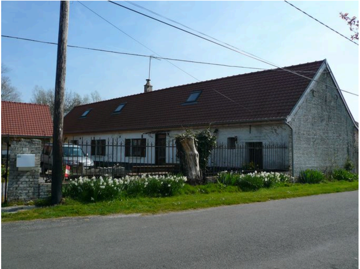
Vue du logis.