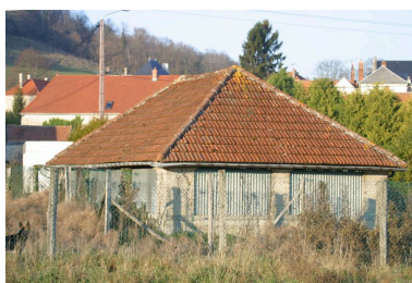
Vue du lavoir.