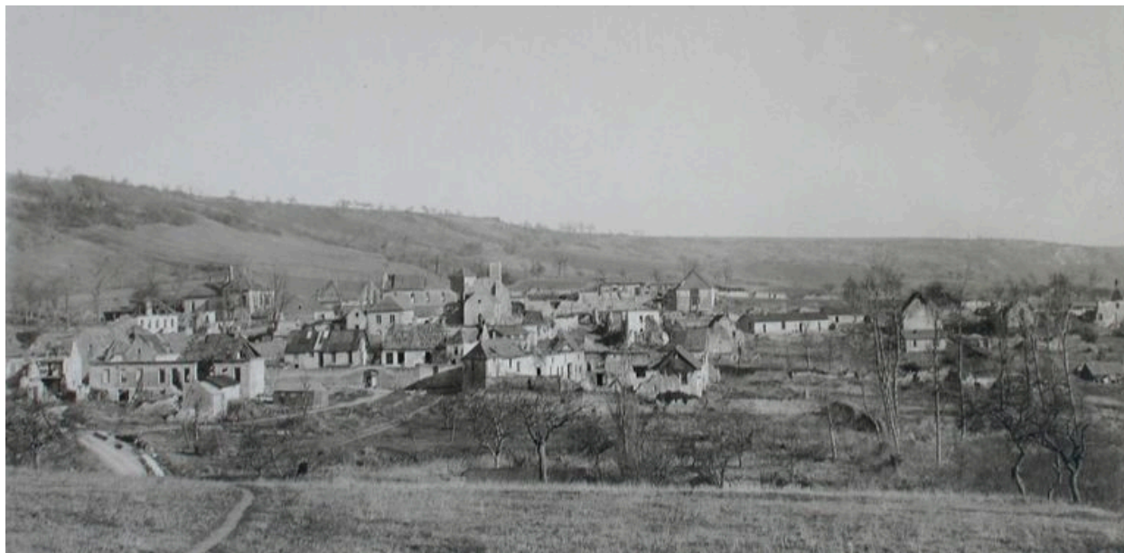
Panorama ancien du village (AD Aisne : 2 Fi Jumigny 1).