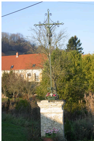
Croix de chemin à l'entrée du village.