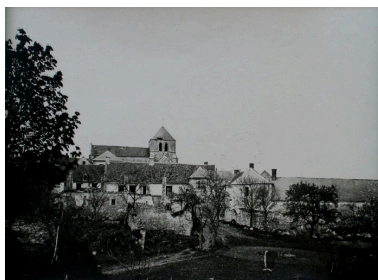
Vue du village pendant les conflits (AD Aisne : 2 Fi Jumigny 2).