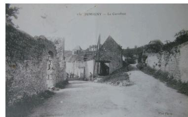
Vue d'une rue du village pendant les conflits (coll. part).