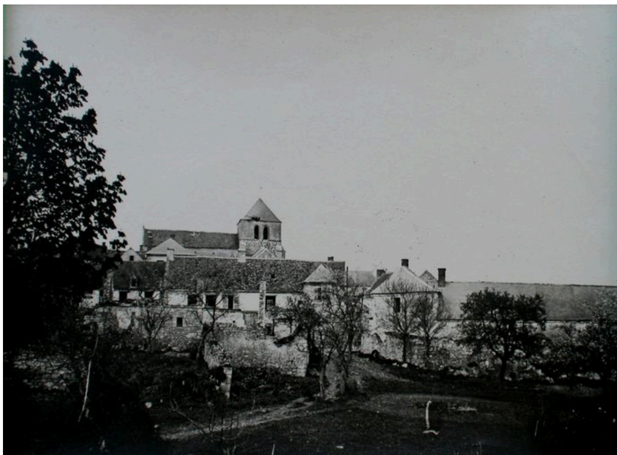
Vue du village pendant les conflits.