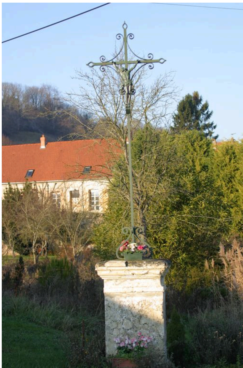
Croix de chemin à l'entrée du village.