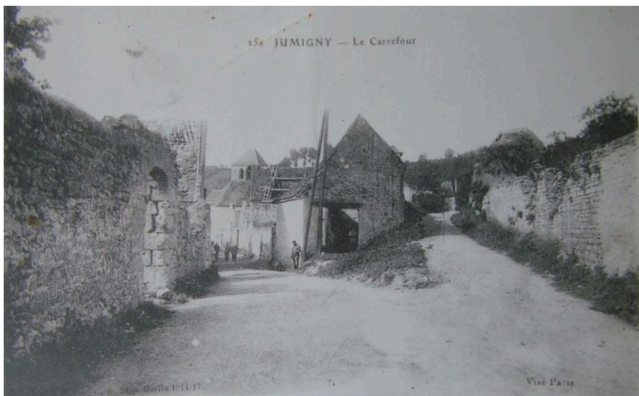
Vue d'une rue du village pendant les conflits (coll. part).