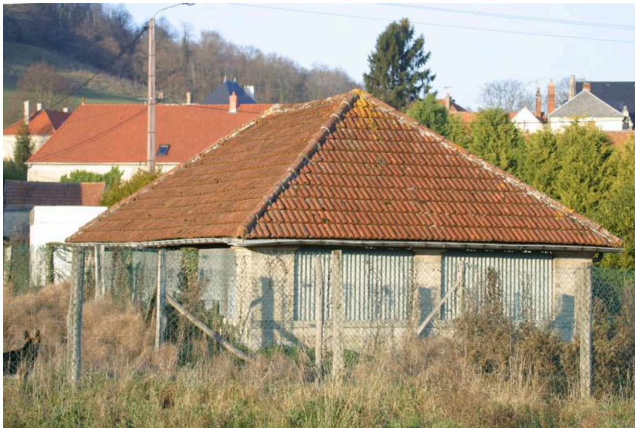
Vue du lavoir.