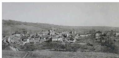
Panorama ancien du village (AD Aisne : 2 Fi Jumigny 1).