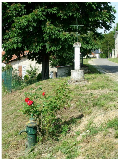
Vue d'une croix de chemin.