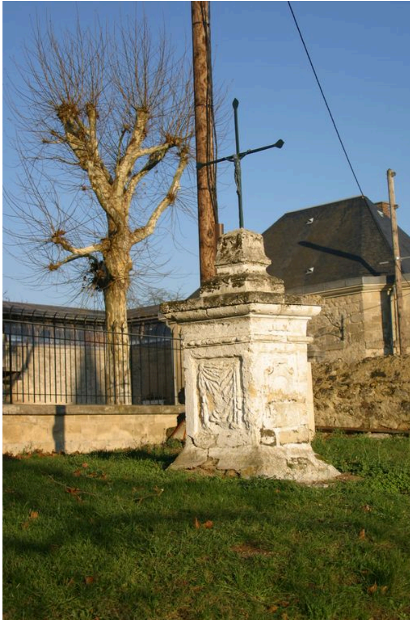
Vue de la croix de chemin placée devant le château.