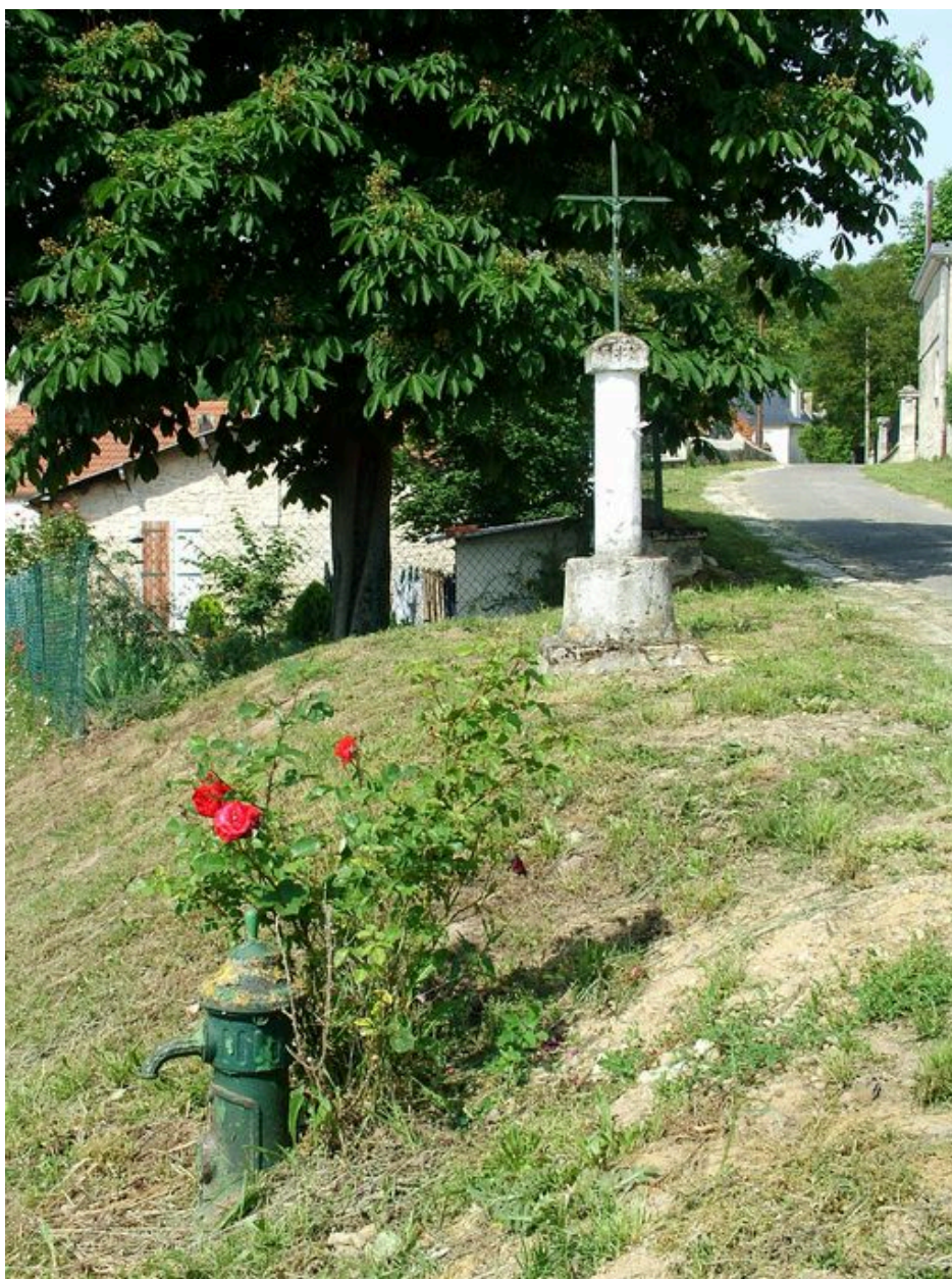
Vue d'une croix de chemin.