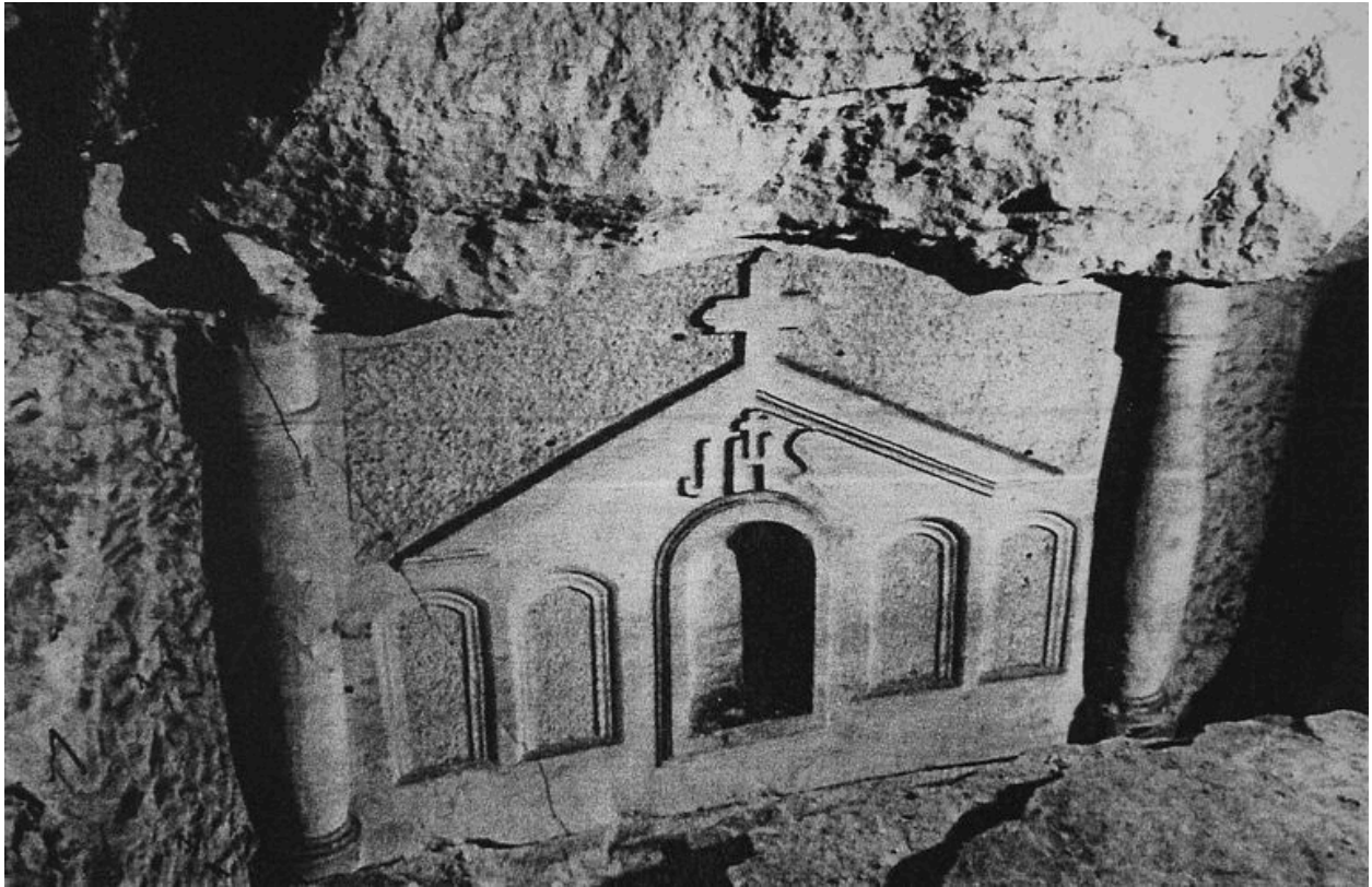
Vue d'un autel chrétien aujourd'hui disparu (DRAC Picardie, M. H.).