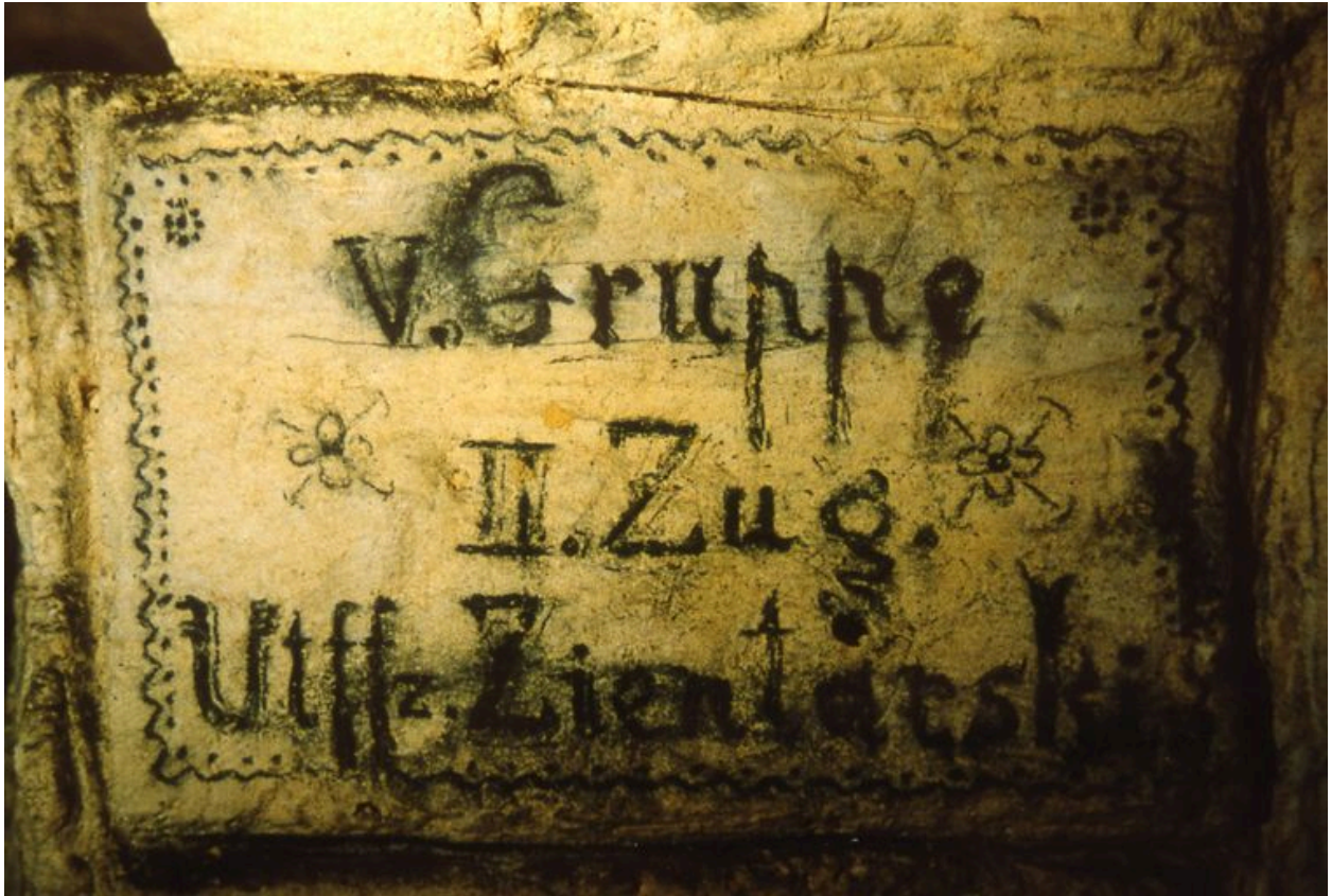
Vue d'une inscription allemande.