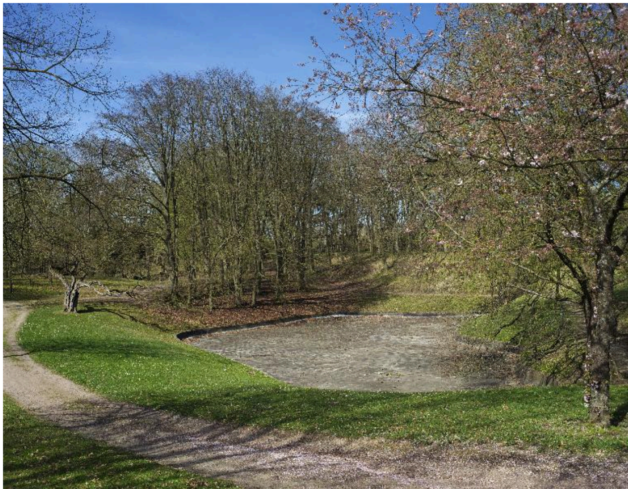
Le lac artificiel.