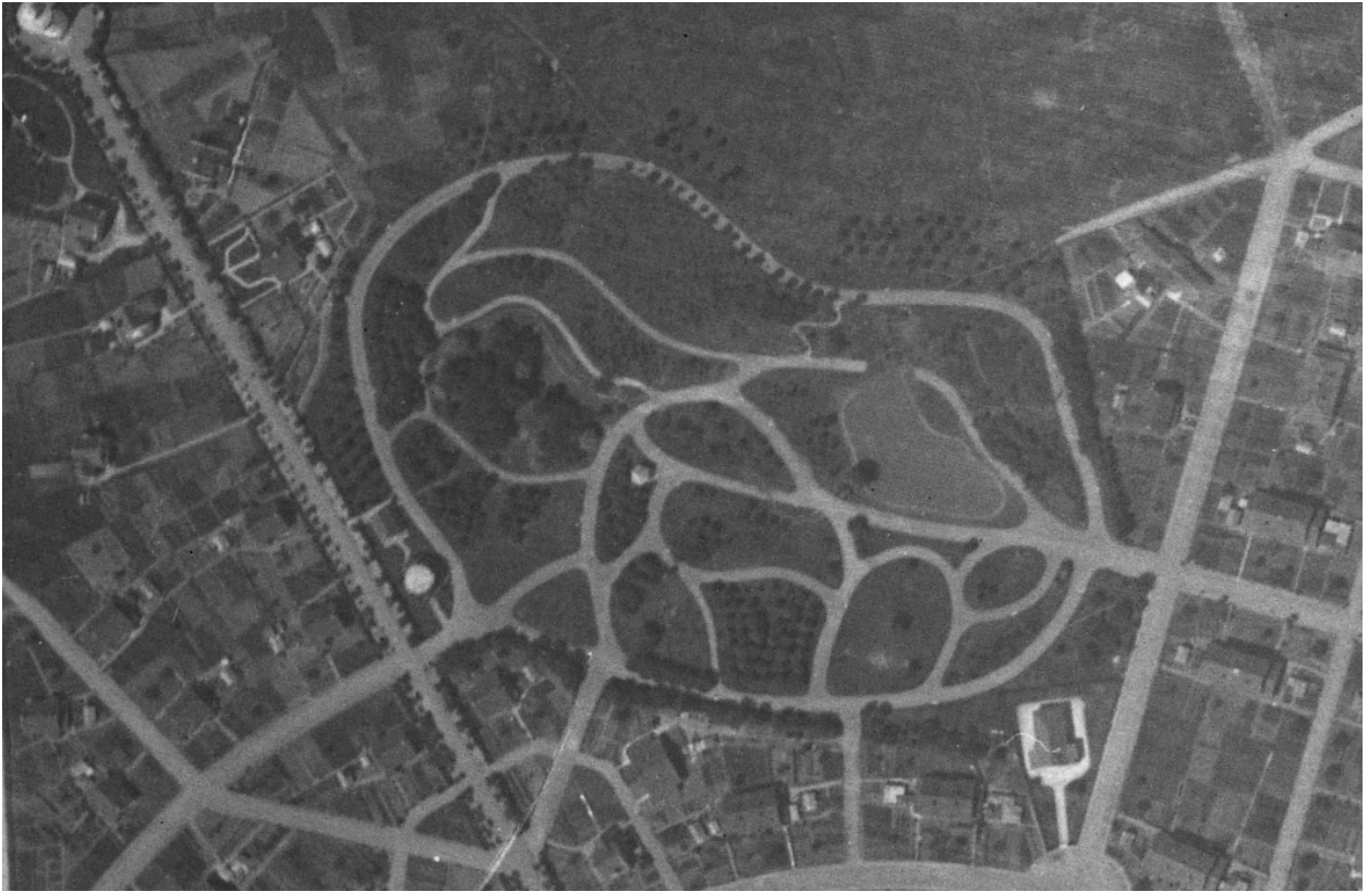
Parc des Buttes-Chaumont. Vue aérienne, 26 juin 1931 (IGN ; C94PHQ4451_1931_NP3_HR50_0007).