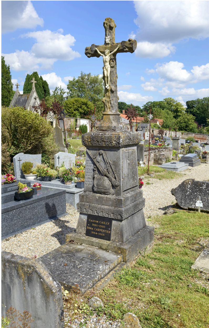
Tombe ornée d'une gibecière et d'un fusil.