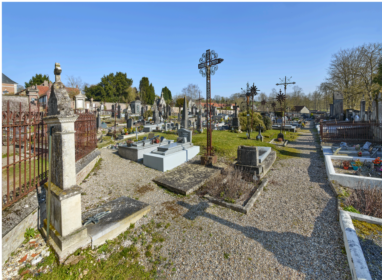
Vue d'ensemble du cimetière, depuis le sud-ouest.