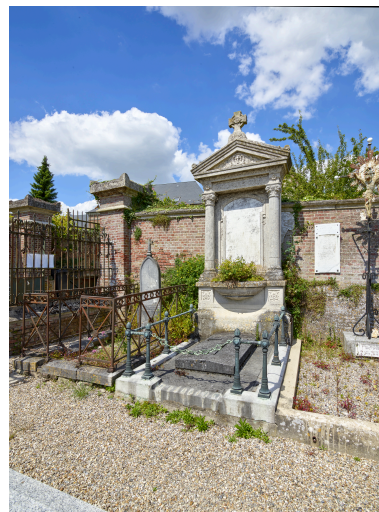
Tombe de la famille Poulet- Cossart, au nord du cimetière. IVR32_20258000453NUCA