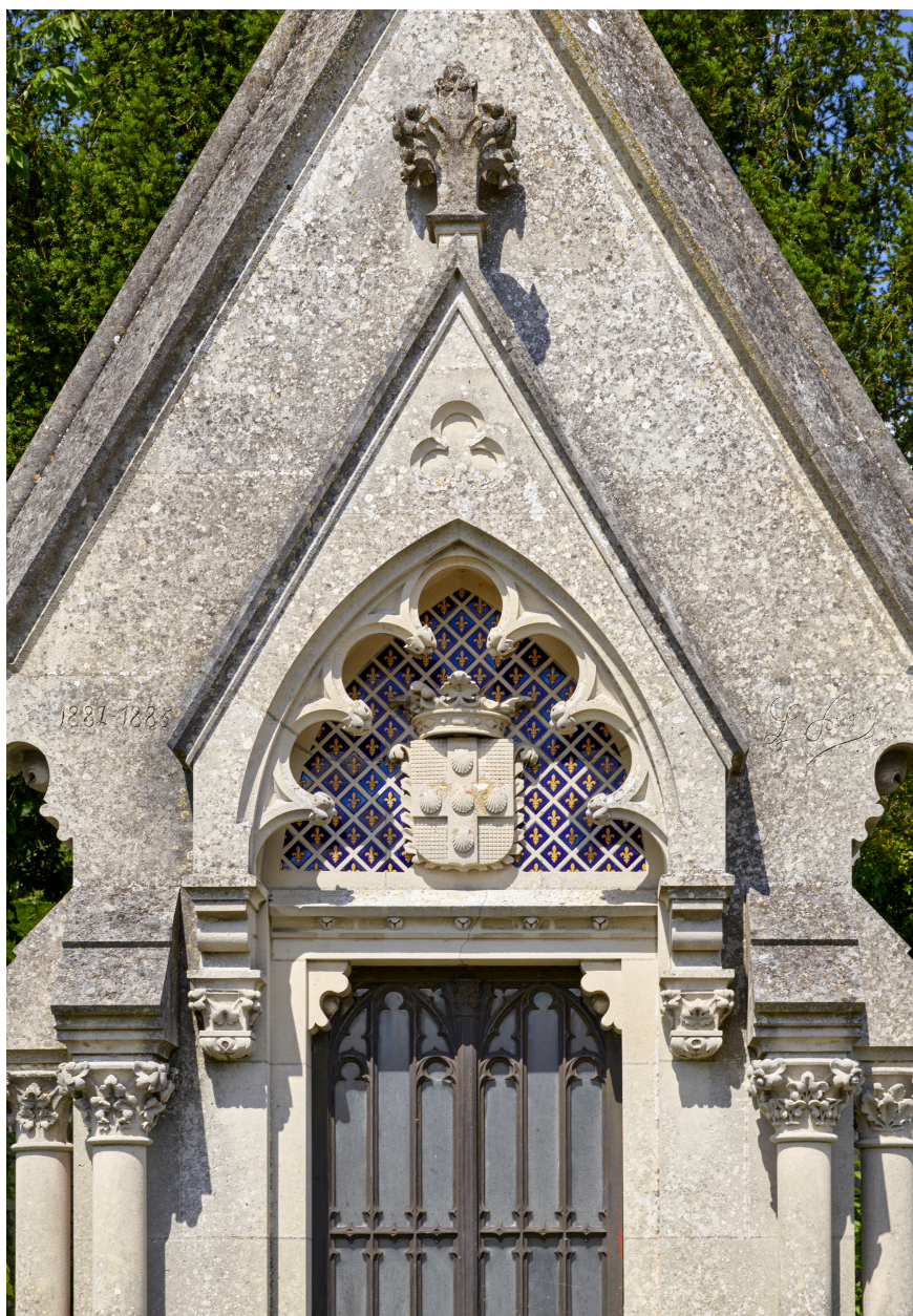
Détail du gable de la chapelle.