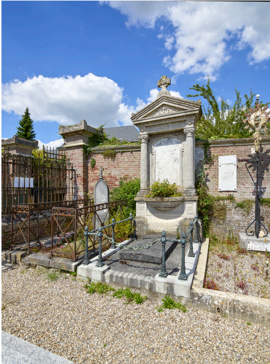
Tombe de la famille Poulet-Cossart, au nord du cimetière.