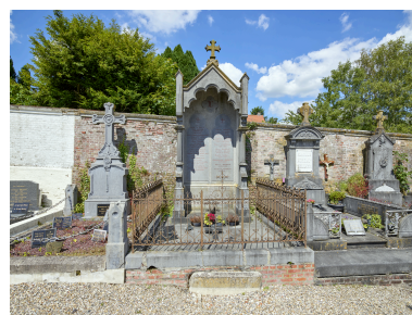
Tombe de la famille Lourdelle- Tillier, au nord du cimetière.