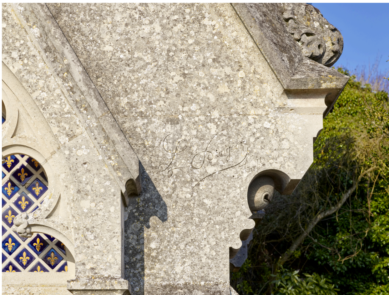
Signature de l'architecte, sur la chapelle, L. Digeon.