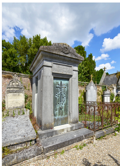
Chapelle de la famille Pecquet- Mansion, au nord du cimetière. IVR32_20258000454NUCA