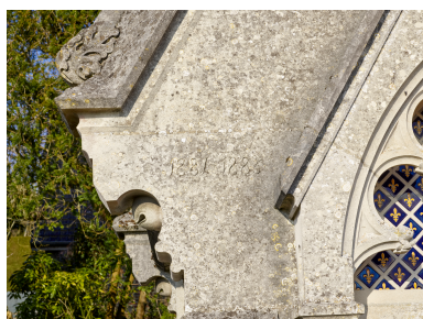
Date portée sur la chapelle, 1884-1885.