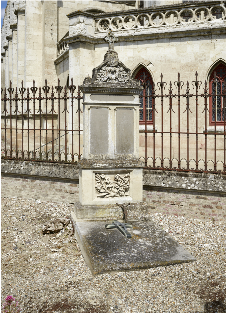
Tombe de la famille Horville-Demarest.