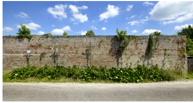
Croix de cimetière, contre le mur sud, rue du presbytère.