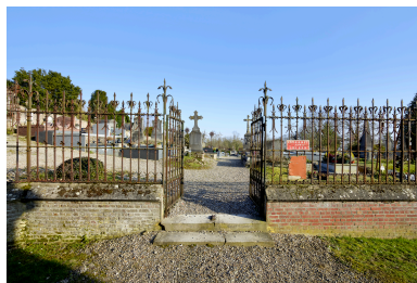
Vue de l'entrée du cimetière, depuis le chevet de l'église.