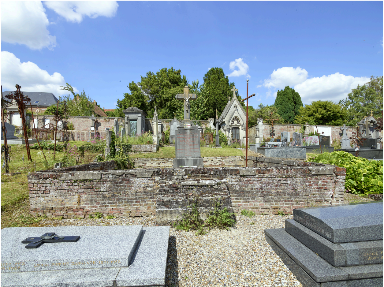
Enclos de la famille de Buissy et de Boubers.