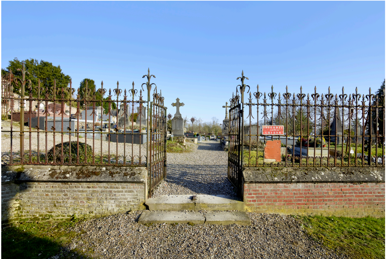
Vue de l'entrée du cimetière, depuis le chevet de l'église.