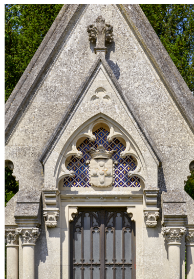
Détail du gable de la chapelle. IVR32_20258000457NUCA