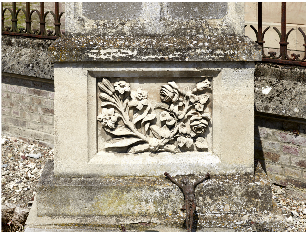
Détail des sculptures de la tombe de la famille Horville-Demarest.