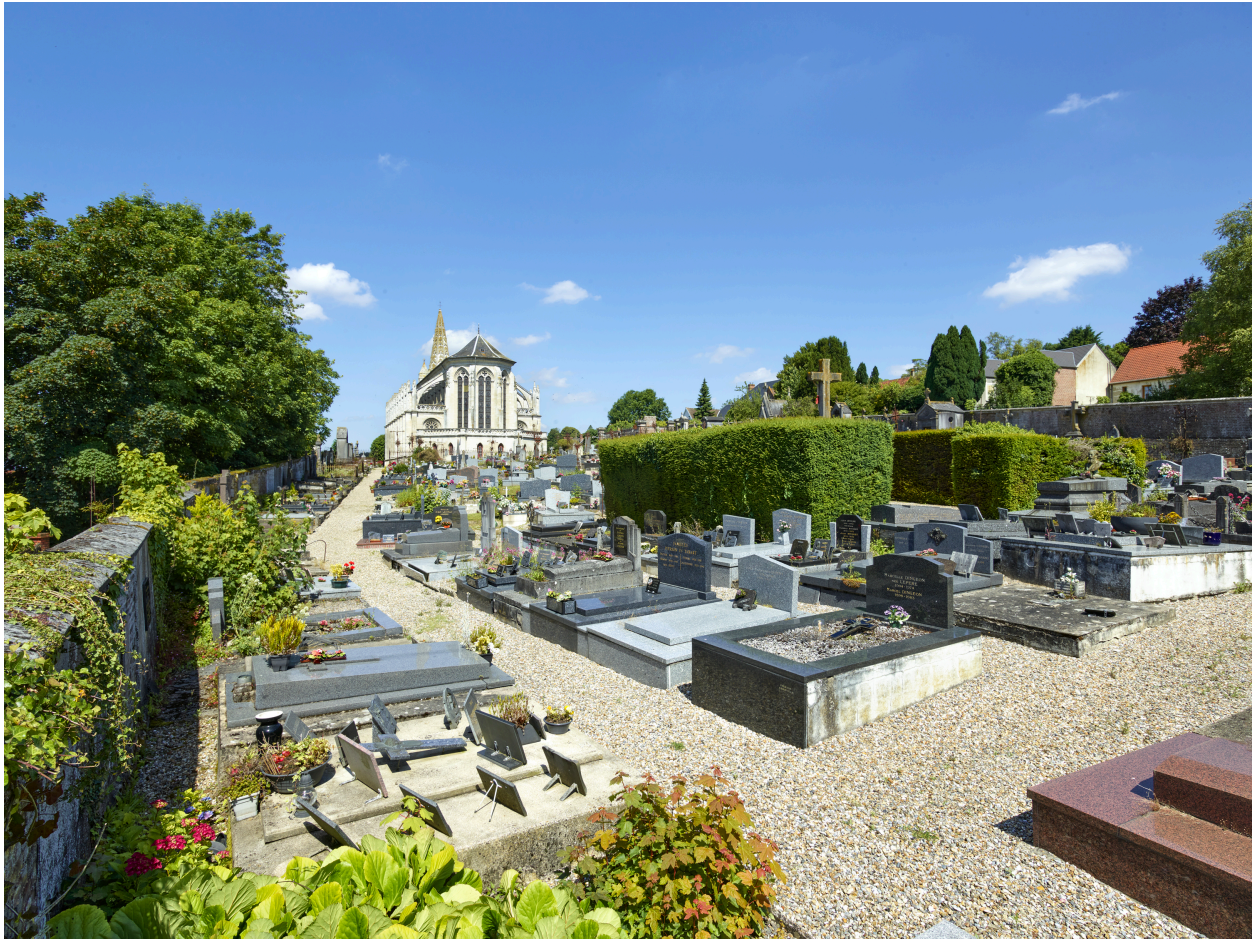
Vue d'ensemble du cimetière, depuis le sud-est.