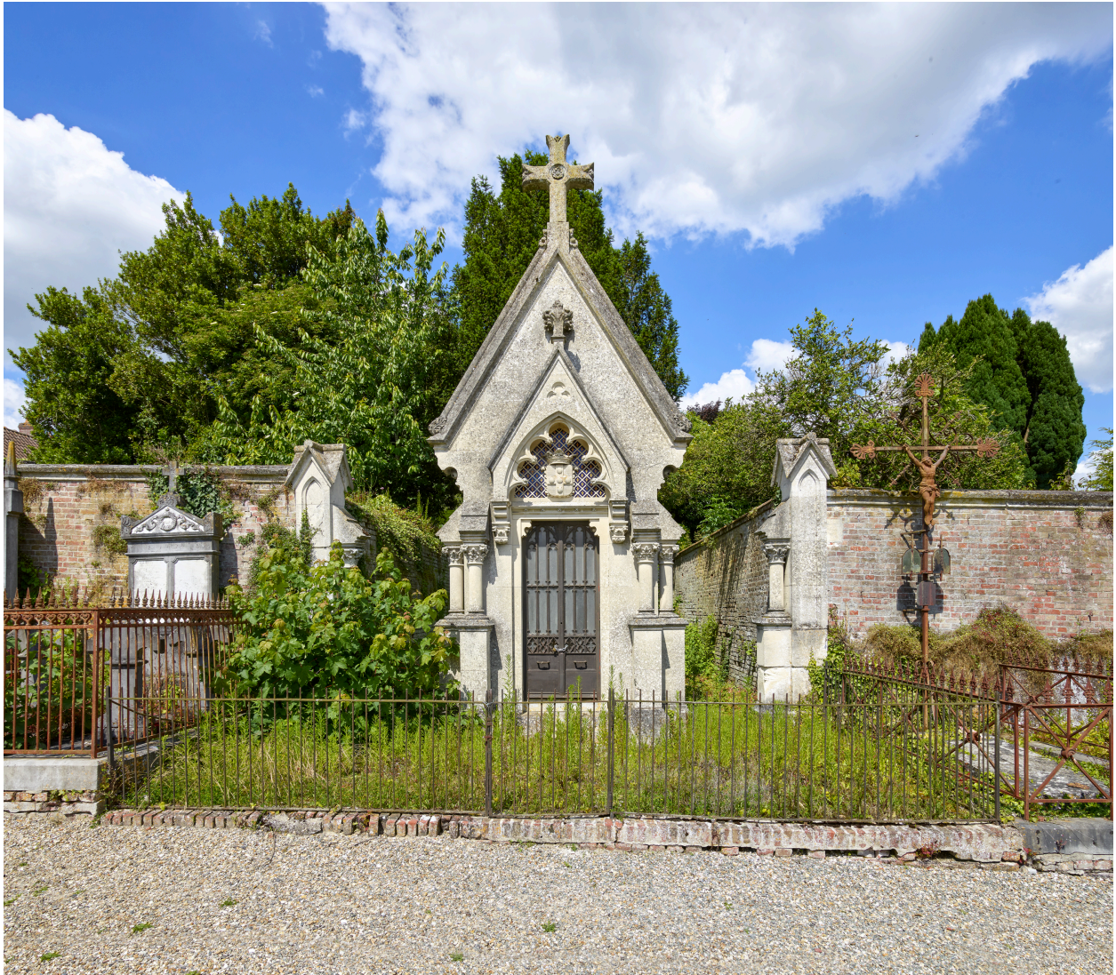
Enclos et chapelle de la famille de Rouvroy.