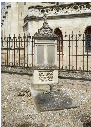
Tombe de la famille Horville-Demarest.