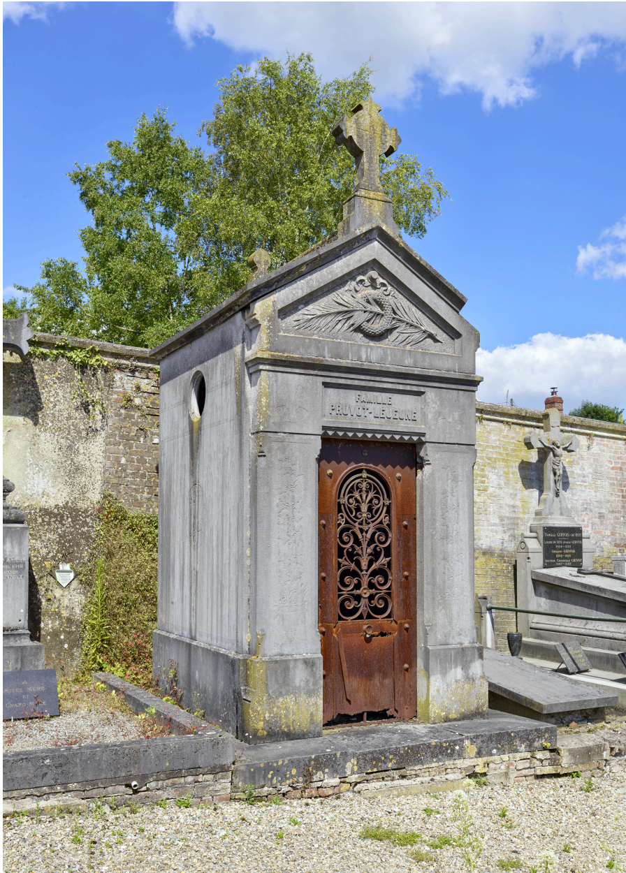
Chapelle de la famille Pruvot-Lejeune, au nord du cimetière.