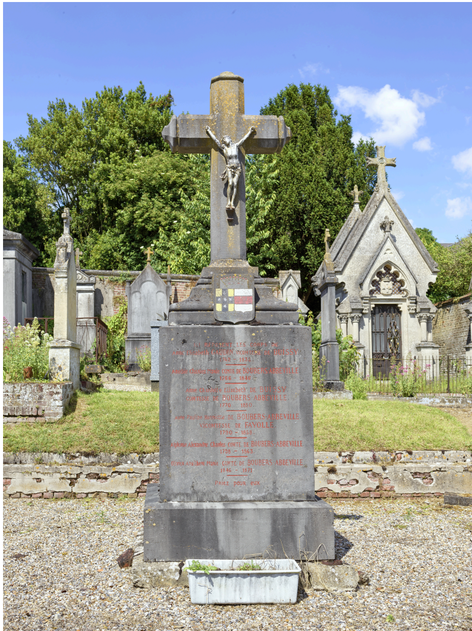
Croix de l'enclos de la famille de Buissey et de Boubers.