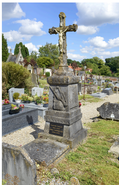
Tombe ornée d'une gibecière et d'un fusil.