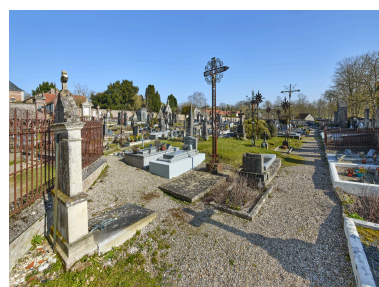
Vue d'ensemble du cimetière, depuis le sud-ouest. IVR32_20258000481NUCA