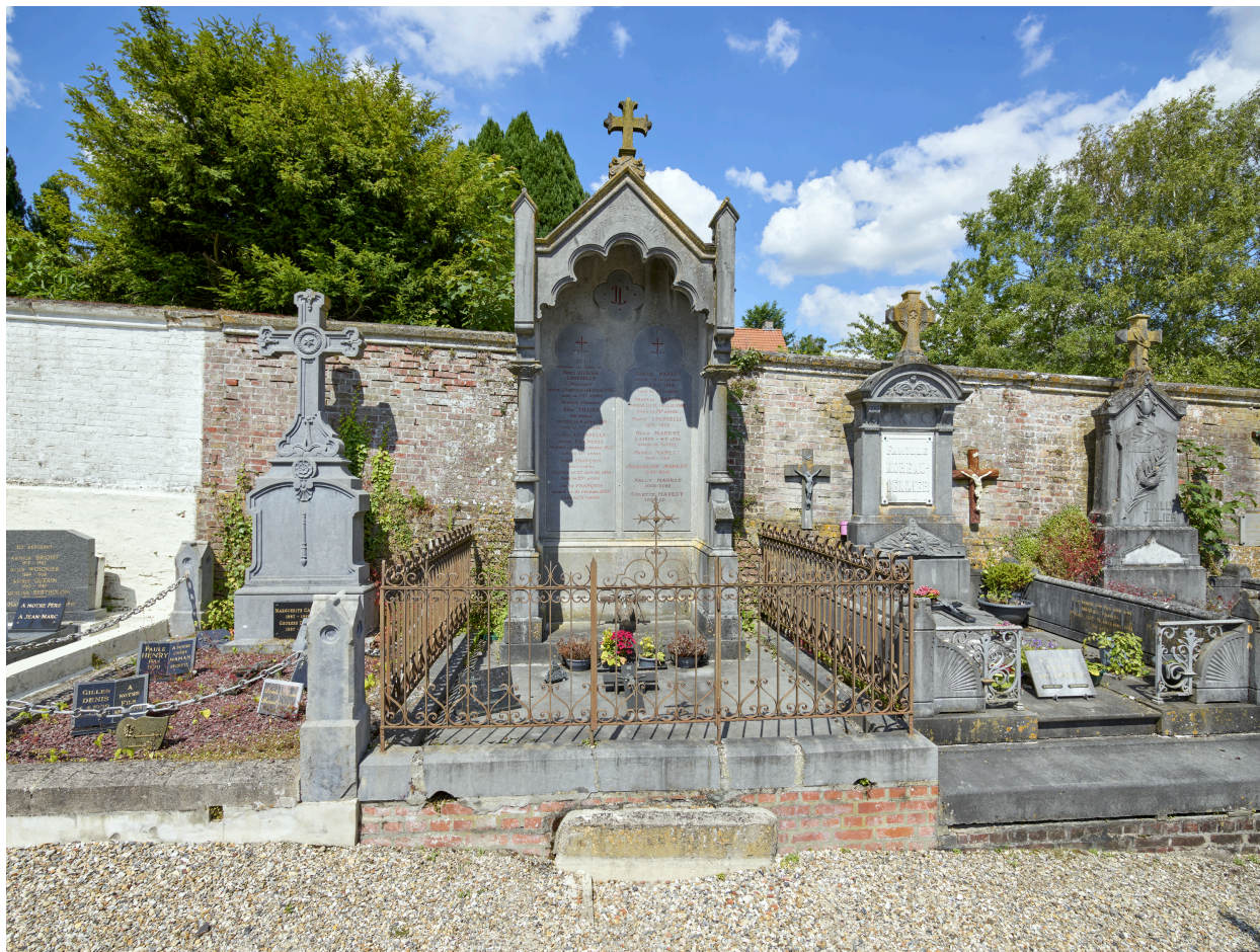
Tombe de la famille Lourdelle-Tillier, au nord du cimetière.