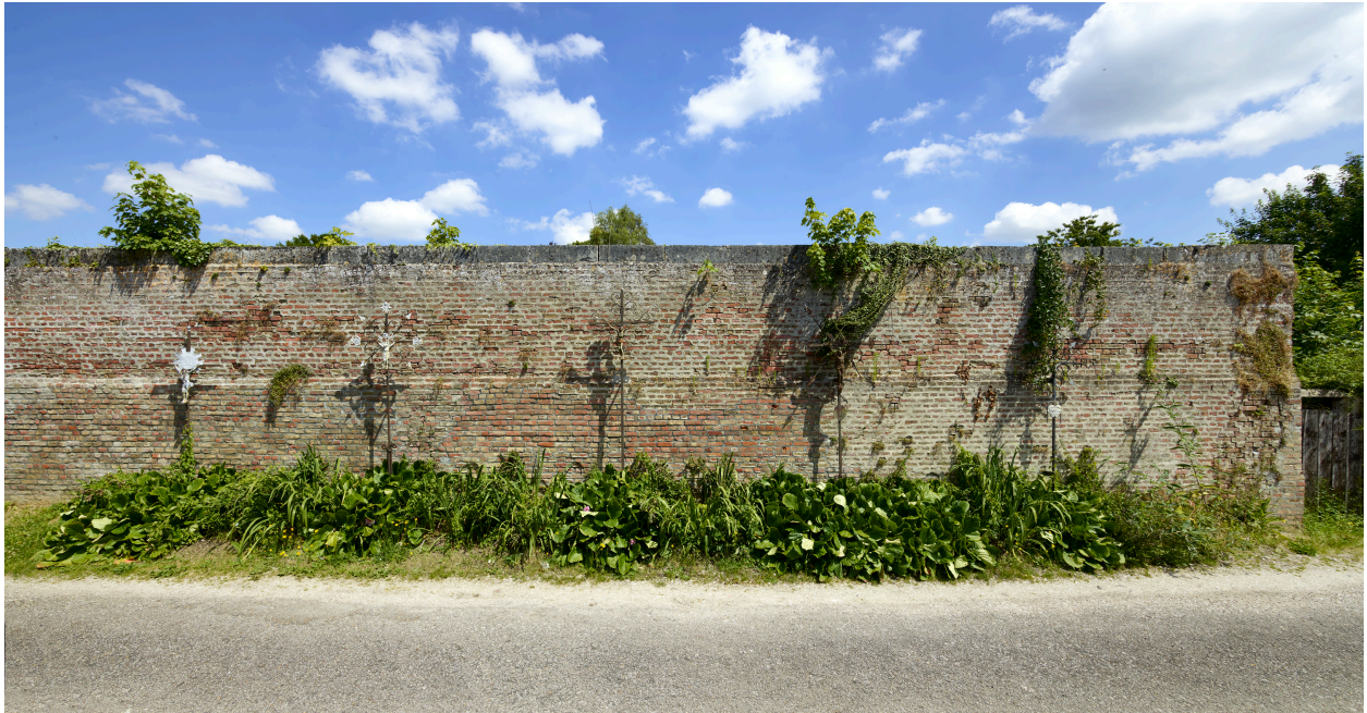
Croix de cimetière, contre le mur sud, rue du presbytère.