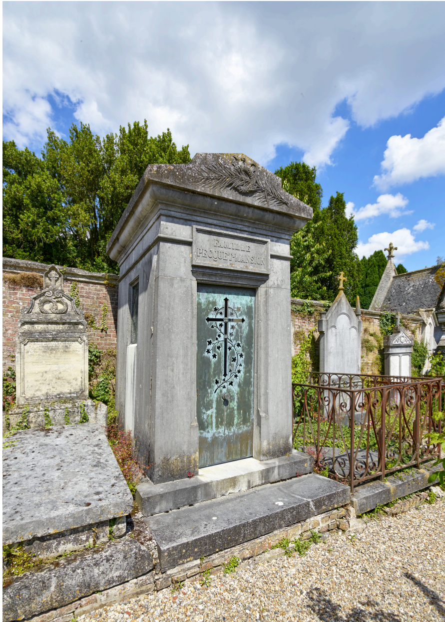
Chapelle de la famille Pecquet-Mansion, au nord du cimetière.