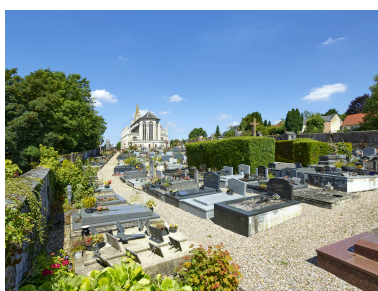
Vue d'ensemble du cimetière, depuis le sud-est. IVR32_20258000452NUCA