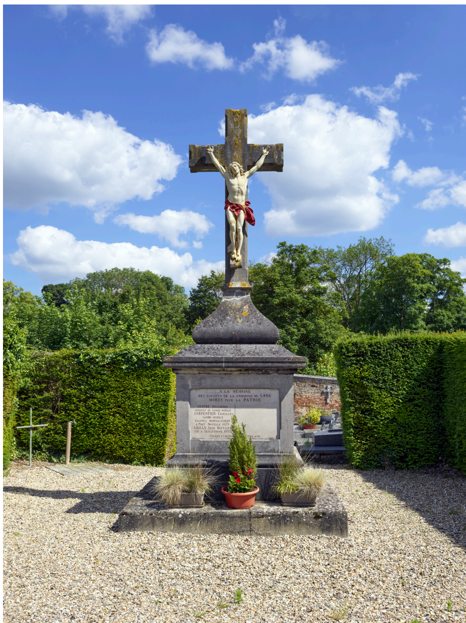
Croix commémorative, "À la mémoire / des enfants de la commune de Long / morts pour la Patrie".