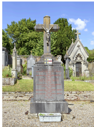
Croix de l'enclos de la famille de Buissy et de Boubers. IVR32_20258000469NUCA