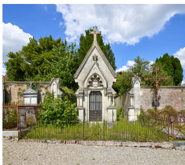
Enclos et chapelle de la famille de Rouvroy.