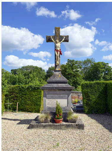
Croix commémorative, "À la mémoire / des enfants de la commune de Long / morts pour la Patrie".