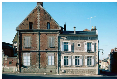
Elévation antérieure. Pignon.