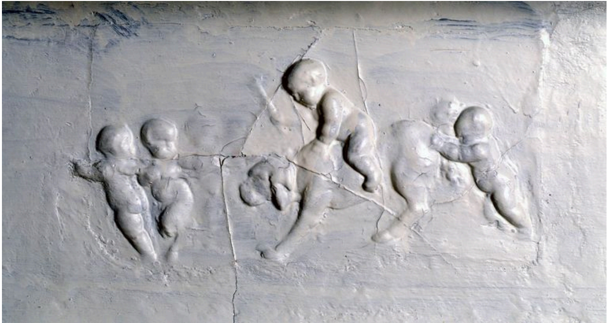
Détail du décor porté sur la cheminée de la pièce de réception.