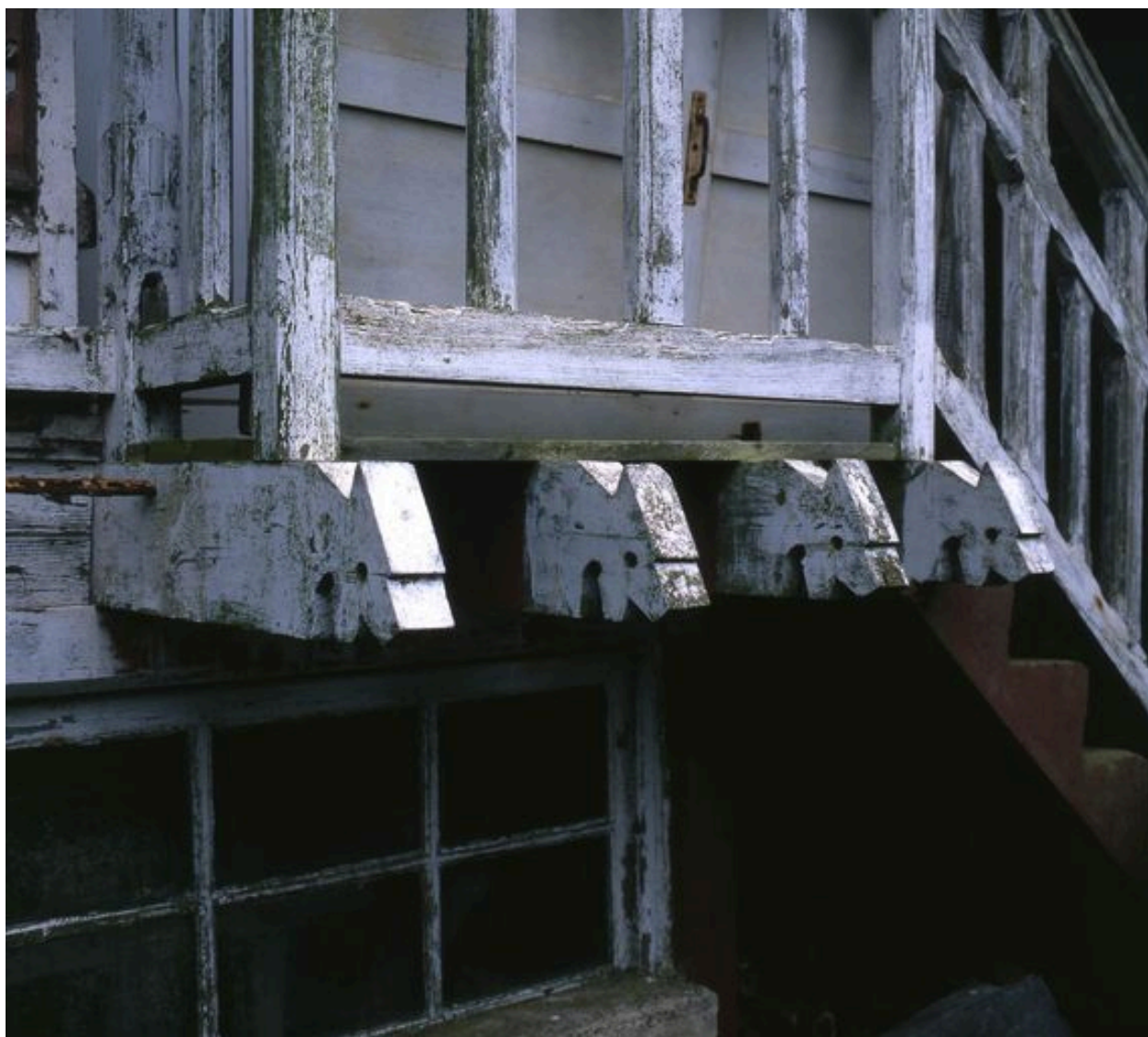
Détail des menuiseries extérieures.