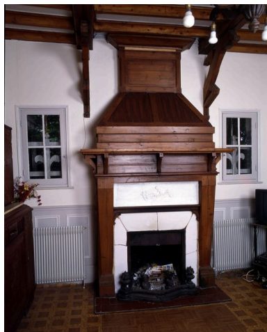
Vue de la cheminée de la pièce de réception. IVR22_20058001713XA