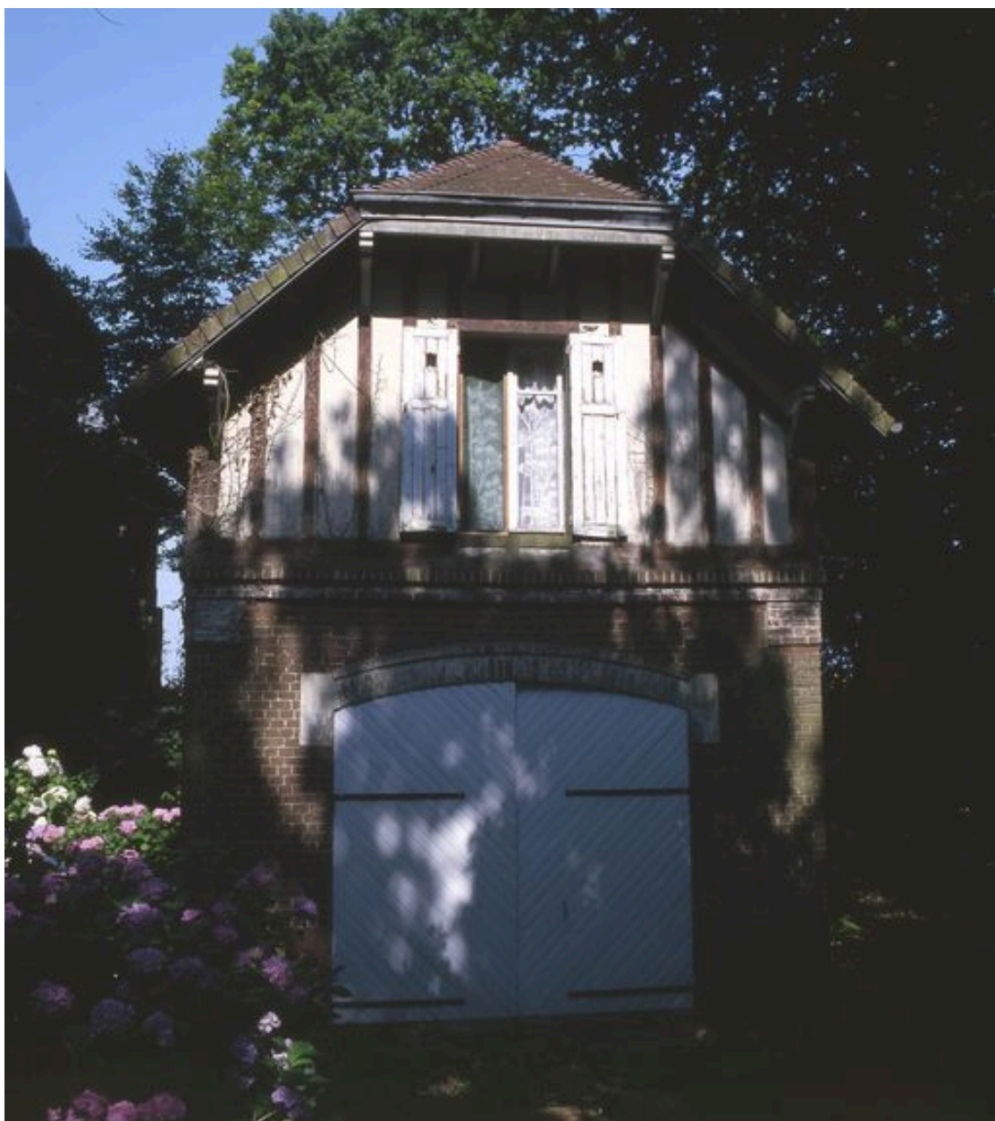
Vue de l'ancien garage à automobile (porte fermée).