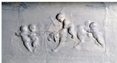
Détail du décor porté sur la cheminée de la pièce de réception. IVR22_20058001714XA