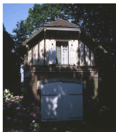
Vue de l'ancien garage à automobile (porte fermée).

IVR22_20058001707XA