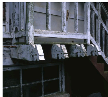
Détail des menuiseries extérieures.

Phot. Marie-Laure Monnehay-Vulliet IVR22_20058001711XA