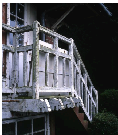
Détail des menuiseries extérieures.

IVR22_20058001710XA