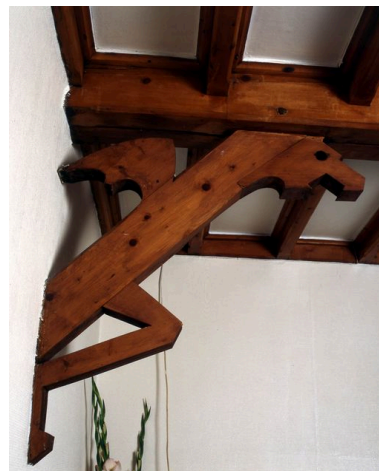
Détail d'une console de la pièce de réception figurant un animal fantastique. IVR22_20058001715XA