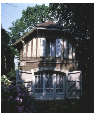
Vue de l'ancien garage à automobile (porte ouverte).

Phot. Marie-Laure Monnehay-Vulliet IVR22_20058001709XA