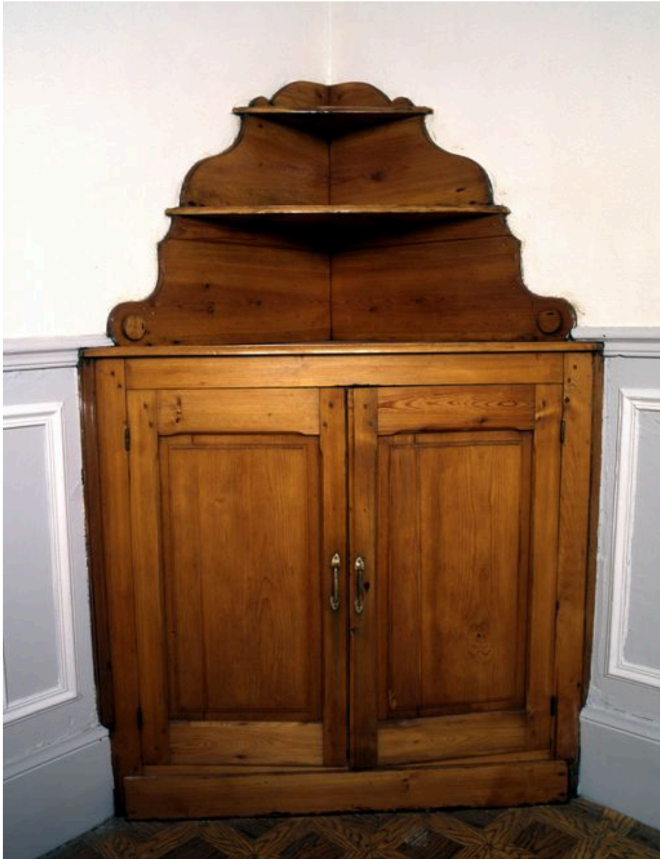
Détail d'un meuble d'angle de la pièce de réception.