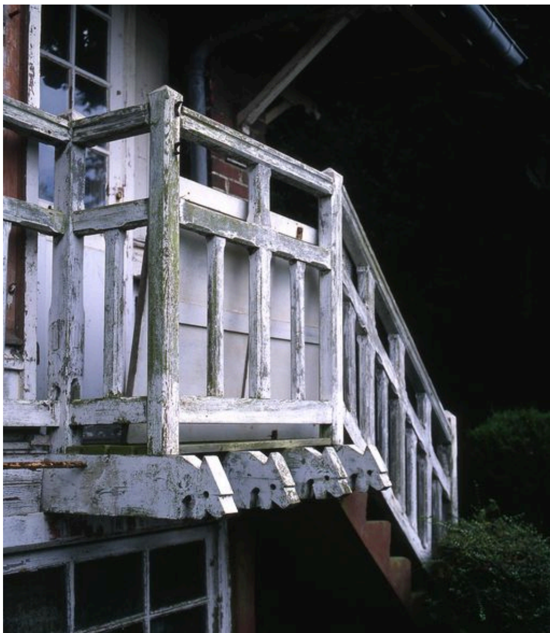
Détail des menuiseries extérieures.