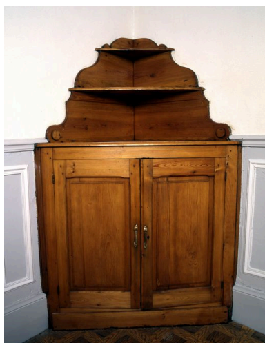
Détail d'un meuble d'angle de la pièce de réception.