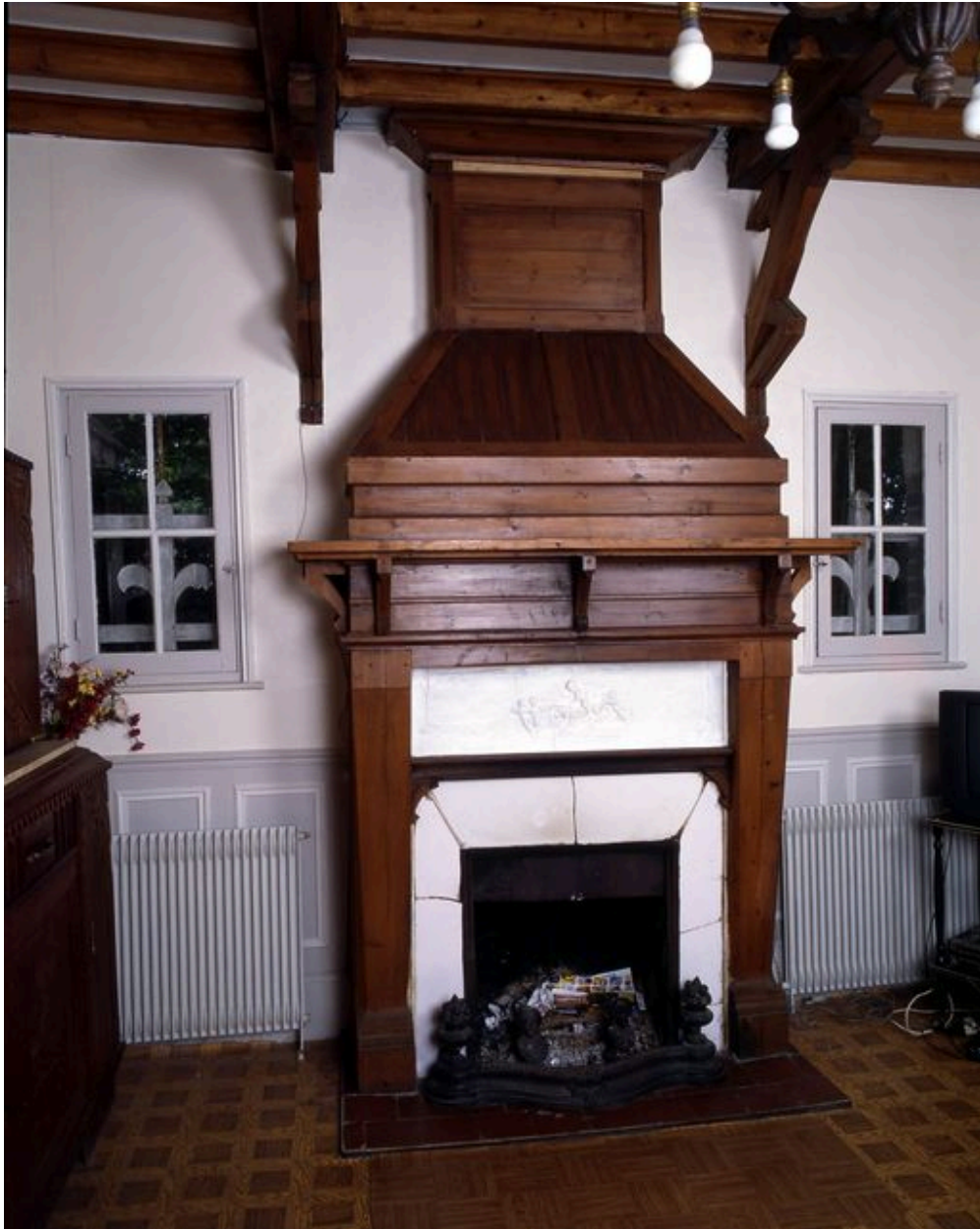
Vue de la cheminée de la pièce de réception.