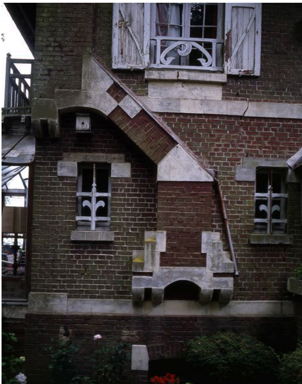
Détail de la fausse cheminée décorative en façade antérieure.