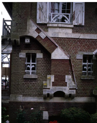
Détail de la fausse cheminée décorative en façade antérieure.

Phot. Marie-Laure Monnehay-Vulliet IVR22_20058001800XA