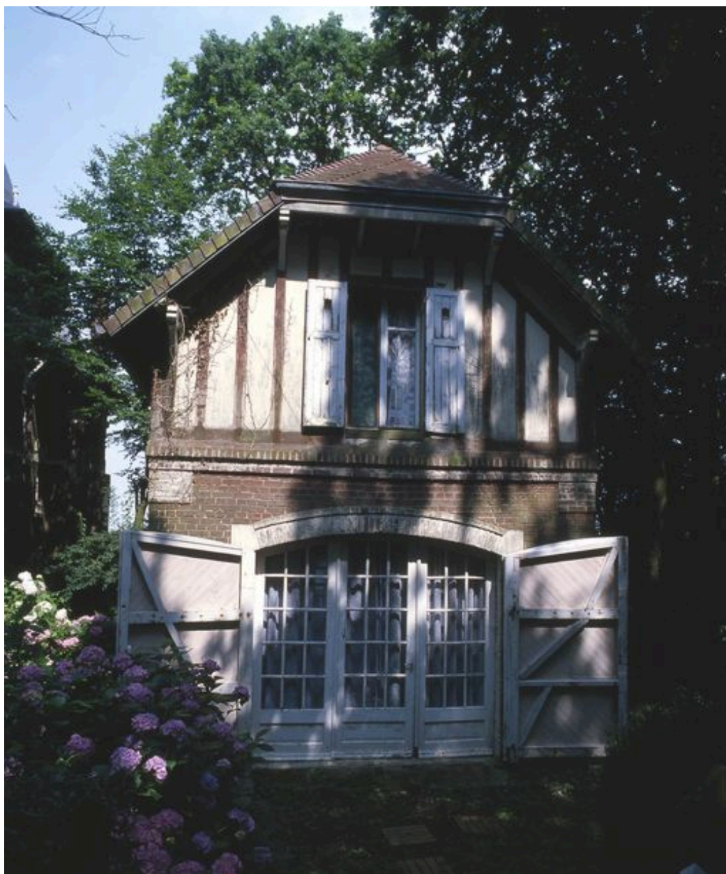
Vue de l'ancien garage à automobile (porte ouverte).