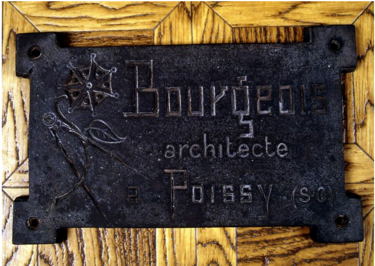
Détail de la plaque de fonte portant signature de l'architecte Théophile Bourgeois, déposée.