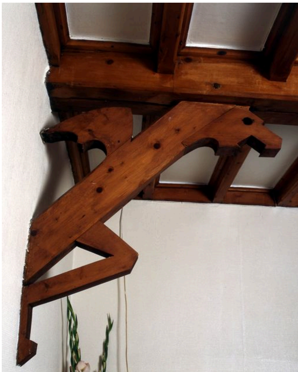
Détail d'une console de la pièce de réception figurant un animal fantastique.