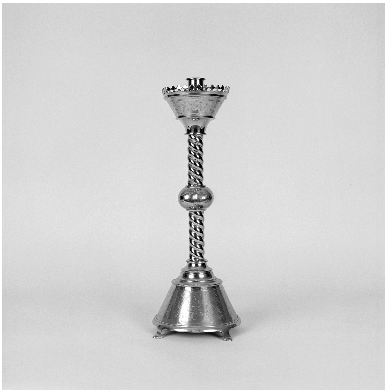
Chandelier d'autel, 6 : vue générale d'un élément.