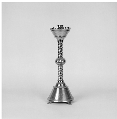
Chandelier d'autel, 6 : vue générale d'un élément. IVR31_19956200096X