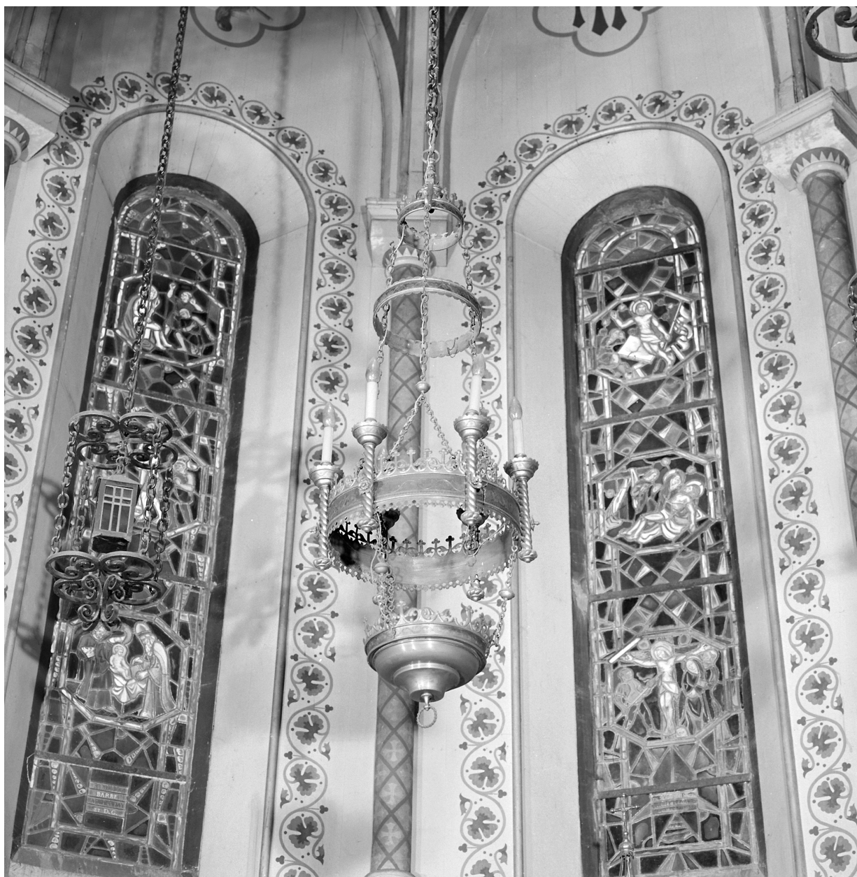
Lampe du Saint Sacrement, vue générale.