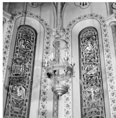
Lampe du Saint Sacrement, vue générale. IVR31_19956200134X