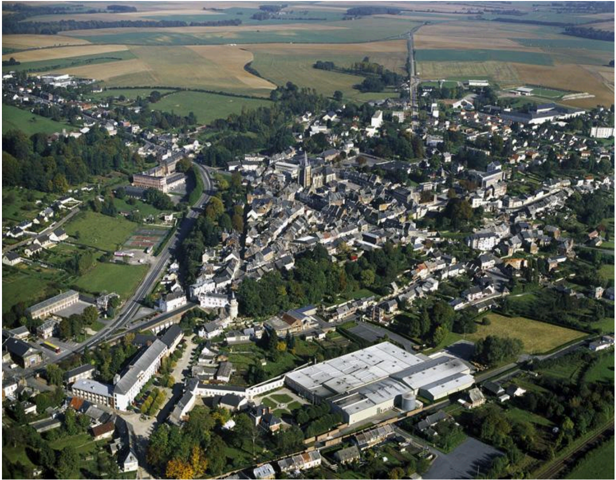
Vue générale, depuis le sud-ouest.