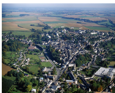
Vue générale, depuis l'ouest.