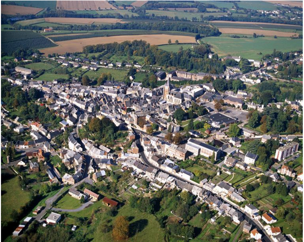
Vue générale, depuis le sud-est.