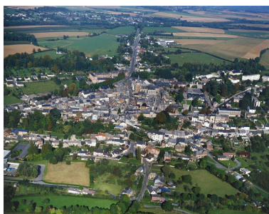
Vue générale, depuis le sud.