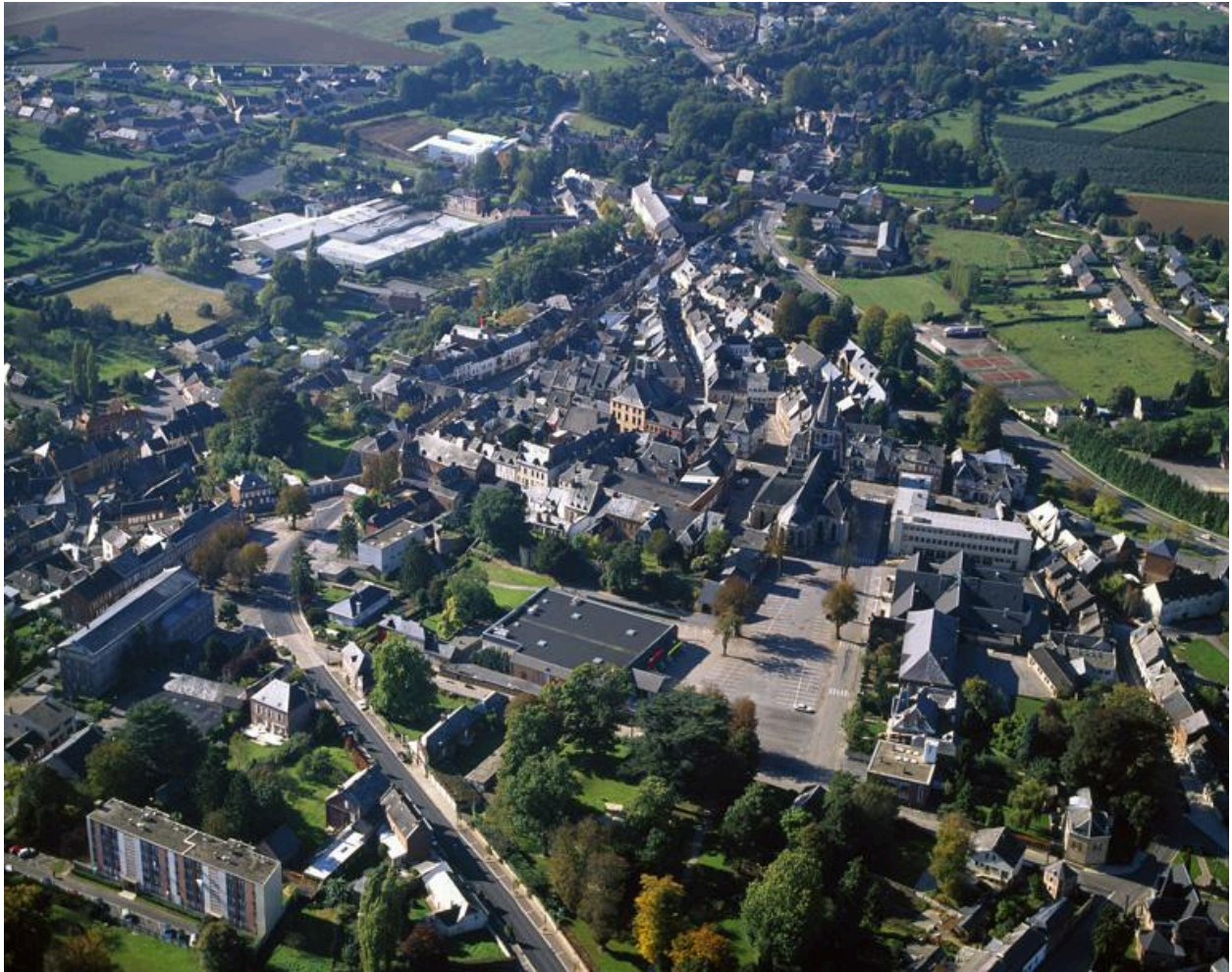
Vue générale, depuis l'est.