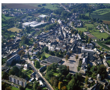
Vue générale, depuis l'est.