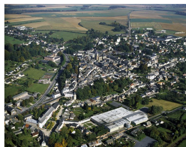
Vue générale, depuis le sud-ouest.