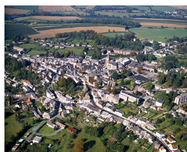
Vue générale, depuis le sud-est.