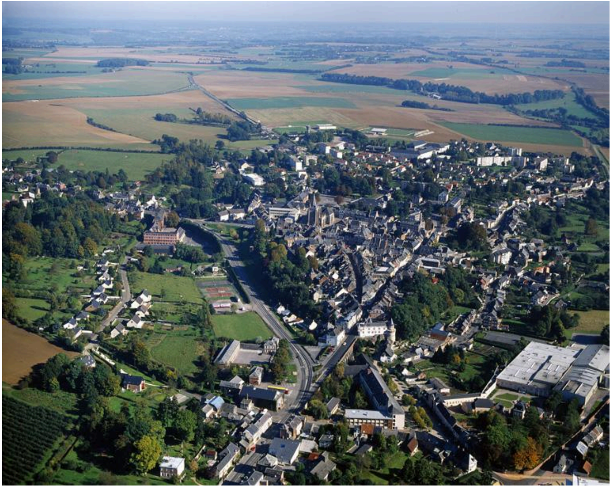
Vue générale, depuis l'ouest.