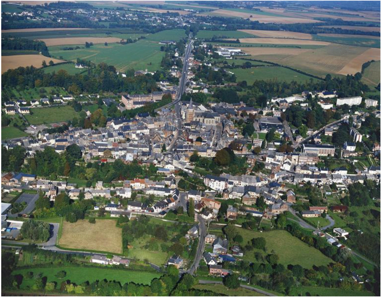
Vue générale, depuis le sud.