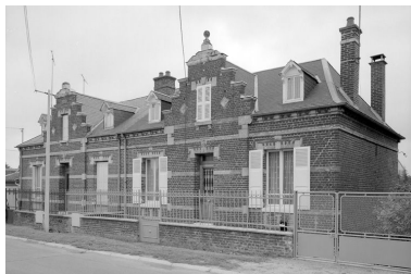
Elévation antérieure. IVR22_19856000948X

IVR22_20096000171NUCA