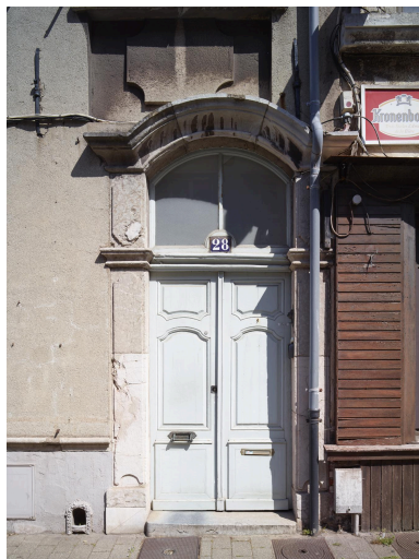
Vue de la porte d'entrée.