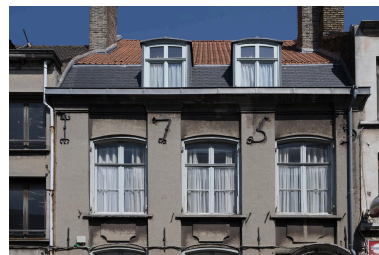
Vue de la date 1755 sur les fers d'ancrage. IVR32_20255900656NUCA