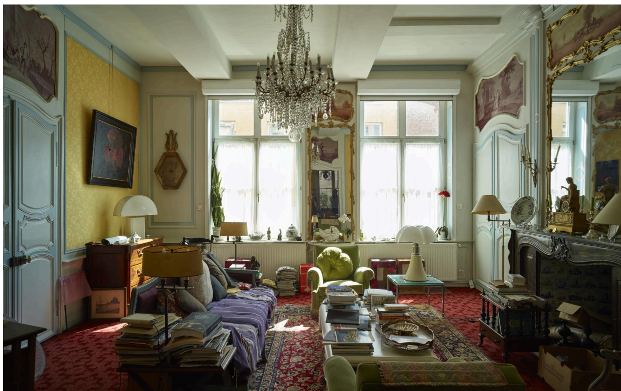
Vue générale du salon.