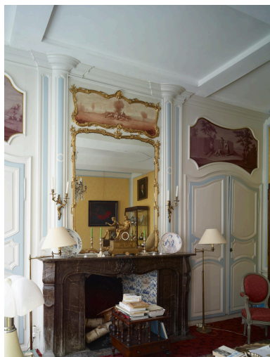
Vue de la cheminée du salon.