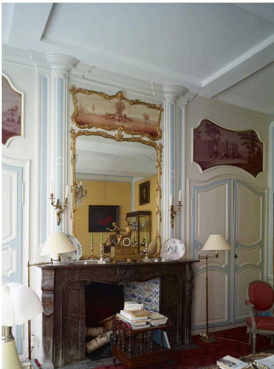
Vue de la cheminée du salon.