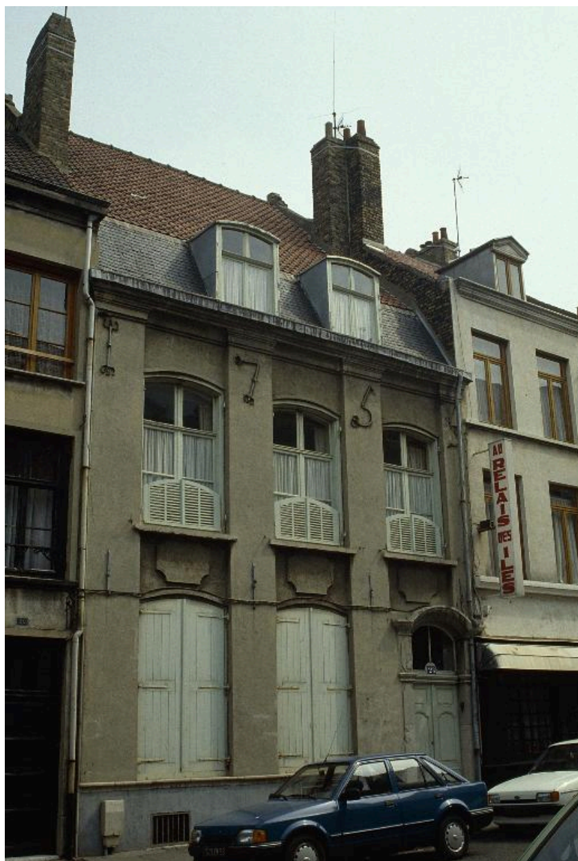
Vue générale de la façade en 1988.