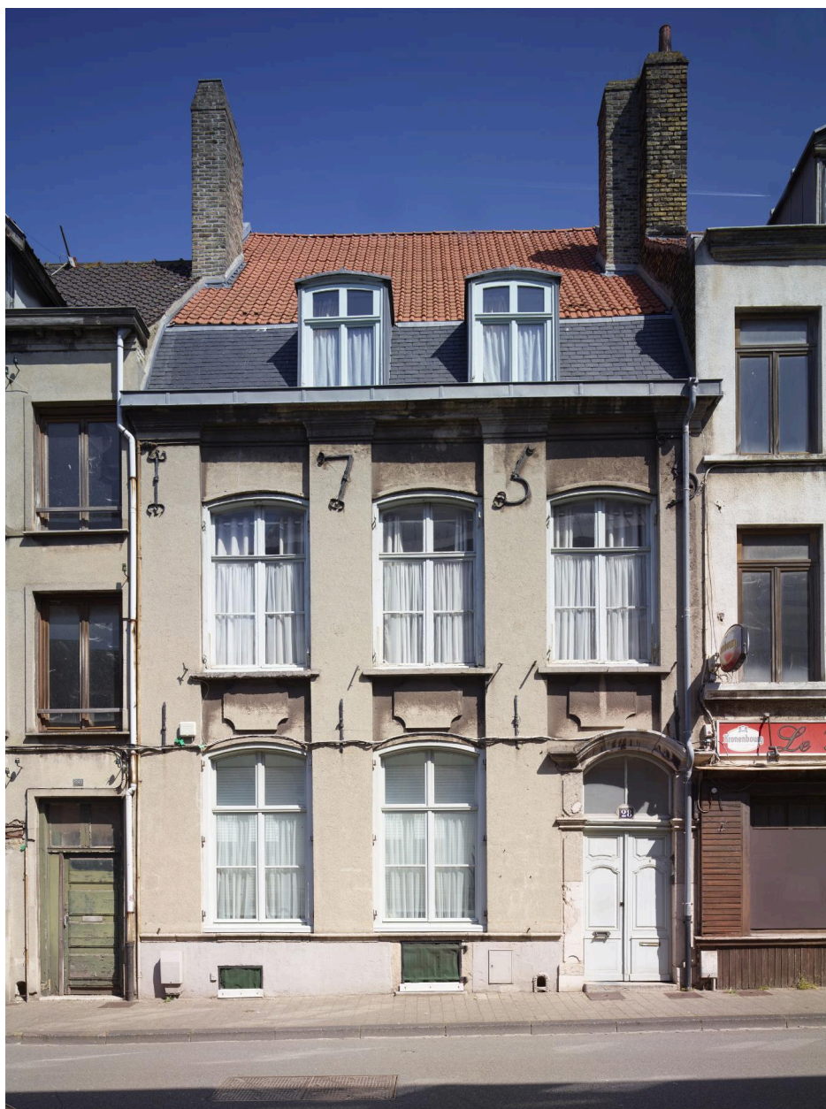
Vue générale de la façade.