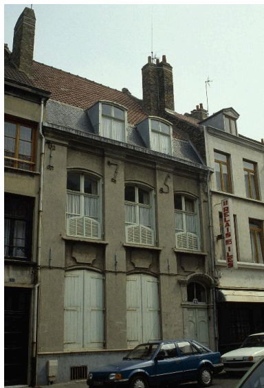
Vue générale de la façade en 1988.