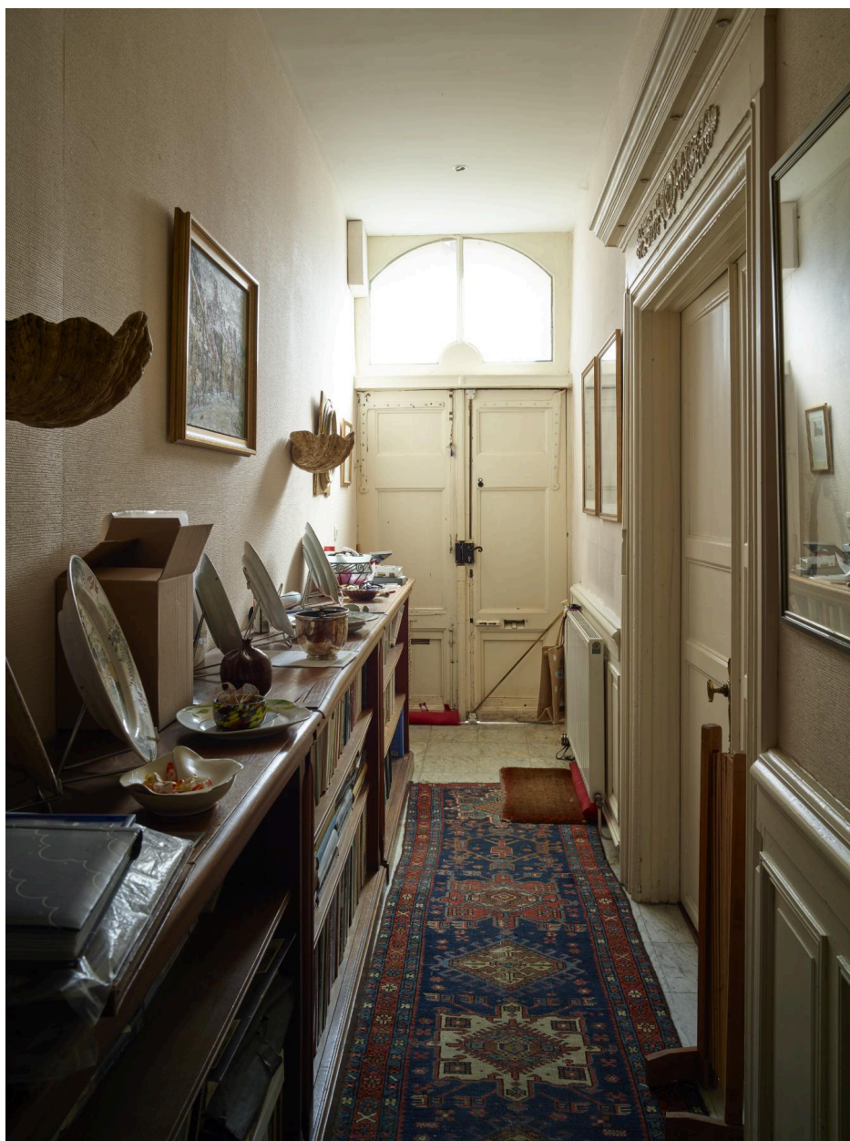
Vue du couloir vers la porte d'entrée.