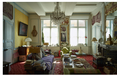
Vue générale du salon. IVR32_20255900681NUCA