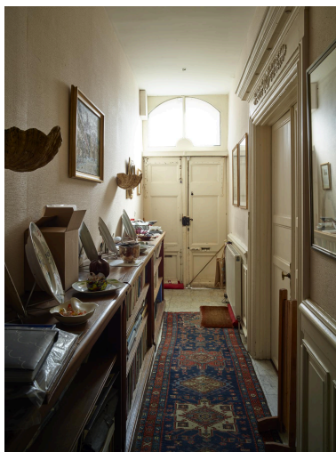
Vue du couloir vers la porte d'entrée. IVR32_20255900675NUCA