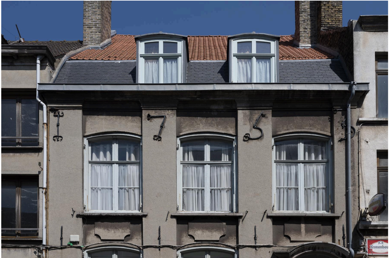
Vue de la date 1755 sur les fers d'ancrage.