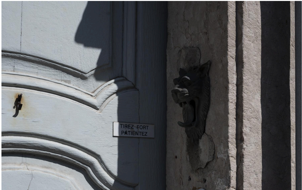
Vue de détail de la sonnette en forme de tête de lion.