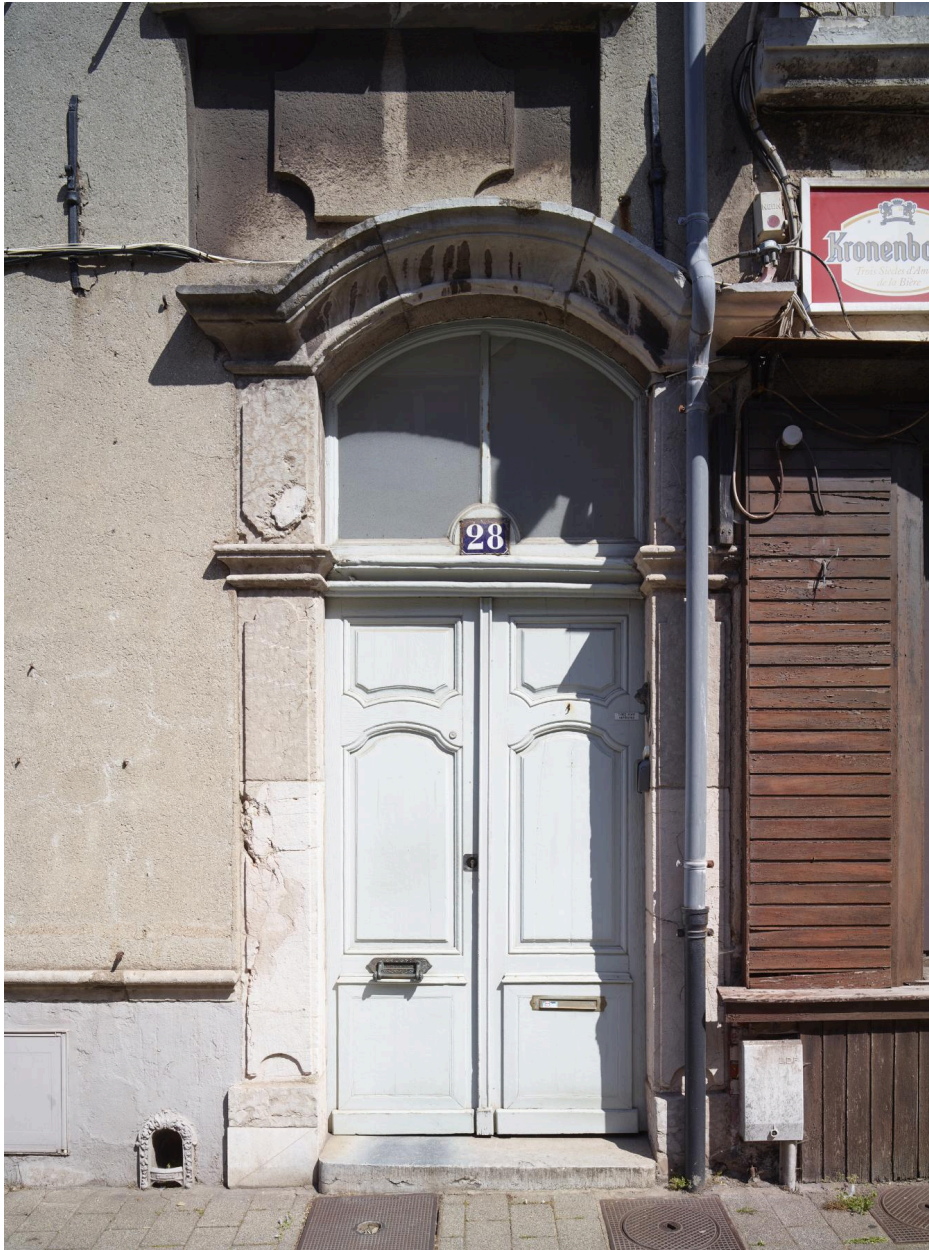
Vue de la porte d' entrée.