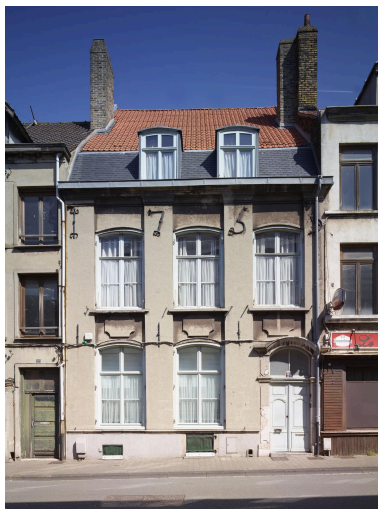
Vue générale de la façade.