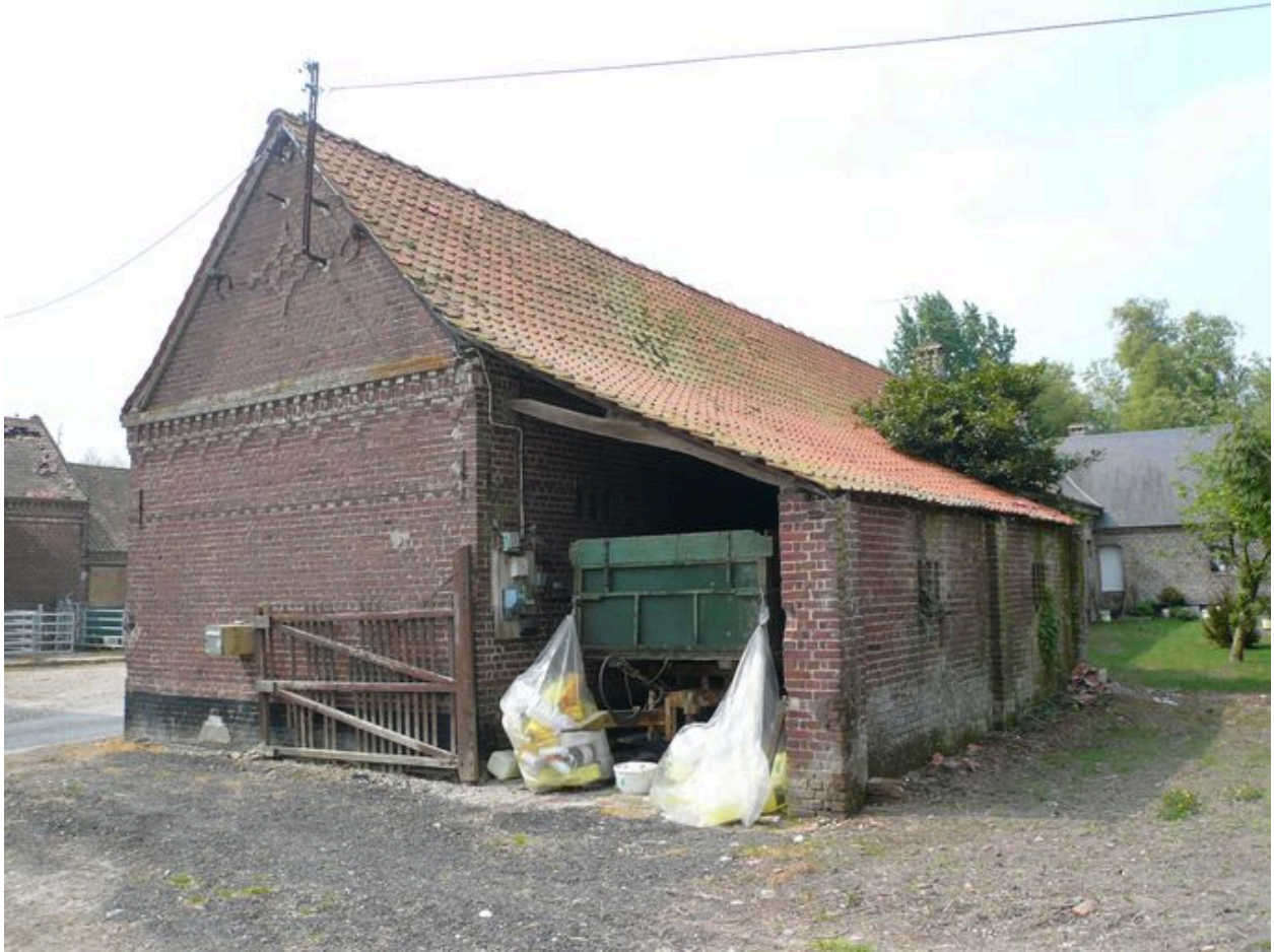
Vue postérieure des écuries avec charretterie.