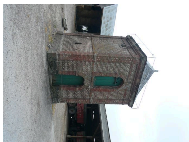
Vue du pigeonnier au coeur de la cour.