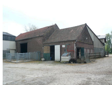
Vue de la grange-étable.