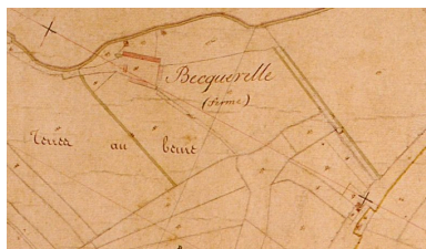
Extrait du cadastre napoléonien présentant le plan de la ferme en 1828.

IVR22_20078005781XAB