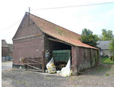
Vue postérieure des écuries avec charretterie.