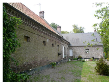
Vue postérieure du logis avec la cave formant saillie perpendiculaire.