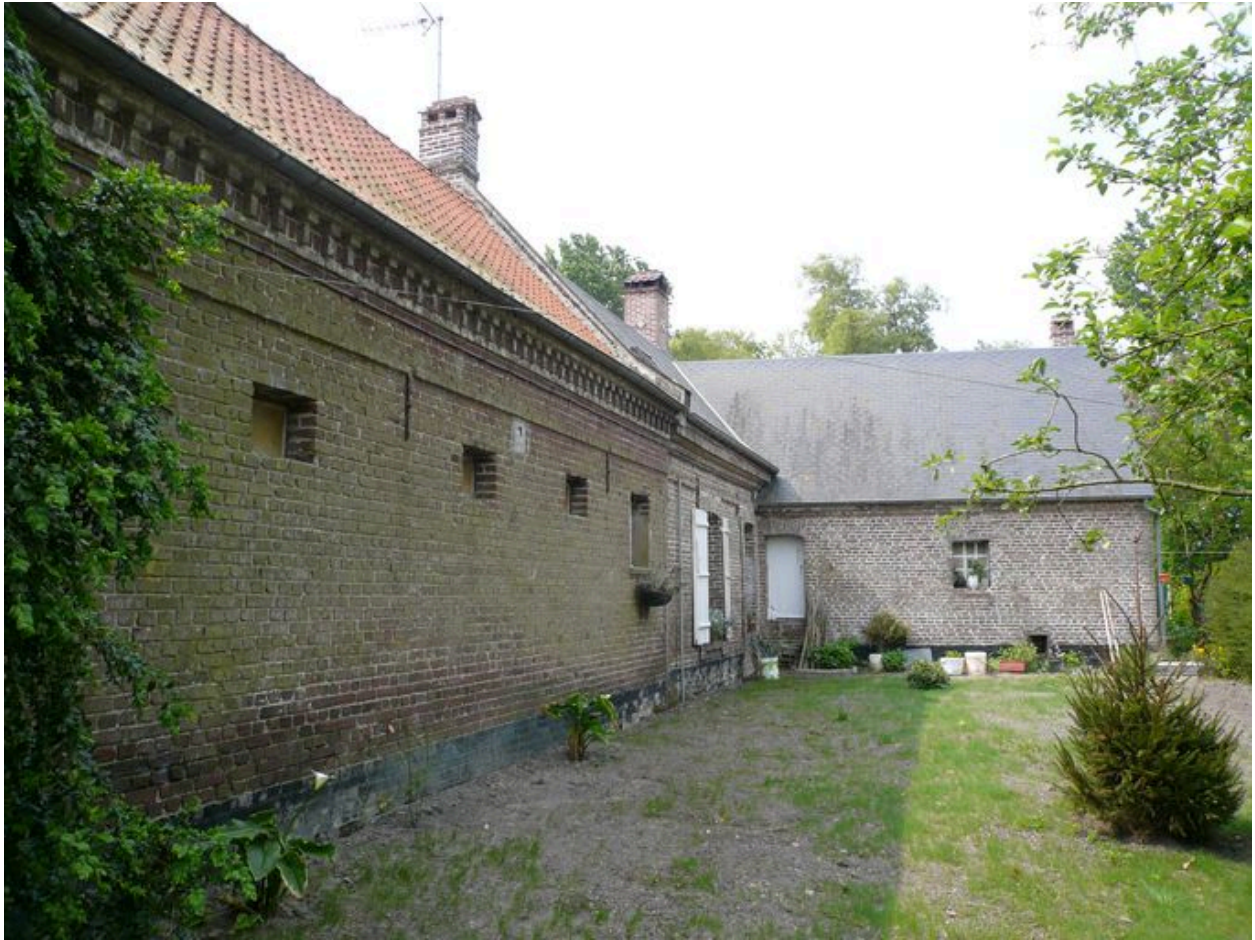
Vue postérieure du logis avec la cave formant saillie perpendiculaire.