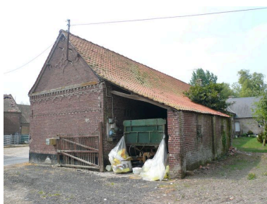
Vue postérieure des écuries avec charretterie.