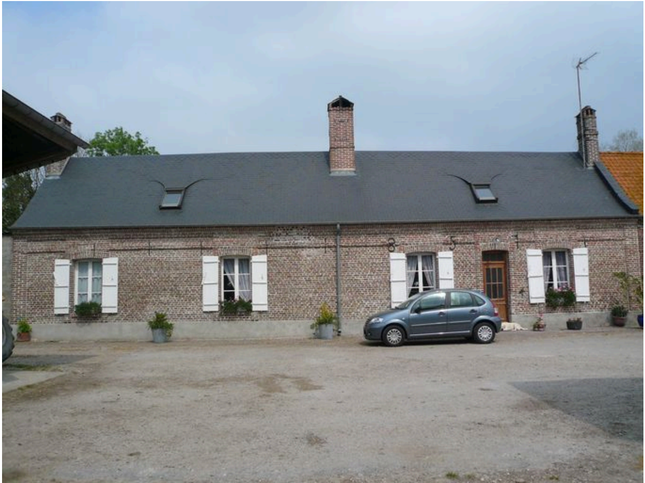
Vue du logis.