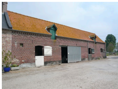
Vue des écuries dans le prolongement du logis.