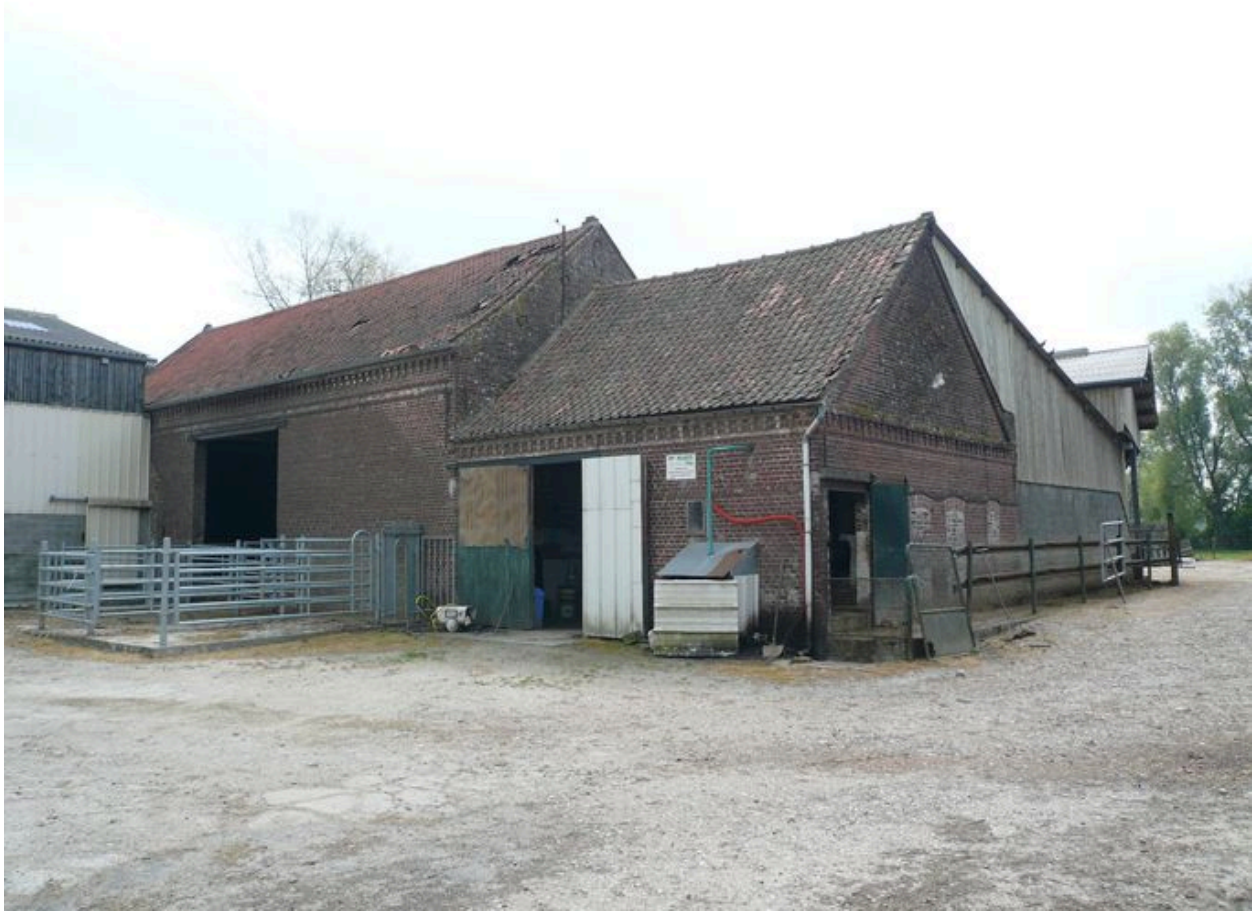
Vue de la grange-étable.