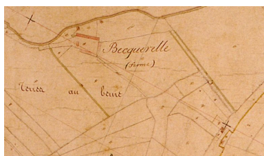
Extrait du cadastre napoléonien présentant le plan de la ferme en 1828.

IVR22_20078005781XAB