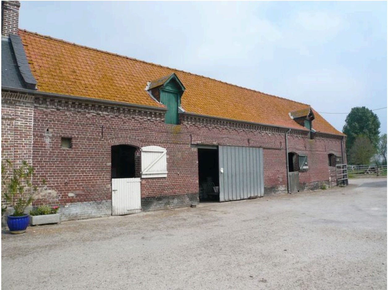
Vue des écuries dans le prolongement du logis.