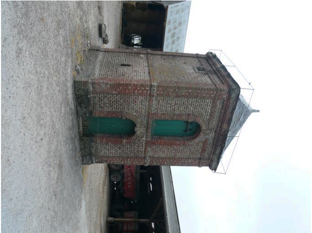
Vue du pigeonnier au coeur de la cour.