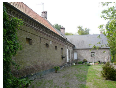
Vue postérieure du logis avec la cave formant saillie perpendiculaire.