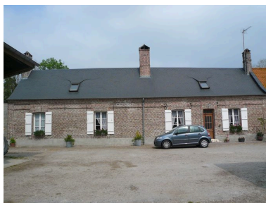
Vue du logis.

IVR22_20078005781XAB