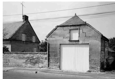
Remise. IVR22_19856000747X