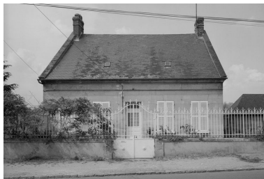
Élévation antérieure. IVR22_19856000746X