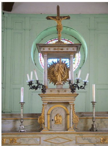
Détail du tabernacle à dais d'exposition.

IVR22_20128001220NUC2A