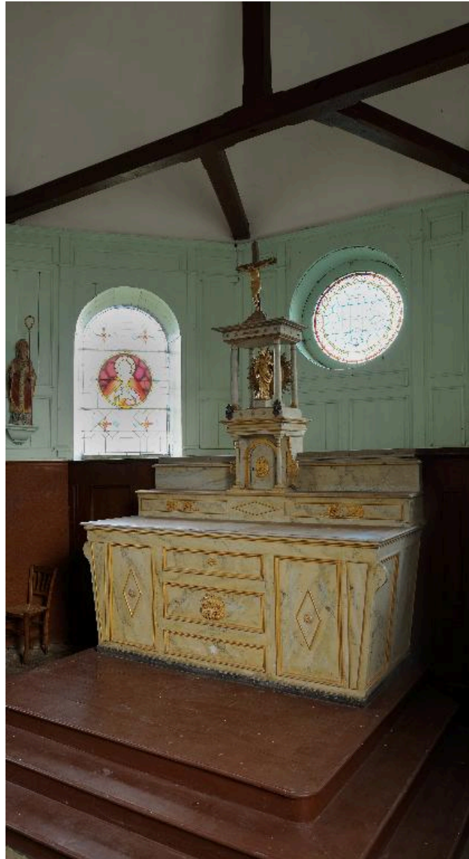
Vue générale de trois quarts droit.