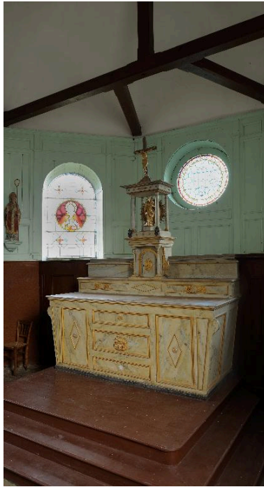
Vue générale de trois quarts droit. IVR22_20128001221NUC2A