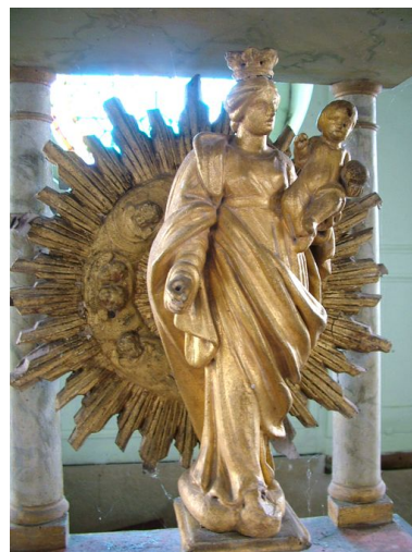
Statuette de Vierge à l'Enfant sous le dais d'exposition.

Phot. Frédéric Fournis IVR22_20108001308NUCA