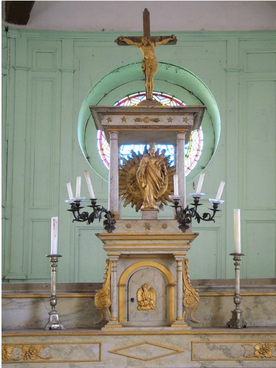
Détail du tabernacle à dais d'exposition.