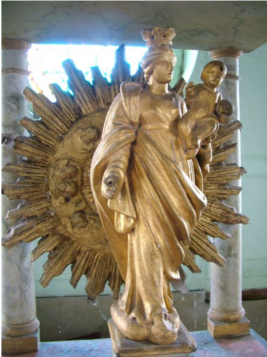
Statuette de Vierge à l'Enfant sous le dais d'exposition.