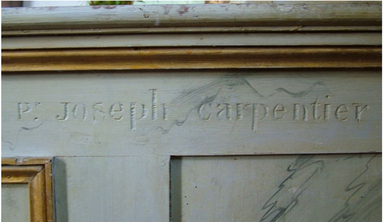
Signature gravée sur le bord latéral de l'autel : Pr Joseph carpentier.