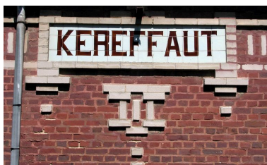
Détail de l'appellation, élévation antérieure.

IVR22_20048001475NUCA