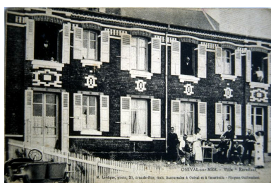
Carte postale, 1er quart 20e siècle (coll. part.).

IVR22_20058000603XAB