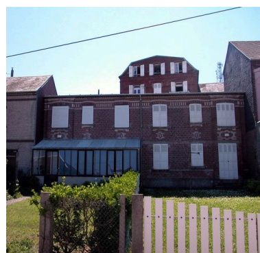
Vue d'ensemble depuis la rue de la Terrasse. IVR22_20048001474NUCA