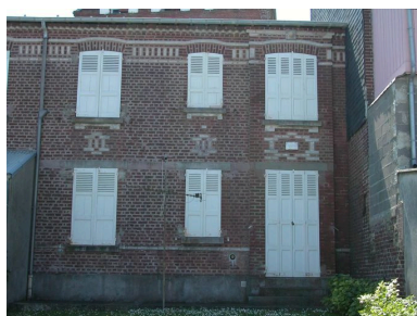
Détail d'une unité, élévation postérieure côté mer.

IVR22_20048001475NUCA