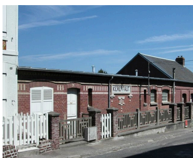
Vue d'ensemble depuis la rue Gros.