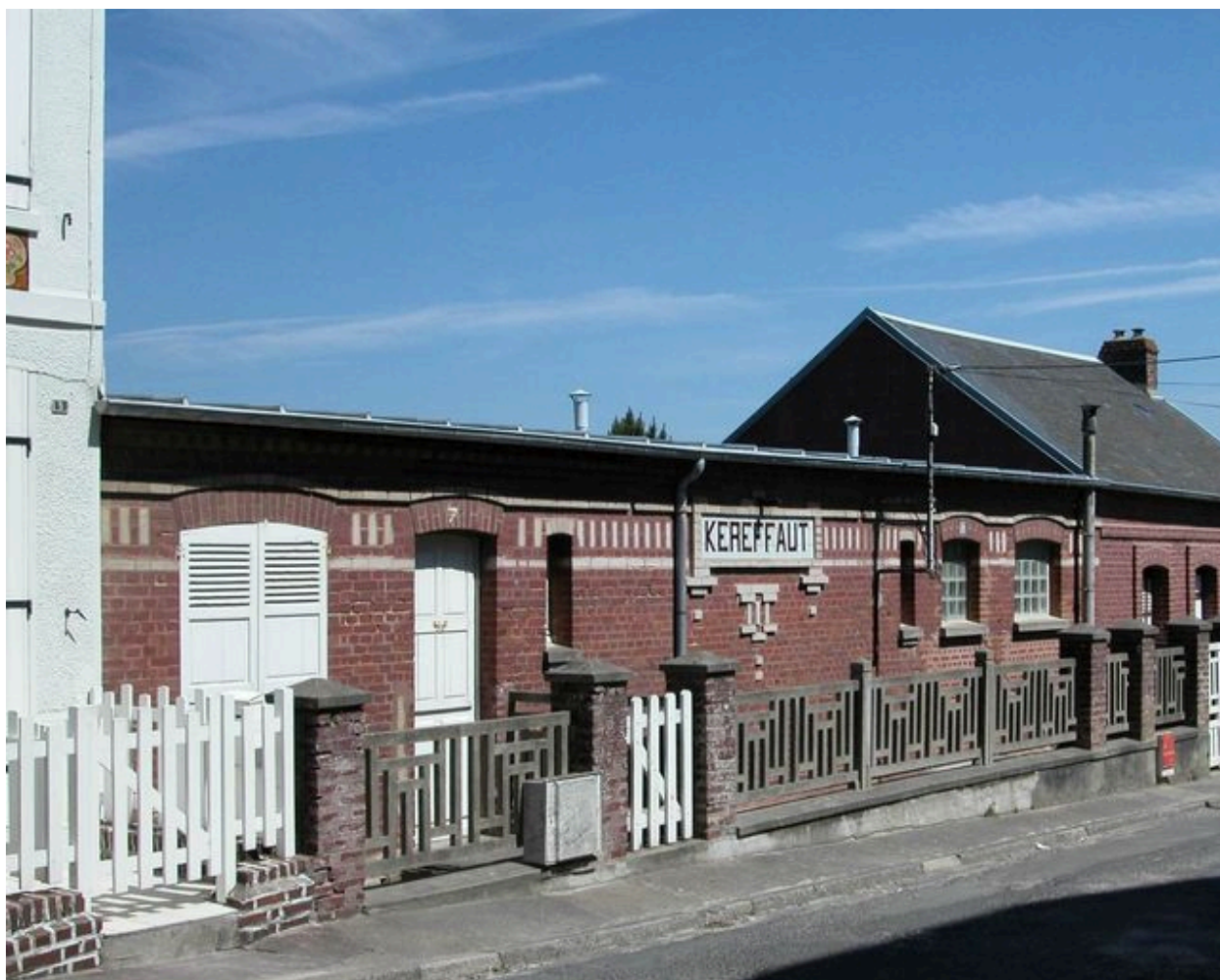
Vue d'ensemble depuis la rue Gros.