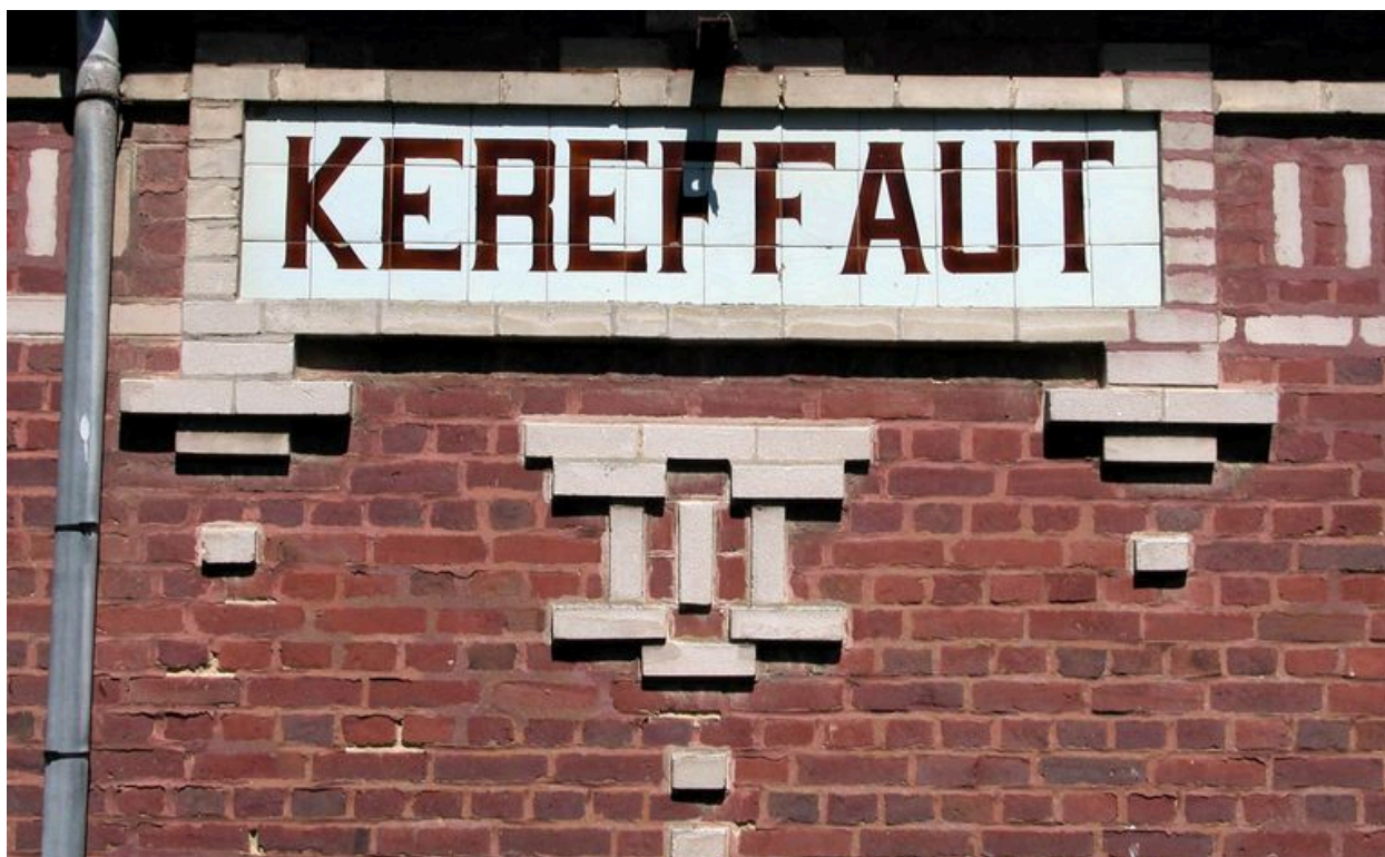
Détail de l'appellation, élévation antérieure.