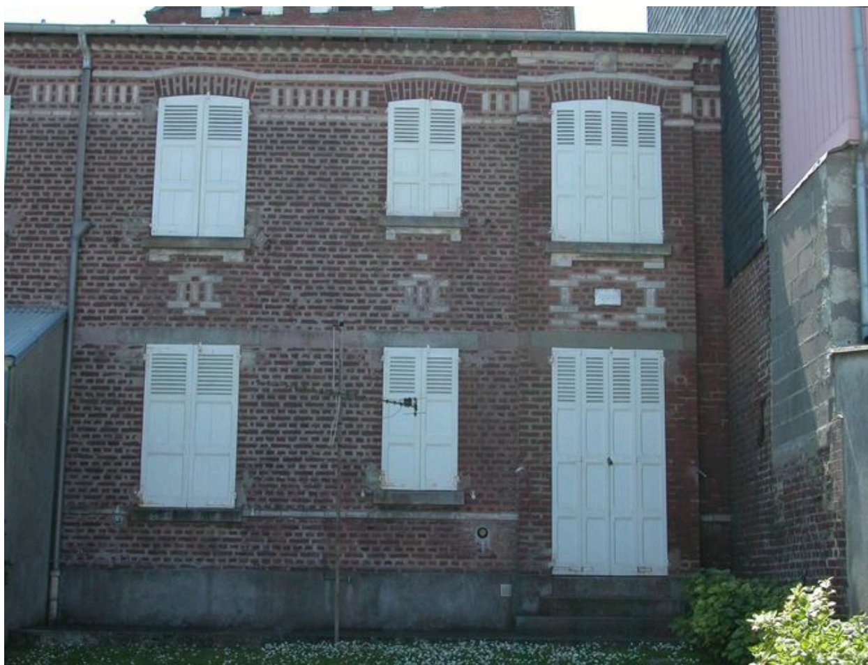
Détail d'une unité, élévation postérieure côté mer.