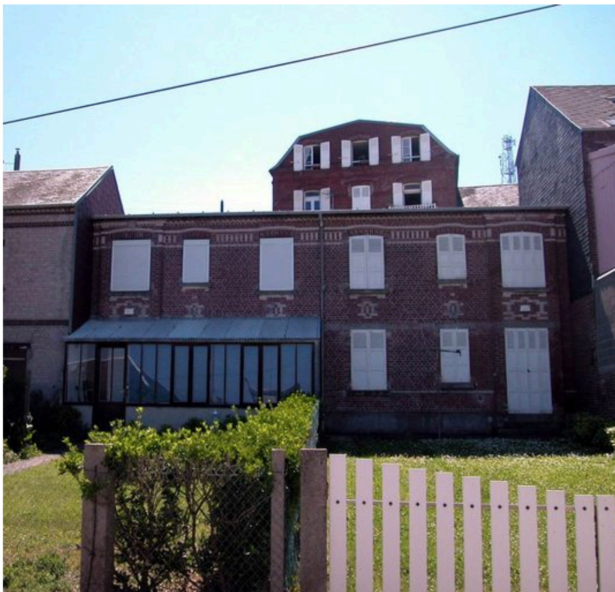
Vue d'ensemble depuis la rue de la Terrasse.