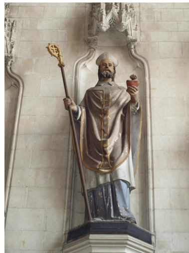
Vue générale, saint Augustin. IVR31_20106207681NUCA