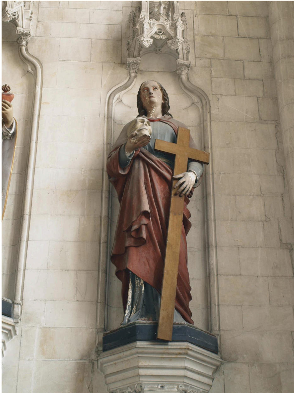
Vue générale, sainte Marie-Madeleine.