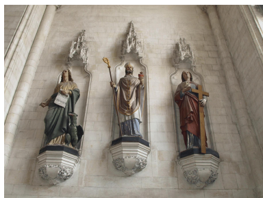
Vue d'ensemble. IVR31_20106207679NUCA