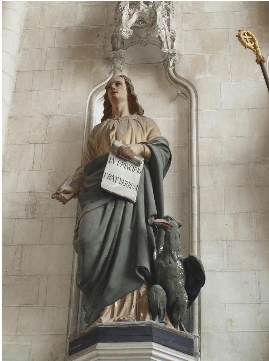
Vue générale, saint Jean l'Evangeliste.