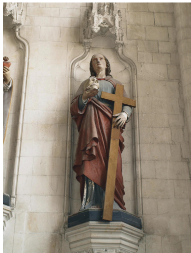
Vue générale, sainte Marie-Madeleine.