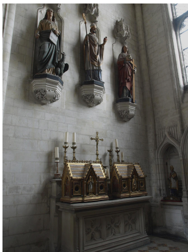
Vue de situation. IVR31_20106207678NUCA