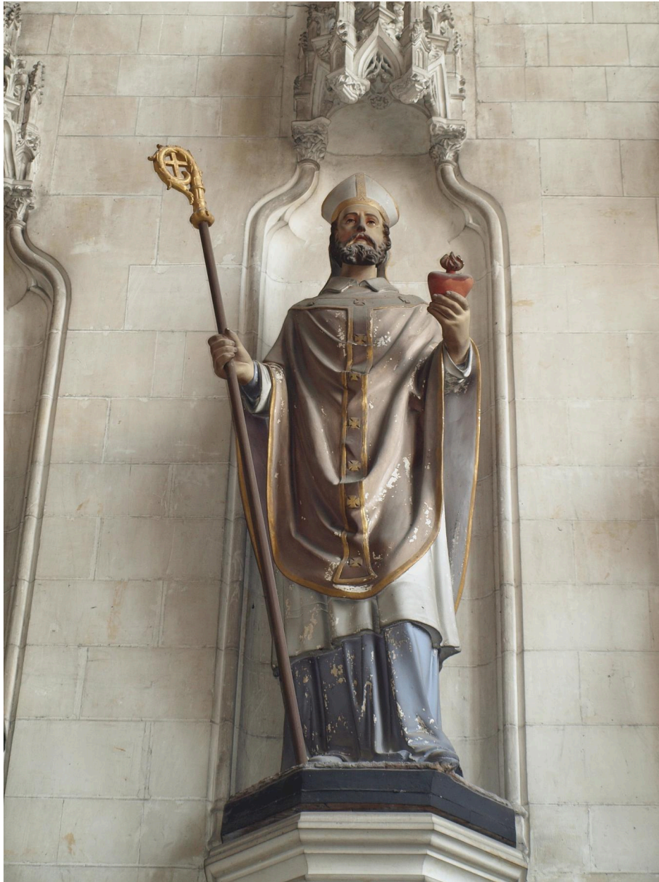
Vue générale, saint Augustin.