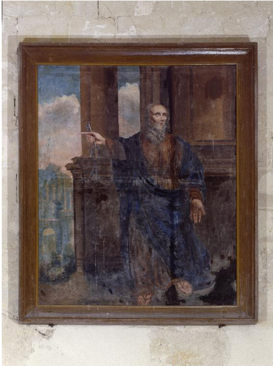
Vue générale du tableau.