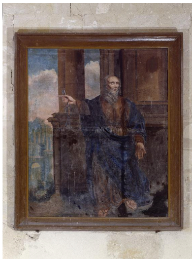
Vue générale du tableau.