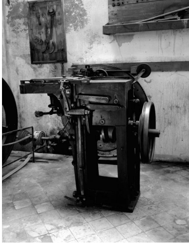
Vue de face. IVR22_19996000004X