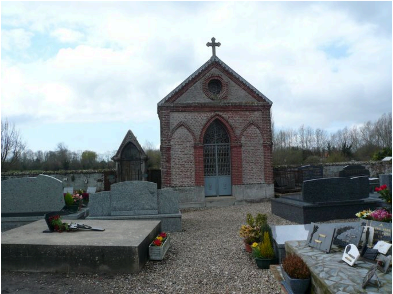
Vue d'une chapelle dans le cimetière.