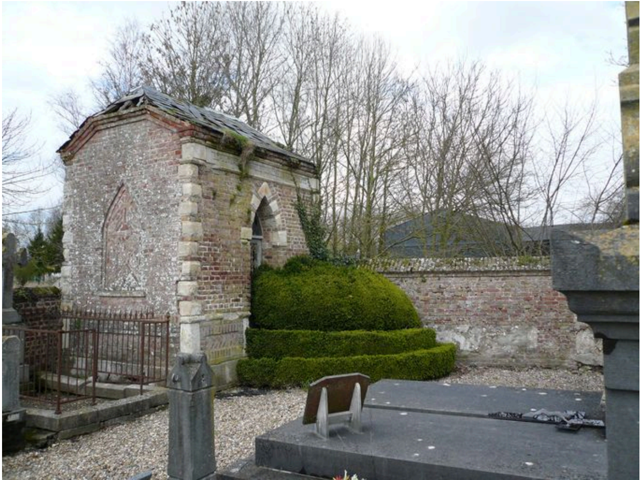
Vue d'une autre chapelle du cimetière.