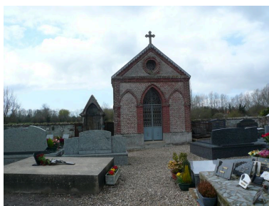
Vue d'une chapelle dans le cimetière. IVR22_20078005596NUCA