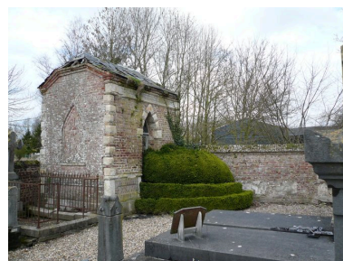
Vue d'une autre chapelle du cimetière.