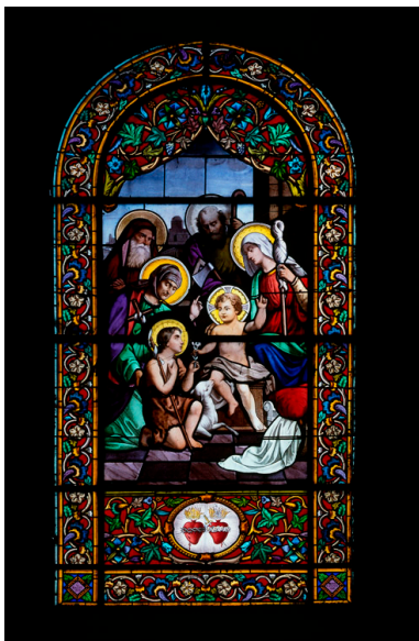
Vue générale. IVR22_19998000968XA