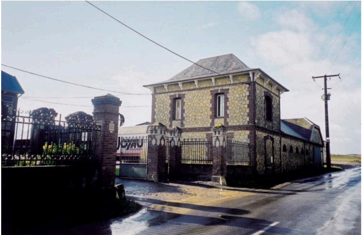
Portail et dépendance de la ferme.